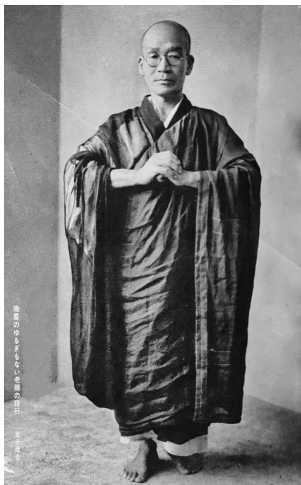
澤木禪師經行示範。

時，真的是萬籟俱寂、莊嚴肅穆。禪堂牆上有澤木老師之禪畫、毛筆字，皆老師生前手蹟送給如學上人之紀念。平日忙裏偷閒漫步靜靜欣賞，每一幅字畫皆禪意十足，令人賞心悅目，回味無窮。如《澤木興道全集》所載〈達摩不來東土，二祖不往西天〉、〈什麼之花〉、〈無一物中無盡藏〉、〈釣盡江波金鱗始遇〉、〈黑衣圓頂一身輕〉（扇子）、〈八面玲瓏無向背〉等 1 。啊！真不愧是「一代禪師」！澤木老師雖已於1965年飄然遠去，如學上人亦已於1992年順寂，但他們在世時留給禪佛教及後代學生、弟子們的影響依然德澤綿綿，直到永遠！