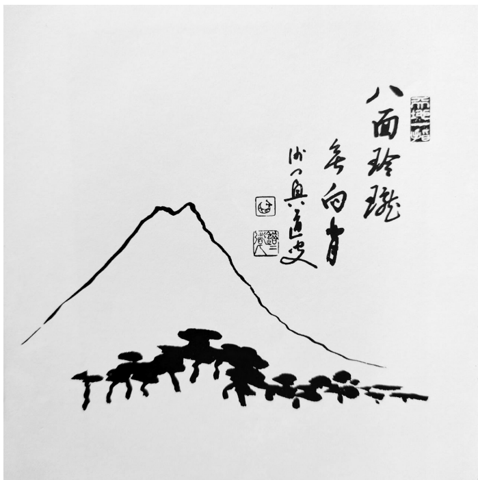
〈八面玲瓏無向背〉澤木禪師禪畫。

美哉中「華」，鳳鳴高「崗」，成立「佛教文化研究所」；光明山上再建「華梵佛學研究所」，以弘揚中華文化為己任。以佛為主，文、史、哲、詩歌、藝術等為輔，擷新儒家之長，善巧以度眾；汲印度文明精髓，禪那靜定思維修；倡般若思想，菩薩精神以濟世。工作即修行，從不浪費生命，精