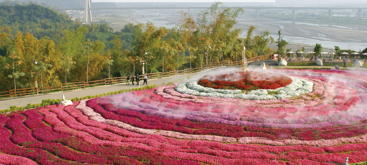
佛光山春節平安燈會結合花藝展，為教界首創。圖為「2005年春節花木奇石展」一景。

光山一遊，真有走入世外桃源般的愉悅感受，同時也帶動了之後台灣民間與政府紛紛舉辦各種大型的花藝展。