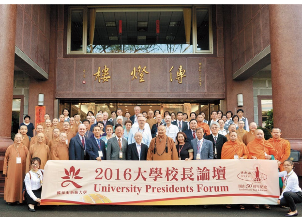
佛光山系統大學首度舉辦國際性「2016 大學校長論壇」，大師（前排右五）、慈惠法師（前排左三）與來自歐、美、亞、澳等四大洲 11 個國家、23 所大學的校長、學者合影於佛光山傳燈樓大門。2016.10

值得一提的是，在大齋堂的上千坪偌大空間裡，看不到一根柱子，這不但是傳統佛教寺院絕無僅有，即使是現代化的國際級建築中，也是難得一見。