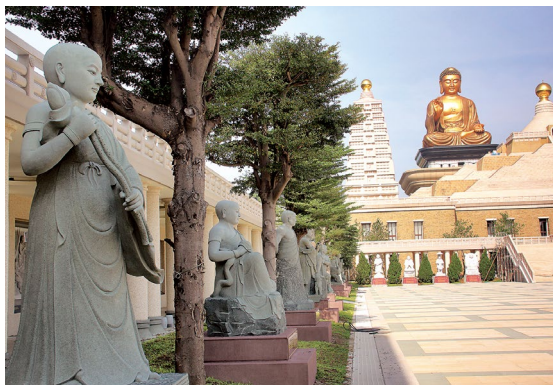
佛陀紀念館中，十八羅漢當中雕塑三尊女阿羅漢，顯示悟道無男女之別。圖左為蓮華色比丘尼。

尤其 2011 年落成的佛陀紀念館，儼然就是一部「佛法概論」，每一項硬體建築都有佛法的意涵在裡面。如菩提廣場兩旁的「十八羅漢」，當中有三尊女羅漢，代表的不只是「男女平等」，更是「眾生平等、佛性平等」的佛教核心思想。而本館上方的「四聖塔」，供奉觀音、文殊、地藏、普賢等四大菩薩，代表的是「從原始佛教『苦集滅道』的教理，到大乘佛教『悲智願行』的實