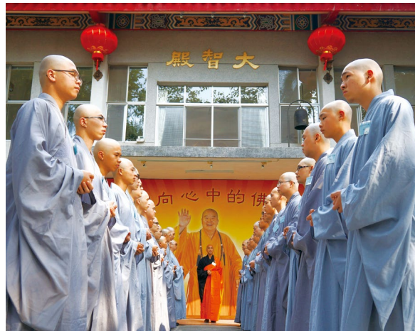
佛光山叢林學院男眾學部排班

三、不要只看佛光山的錢財，要看人才：佛光山不是一個富有錢財的道場，佛光山不儲財，也沒有餘財；佛光山所有來自十方信眾布施的淨財，都是用來創辦佛教事業，培養弘法人才。多年來佛光山在全世界留學的博、碩士有二百多人，其他所有入室弟子也都是經過佛教學院的專科教育，大家各就所長，分別在文化、教育、慈善、共修、社教等各個領域服務，這才是佛光跳躍的生命。