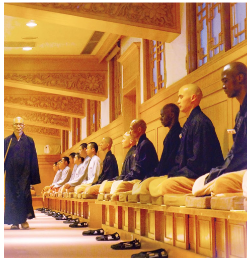
佛光山禪淨法堂平日禪修一景