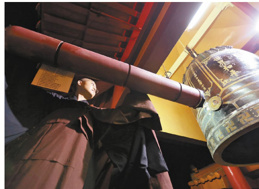
寺院的「晨鐘暮鼓」等鐘板訊號，提醒修行人二六時中應當精進修行。圖為佛光山自開山以來，五十九年如一日，早晚聽到鐘鼓聲的來源處——佛光山叢林學院鐘鼓樓。