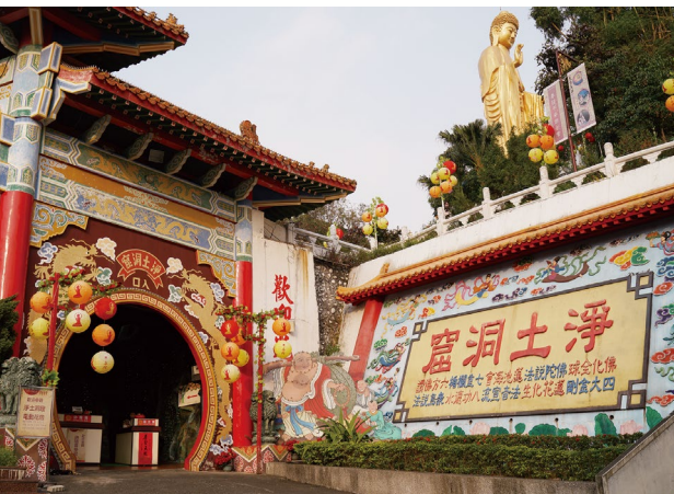
佛光山淨土洞窟入口處