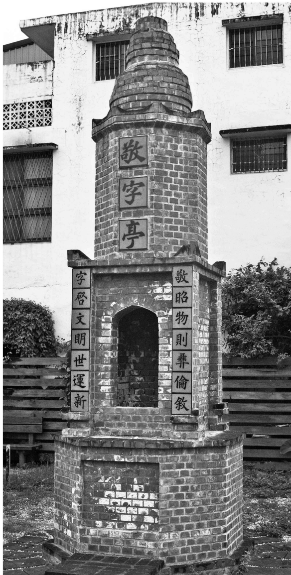
花蓮鳳林校長夢工廠敬字亭