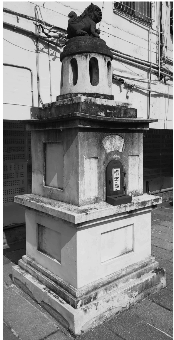
苗栗文昌祠惜字亭