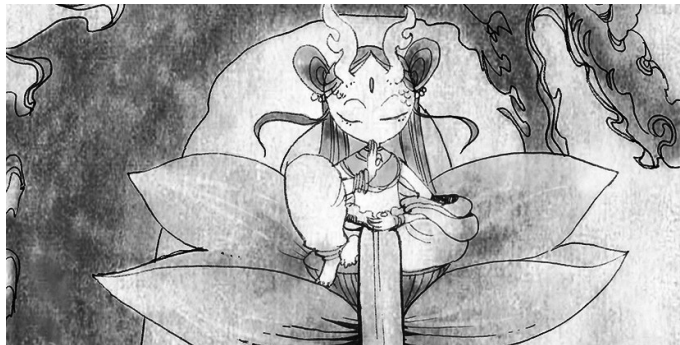
八歲龍女即身成佛（啞謎 / 繪）

除了娑竭羅龍王在海的世界裡地位崇高之外，其龍女也是非常傑出的佛教徒，《妙法蓮華經·提婆達多品》中即身成佛的八歲龍女，即是娑竭羅龍王的小女兒。文殊師利菩薩云：「有娑竭羅龍王女，年始八歲，智慧利根，善知眾生諸根行業，得陀羅尼，諸佛所說甚深秘藏，悉能受持。深入禪定，了達諸法，於剎那頃發菩提心，