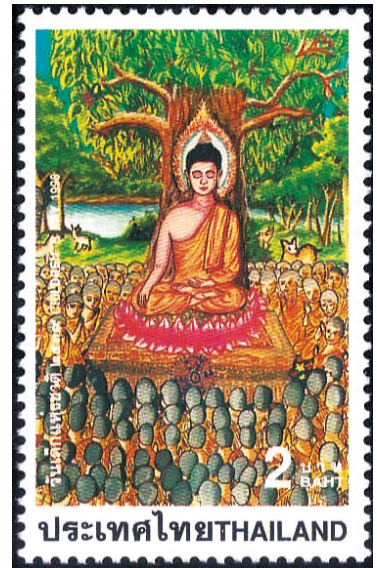
佛陀於鹿野苑說法圖（郵票）

放眼看今日社會的豪門鉅富，徒感嗚呼哀哉，子女爭財產，對簿公堂，無念親情，彼此誹謗，皆由貪欲引起，不知人世無常。佛陀聖誕之際，引用經典數語，在感念佛陀大智恩德之餘，祈願人心走向清淨，社會祥和、世界和平。