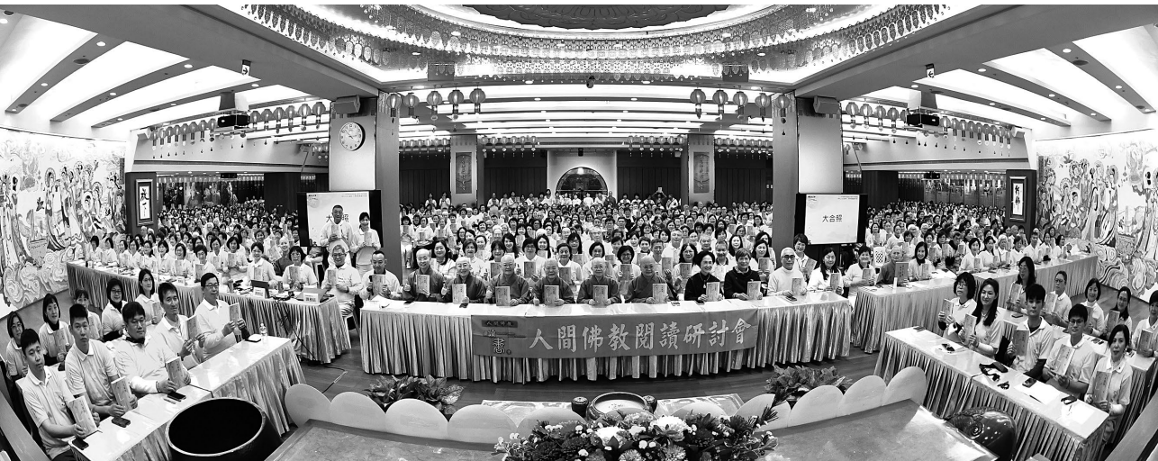
由人間佛教讀書會及佛光淨土文教基金會共同主辦的2025年人間佛教閱讀研討會，首場於佛光山台北道場舉行。

佛光山作為現代化的佛教寺院，在應對文化多樣性與現代教育需求時，提出了「人間佛教」教育體系。通過各類道場和社區活動，佛光山成功地將佛教教義融入當地文化與生活，體現了佛法的當代價值延伸。現代寺院不再僅是禮佛的場所，更具備了社會教育與文化功能。星雲大師提出的「佛法生活化、寺院本土化、僧信平等化、生活書香化」等理念，為當代寺院賦予了全新的功能。 58 例如，