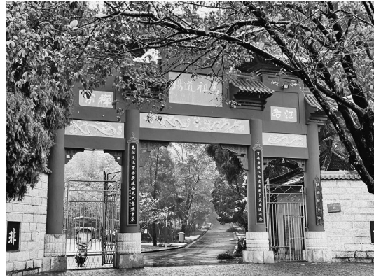
馬祖道一禪師曾多次到江西寶峰寺弘法，寶峰寺因此成為馬祖弘法的重要道場。

唐天寶年間（744），馬祖道一來在建陽佛跡嶺（今福建建陽），創立第一座山林道場，聚徒講法安居修行。此後，他陸續前往臨川西里山 8 （今江西撫州市）和南康龔公山（今江西贛州市寶華山），所到之處皆聚徒傳禪，創建叢林安居禪僧。766年至779年間，馬祖駐錫鐘陵開元寺（今江西進賢縣佑民寺），廣受弟子追隨。《馬祖語錄》記載，馬祖道一門下弟子眾