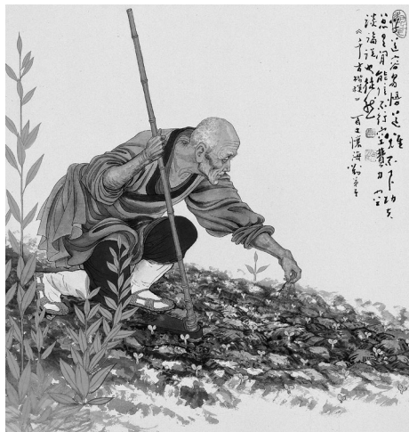
百丈懷海禪師一日不作，一日不食。圖為禪畫禪話《千古楷模》。（高爾泰、蒲小雨/繪）

眾在修行之餘參與農務，強調集體合作與勞動修行，融合儒家身體力行的精神與中國宗法倫理。 20 叢林制度藉由嚴謹的作息安排與儀禮規範，塑造了中國佛教獨特的修行生活方式。