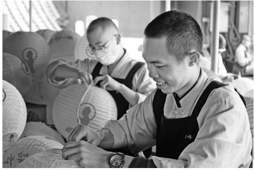
叢林出坡作務也是一種修行

星雲大師進一步強調了修行的多元性，具體而言，叢林作務、精研佛學、接引十方、宣揚聖教、慈悲喜捨、禪淨戒行，甚至以正心誠意為國利民，都是修行的範疇。大師期望佛光人能深刻理解修行的真諦，以發心成為社會的貢獻者，而非分