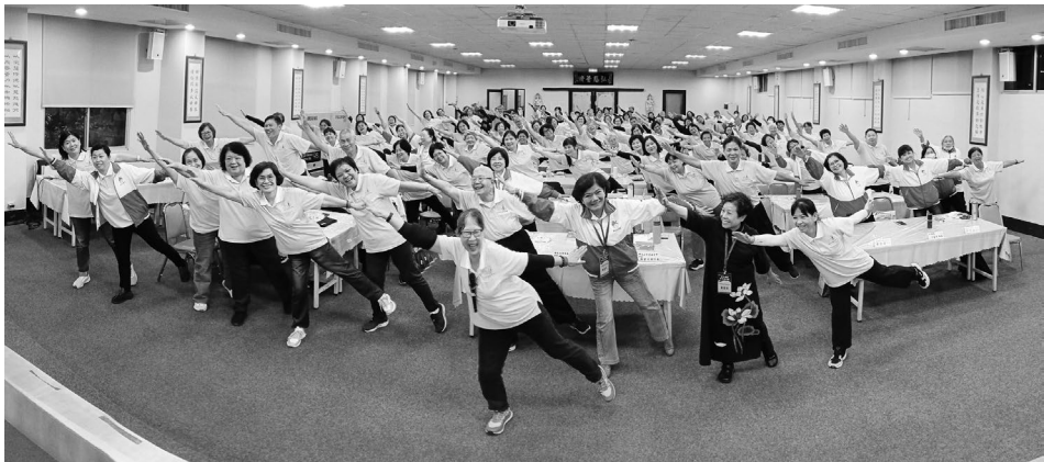
佛光山慈悲社會福利基金會落實慈善方便法門，舉辦「2023年佛光友愛服務隊在職訓練」，引導隊員增上關懷長者技能。

總而言之，太虛大師和星雲大師的觀點共同強調了人間佛教的實踐重要性，提倡在當下的生活中實現菩薩道，以慈悲和智慧來護念眾生。人間佛教不只是追求個人的精神解脫，而是建立在對當前