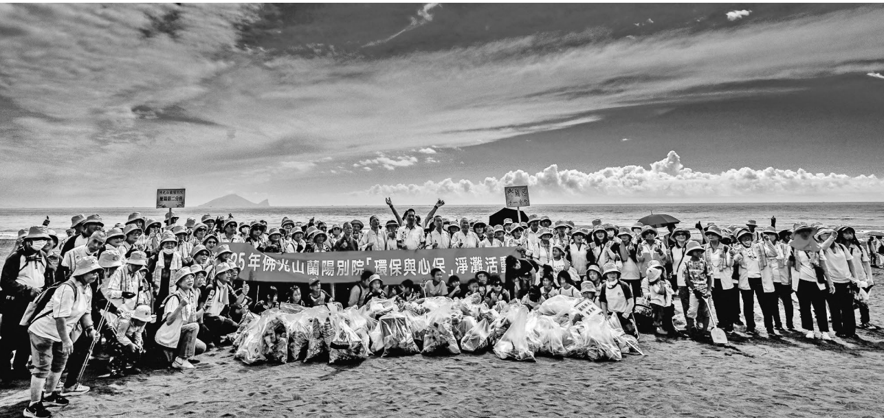
人間佛教積極參與改善人間的事務，圖為佛光山蘭陽別院舉辦淨灘活動，為地球永續發展盡一份心力。

星雲大師講求人間現世，積極推動「人間佛教」，希望透過持續的教化過程，最終完成建立人間淨土的宏願。這一理念不僅強調了佛教對於個人心靈的影響，更促進了社會的和諧與進步，使得每個人都能在日常生活中實踐菩薩的價值觀，積極參與改善人間的事務，從而共同邁向更加美好的未來。星雲大師強調的「人間佛教」