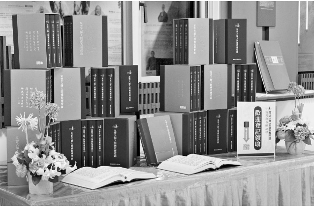
有心研究者即能具名索取《星雲大師人間佛教傳燈錄》

此一整理，展現出大師思想的完整輪廓與整合成果，也為當代學術界探討人間佛教思想、宗教現代化進程及佛教組織轉型等議題，提供了兼具理論深度與實證基礎的詮釋框架與第一手資料。