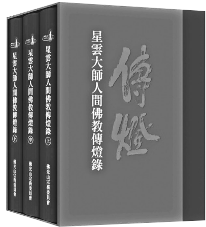
《星雲大師人間佛教傳燈錄》一套 3 冊，共百萬餘字。

本文主要聚焦於星雲大師及其所創建之佛光山教團體系弘揚的人間佛教。星雲大師畢生以文化、教育、慈善、共修四大事業實踐人間佛教，更以現代化、生活化、制度化、國際化的方式，將人間佛教理念廣泛落實於全球華人及國際佛教社會之中。特別是在 2023 年大師圓寂後，隨即由佛光山弟子組織編纂的《星雲大師人間佛教傳燈錄》 1 ，以系統性的方式，歸納並記錄現代人間佛教理論與實踐歷程的重要文獻。