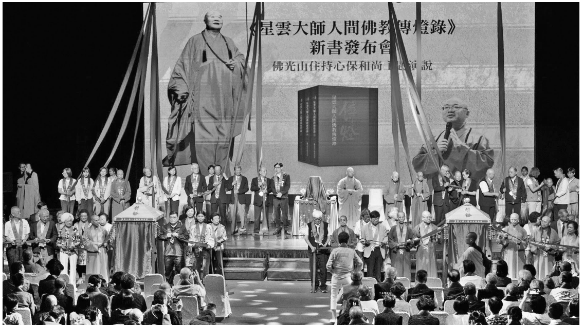
《星雲大師人間佛教傳燈錄》新書發表會於佛館大覺堂舉行，吸引兩千人與會。

星雲大師所開創的以佛光山為代表的人間佛教，以面向現代社會和人生為主要特徵，不僅在中國佛教理論上得到了充分的論證和肯定，而且成為一種實實在在的具體實踐傳播於世界各地。 25