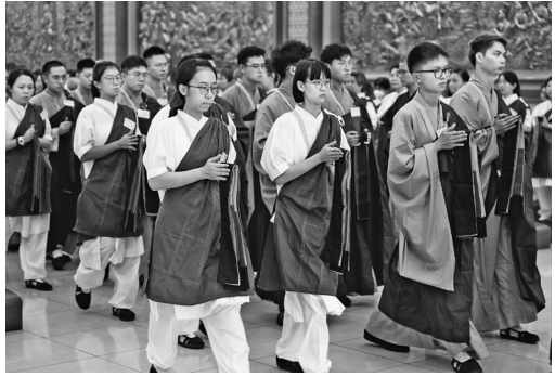
近 300 位戒子在馬來西亞東禪寺參加短期出家。

3、生活律儀·人間生活的修行：列舉 14 種法門，如〈十修歌〉、《佛光祈願文》、每日自課、生活律儀百事、人間佛教讀書會等，是應對日常生活各種挑戰，使佛法內化於心念與行儀的修行指南。