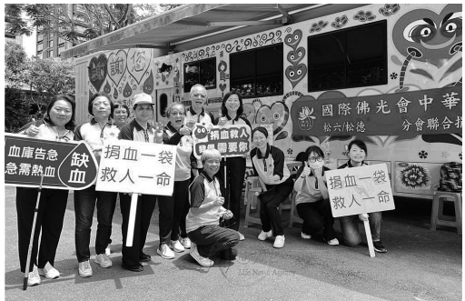
國際佛光會松德、松六分會連袂善舉，奉行三好四給。