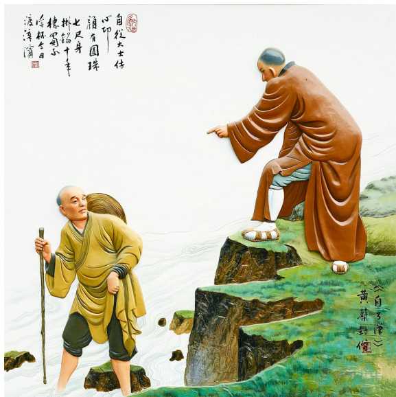
星雲大師批評只重自我解脫的「自了漢」傾向。 (自了漢，高爾泰繪)

做人世的事業」。這八字箴言辯證地統一了超越的智慧（出世）與濟世的行動（入世），並以「慈悲、般若、菩提」為核心方法，指出真正的解脫之道在於以智慧為導、以慈悲為用，在積極服務社會中體現菩提心的佛教——人間佛教的精神。