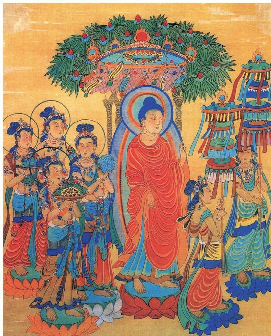
佛陀是人不是神。(臨敦煌釋迦說法圖 張大千/繪)

生活方式。「人間」二字，正是將佛教從神壇請回我們的日常生活、人倫關係與社會責任之中；闡明覺悟不在他方，而在當下的言行與起心動念之間。