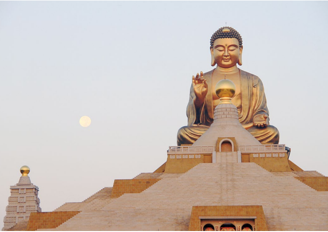
佛法僧三寶，在我們的自性上，原本具足，若能體認「人人皆有佛性」，則信心必能增長。圖為佛陀紀念館佛光大佛

使我們的精神富有。但此三寶原來就是我們本有的，無需去求。好比佛如光，我們沒有光明照耀嗎？法如水，我們沒有流水使用嗎？僧如田，我們沒有站立的地方嗎？