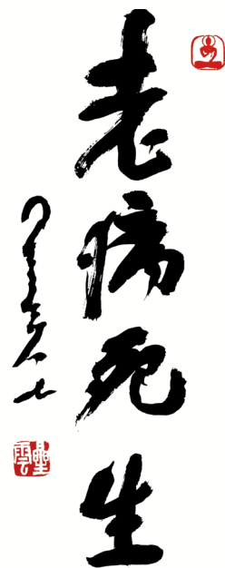
大師一筆字書法 「老病死生」

佛教裡有一句經常勸導世人的話說：「人生是苦。」說明這世間有二苦、三苦、四苦、八苦、無量諸苦等。尤其四苦「生老病死」是人們最常面對的現實。