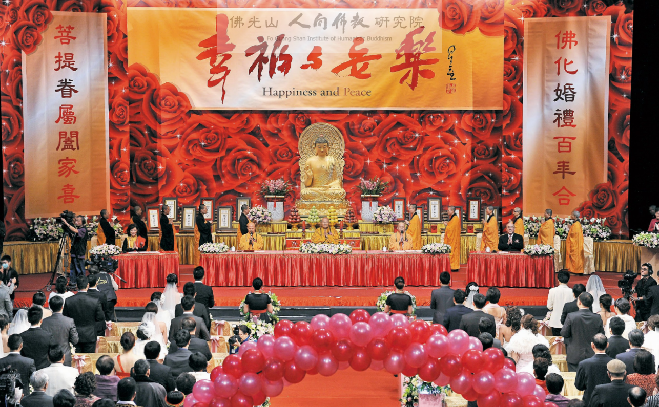
「幸福與安樂」佛化婚禮暨菩提眷屬祝福典禮，在佛館大覺堂盛大登場，佛光山開山星雲大師（中）親為海內外 500 對新人與菩提眷屬證婚祝福。2013.01.01