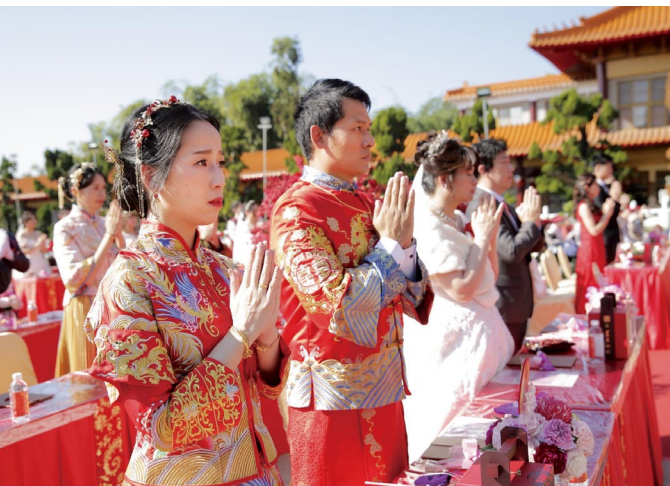
「2022年百年好合·佛化婚禮暨菩提眷屬祝福禮」於佛光山大雄寶殿前舉行。

大師所帶領的佛光教團，提倡八宗兼弘、不捨一法，以生活化、大眾化、通俗化、現代化、本土化、藝文化、音樂化、電影化、體育化、科技化等等方式，將古老的佛教改造成現代的佛教，創造適應當代人心思潮與人類幸福的教法。