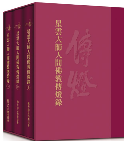
2025 年 5 月 16 日發行的《星雲大師人間佛教傳燈錄》。

大師在世界各地建立了數百個分別院、數百個佛光會，把佛教變成一個由不同種族、不同膚色、不同地域的人共同信仰的真正意義上的世界性宗教。讓「佛光普照三千界，法水長流五大洲」成為現實。在這一點上，不能說後無來者，但絕對是前無古人。 1