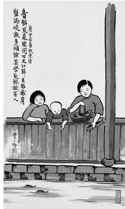
捨與得——唐白居易放魚詩（豐一吟／繪）

「隨緣」是自他互易立場，隨順當前的環境，但決非隨便行事，苟且偷安；「不變」是擇善固執，一以貫之，但不是墨守成規，泥古不化。40年前剛來台灣時，當地同胞大多赤腳，足履羅漢鞋的我反被視為異類，因此索性將鞋子扔了，穿著一襲破舊的短褂和大家一起工作，以求入境隨俗，同事攝受。數年後，駐錫宜蘭弘法，我換上整齊的衣履現身度眾，並且不惜節省飯錢，為弟子買布縫衣，乃至多花一倍的價錢購買僧鞋，以增加商人的利潤。直到現在，我仍主張僧裝的整齊統一，以促進佛教的團結發展。