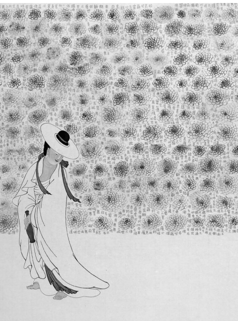
一個身軀能幾日 勿為閒事 長無明（王卉娟／繪）