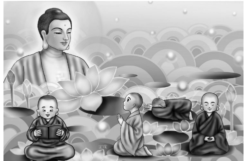
應共善人住，親近於善者（道璞法師/繪）

「應共善人住，親近於善者， 從彼人受法，得利不生惡。 應共善人住，親近於善者， 從彼人受法，智者得利樂。 應共善人住，親近於善者， 從彼人受法，智者得名譽。 親近於善者，從彼人受法， 智者得解慧，是故應共住。 親近於善者，從彼人受法， 親族中尊勝，能離於憂愁， 於一切苦中，而能得解脫。 遠離諸惡趣，能斷一切縛， 純受上妙樂，得近於涅槃。」 35