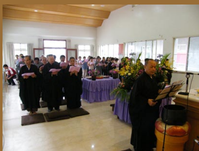
大眾誦念浴佛儀軌