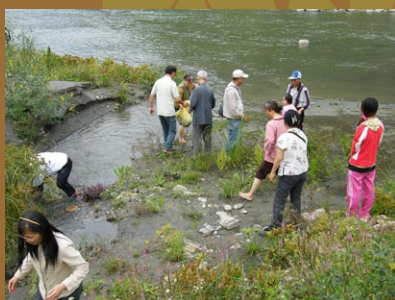
接力搬運生物到溪邊