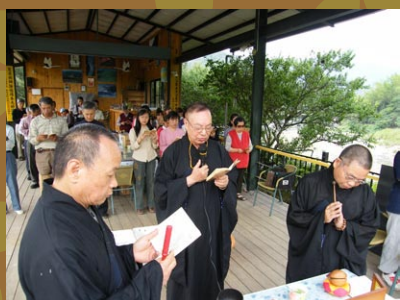
黃董事長主持皈依儀式