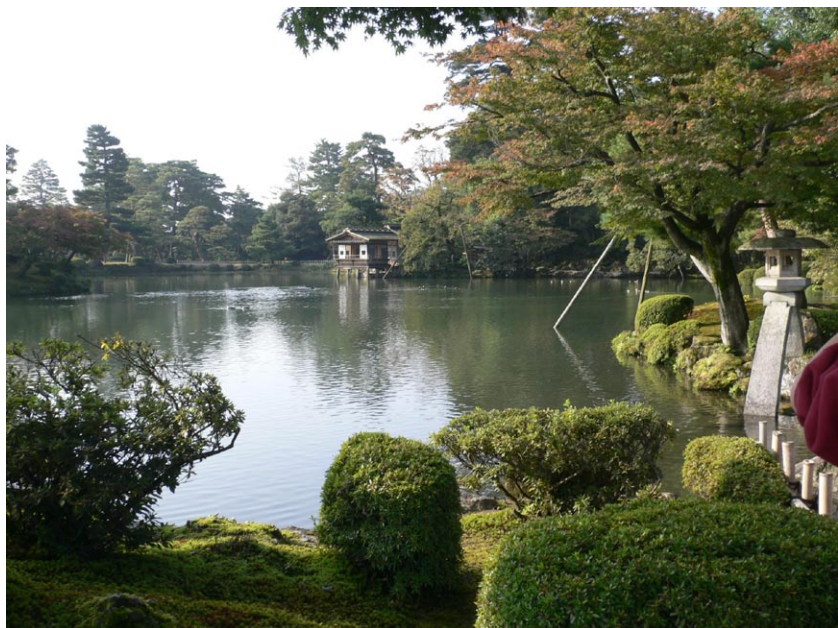
◎日本金澤兼六園夏景

二十年前，我去日本，當時是要去看日本人他們的日常生活品質，以及探討他們的公共設施。看他們都市內的水溝，都挖至少有三公尺深，太陽晒不到，水不會硬化、不會臭、不