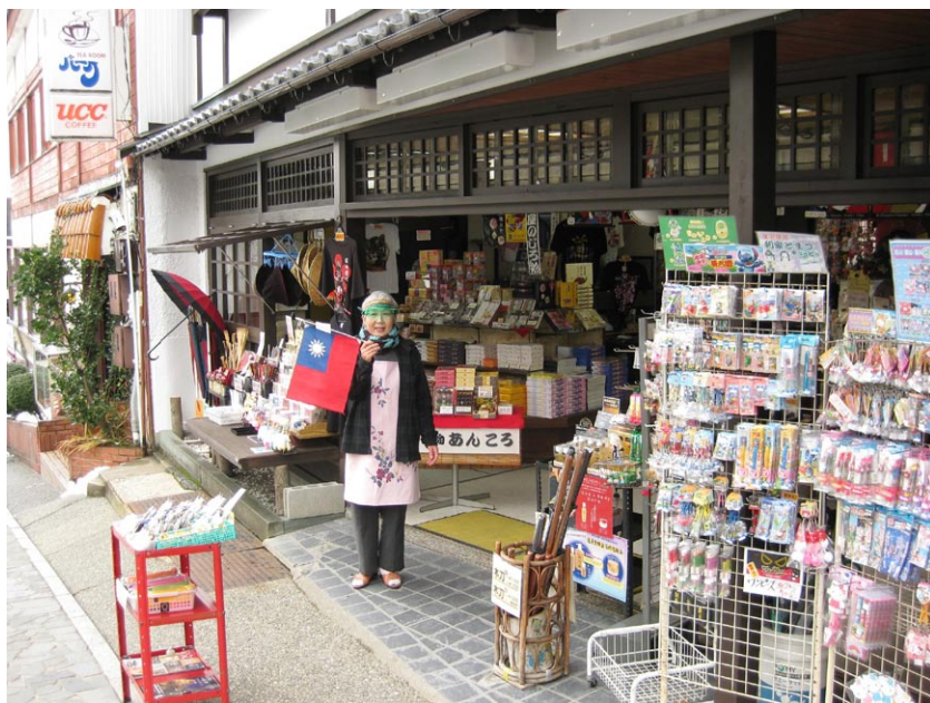
◎兼六園沿路店家揮舞中華民國國旗

中外已發現的生命輪迴、靈魂轉世之案例甚多。近代醫學、超心理學、靈魂學，也深入探究，發現眾多可證明的事例。美國維吉尼亞大學神經與心理治療教授，也是英國心靈研究社一九八八的總裁艾恩·史蒂文生博