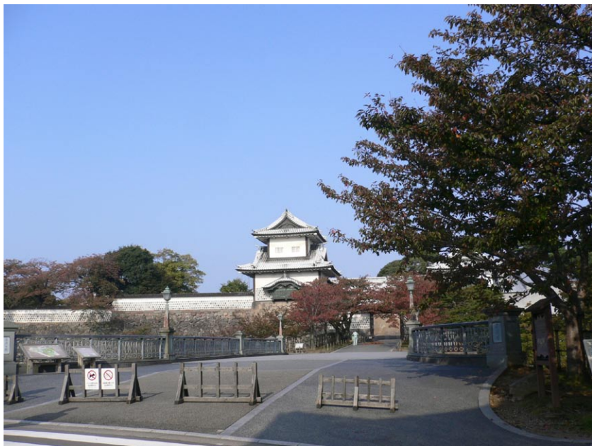
◎兼六園旁邊的金澤城夏景

自性的法寶被蒙蔽了，這人的行為就比較沒辦法端正。像殺官劫庫的人，雖有自性法寶，卻沒有彰顯出來，自性法寶就是內心端正的標準。我們把它解釋為道德標準也好，倫理觀念也罷，通通都是。「自性僧寶」解釋為「自性的淨」，就是內心的清淨。「自性三寶」的「覺、正、淨」，本來我們內在都有，但顯現不出來，必須透過住持三寶，幫助我們來學佛、學法、學僧。學了佛让我的覺性更能開展出來，學了法讓我更端正，學了僧讓我更清淨。學佛法僧，就是透過住持的三寶，來帶動我們內心的自性三寶，使他彰顯出來。當