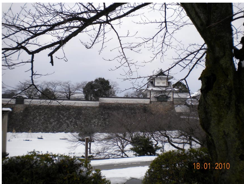
◎兼六園旁邊的金澤城冬景

中國從梁武帝開始到現在，年年都舉辦盂蘭盆會？因為這部經的宗旨是要教人盡孝道，故以孝慈為宗。經裡說的孝道，不是說我有做孝順的事就好了，孝只是一個方法，我們雖