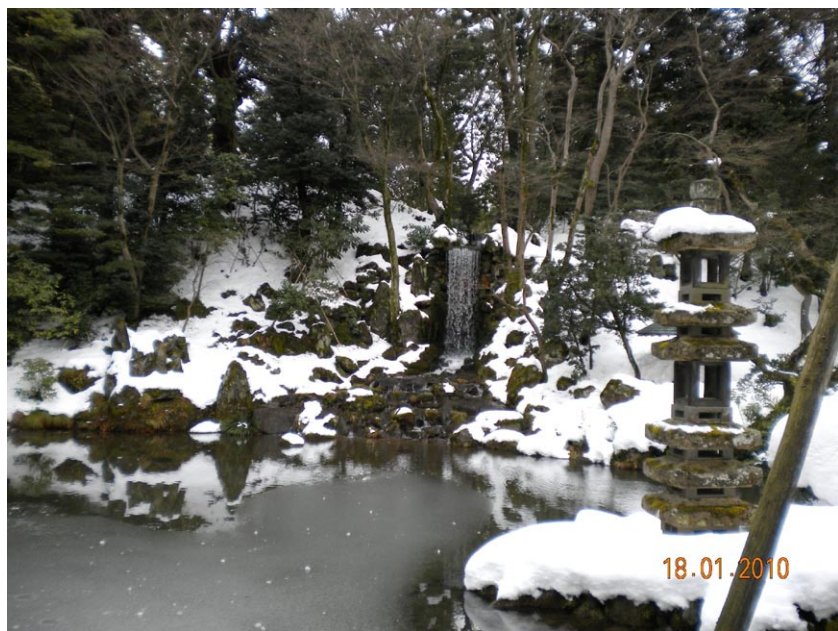
◎兼六園一隅（冬景）

「阿彌陀佛」。「無間緣」是指每天做功課，但是沒有「早普門，晚彌陀」這樣複雜的規定。印光大師從頭至尾只有念一句「阿彌陀佛」。他是大勢至菩薩示現的聖人，他在蘇州靈巖山，除了每天五堂功課外，沒有誦額外的經書，只有念一句「阿彌陀佛」。他的寮房只有一個大字「死」，下面寫著：「念佛之人，念念不忘此