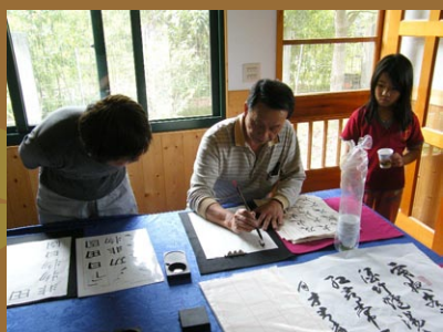
邱老師指導學員練習