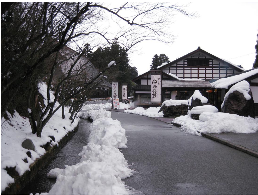
◎日本傳統工藝村冬景

在學習的兒童，真的不可不慎。她嚴肅的告訴妹妹這件事對小姪女的影響，小妹也意識到他們夫妻觀念的不對之處，於是，開始研究改善的方法。