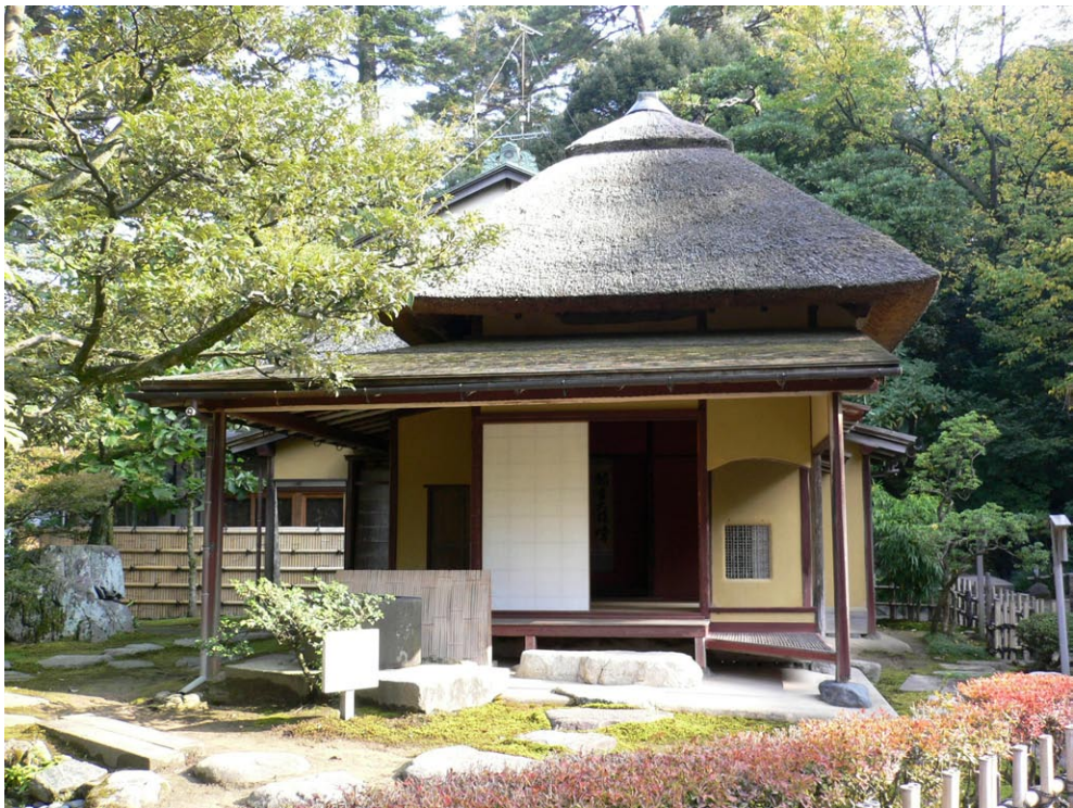
◎兼六園夕顔亭

生，希望師父們來念佛十小時吧。竹溪寺知客師仁妙法師、蔭妙法師聽了，馬上趕來探望，那時十點四十分了。仁妙法師對母親說：「阿雲！阿雲！妳怎樣啦？」母親沒有回答。仁妙法師又說：「妳現在不必說話，我問妳的話，假如對的，妳就點點頭，不對的話，妳就遙遙頭啦！」這樣問了好幾件事情，果然母親有時點點頭，有時遙遙頭啦！那時已十一點四十分了，仁妙法師、蔭妙法師有事就先回寺去。我們姊妹兄弟一直不間斷的念「南無阿彌陀佛」的聖號，到了中午十二點整，母親就安詳往生佛國了。我馬上又打電話請師父們來。仁妙法師、蔭妙法師剛回到寺裡，一聽到我的電話後，大聲說：「阿雲自知時至，很快樂往生啦！」隔天二十七日的晚上，母親回來給妻子夢見。妻子問母親：「您老人家現在在哪裡呢？」母親說：「我在西方極樂佛國啦！」因母親在這三年裡，都是妻子為老人家洗澡的，所以回來說明，好讓我們知道啊！