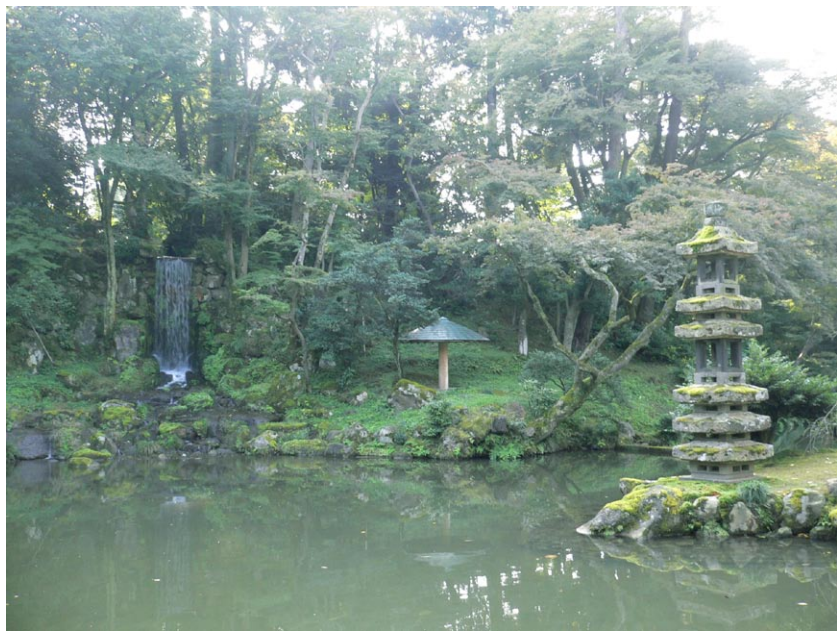
◎兼六園一隅（夏景，真量攝）

人若談到往生極樂，就會說等下輩子吧！因為這太遙遠了。其實每個人都應該要有當生就要往生極樂世界的願力。想要去，但是又有家中之妻女所牽絆。怎麼辦？應該要將娑婆一切因緣放下。外界有人質疑，做人要有情有義，為何佛教徒如此自私？這聽起來好像是對的，但事實上似是而非。試問我們不放下又能如何？總有一天還是要把一切放下。我們如果修行功夫夠好，生死的了脫可以自己做主。問題是我們是否有此能力？若無此能力，當無