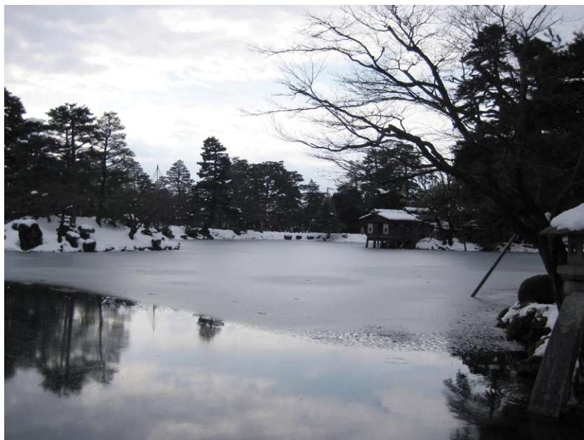
◎日本金澤兼六園冬景