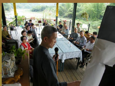
簡老師講解五行養生觀