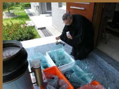
黃董事長為生物灑大悲水