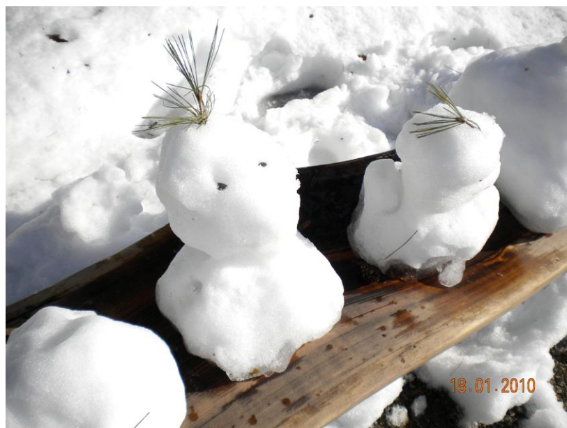
◎兼六園裡的雪人（周彥君攝）

關。於是這蛇就化為人身到官衙說：三天之內要將我的父母放出來，不然會讓他們死的很難看。但是，官府人員堅持沒抓到蛇不放人。於是他就起瞋恨心，到河中喝水，然後淹死村民三千多人。不久死後因瞋恨心使然，又去出世為