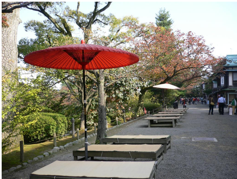
◎兼六園商店街