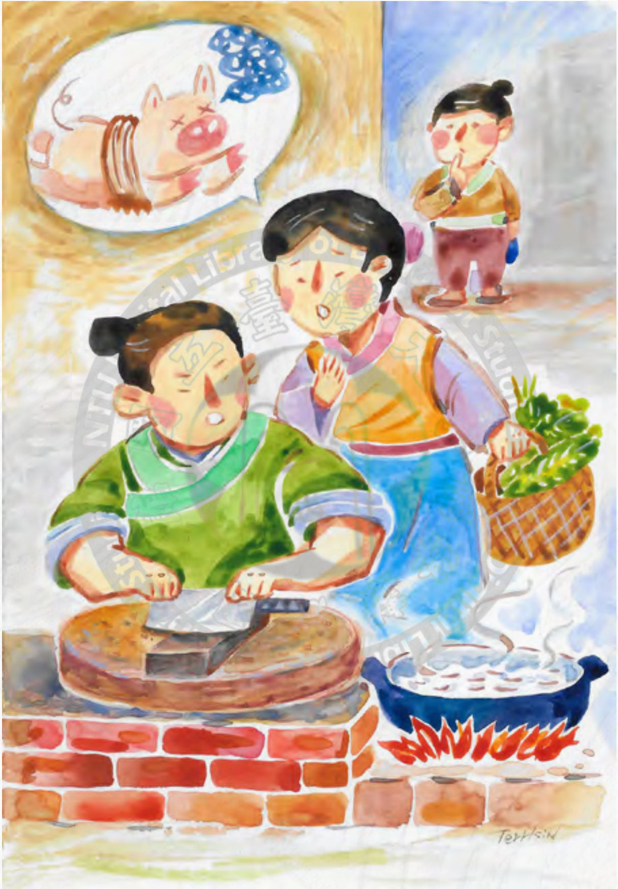
恭錄自 蔡禮旭老師《小故事大智慧》