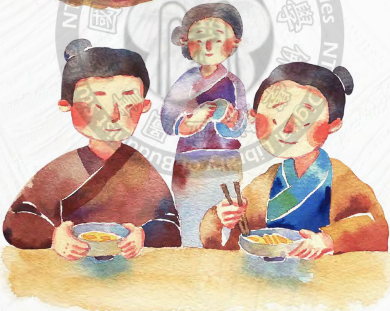
恭錄自 蔡禮旭老師《小故事大智慧》