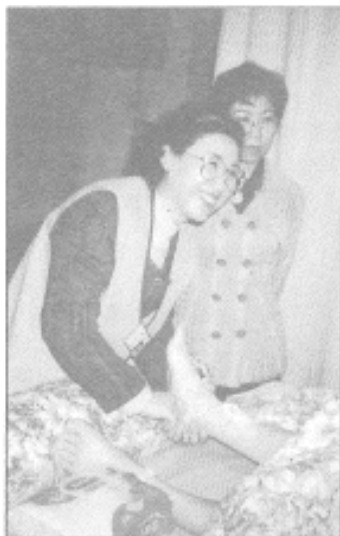
◆台大醫院六樓緩和病房起居室