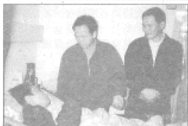
◆福德社服八年，難怪部長最有人緣。