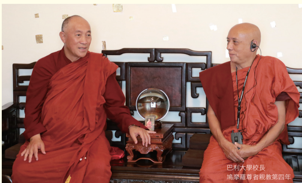
巴利大學校長 鳩摩羅尊者親教第四年

發行人：心道法師 編審單位：宗務堂宗長室 編輯：靈鷲山企劃組 執行編輯：楊振暉 美術編輯：傅華麗 發行單位：靈鷲山佛教基金會 編輯處：新北市永和區保生路2號20樓 服務專線：(02) 8231-5789 聯絡傳真：(02) 8231-5818 www.ljm.org.tw