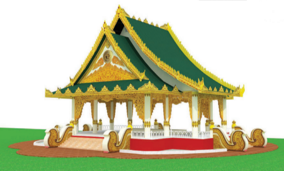
觀音殿設計規劃示意圖