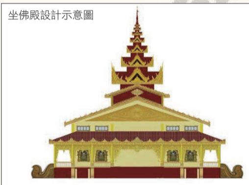
坐佛殿設計示意圖

三佛殿之一坐佛殿經過一年的規劃與設計，已於6月初發包施工。在法師的祝禱之下，目前地基結構已完成，預計明年(2019年)將落成啟用。