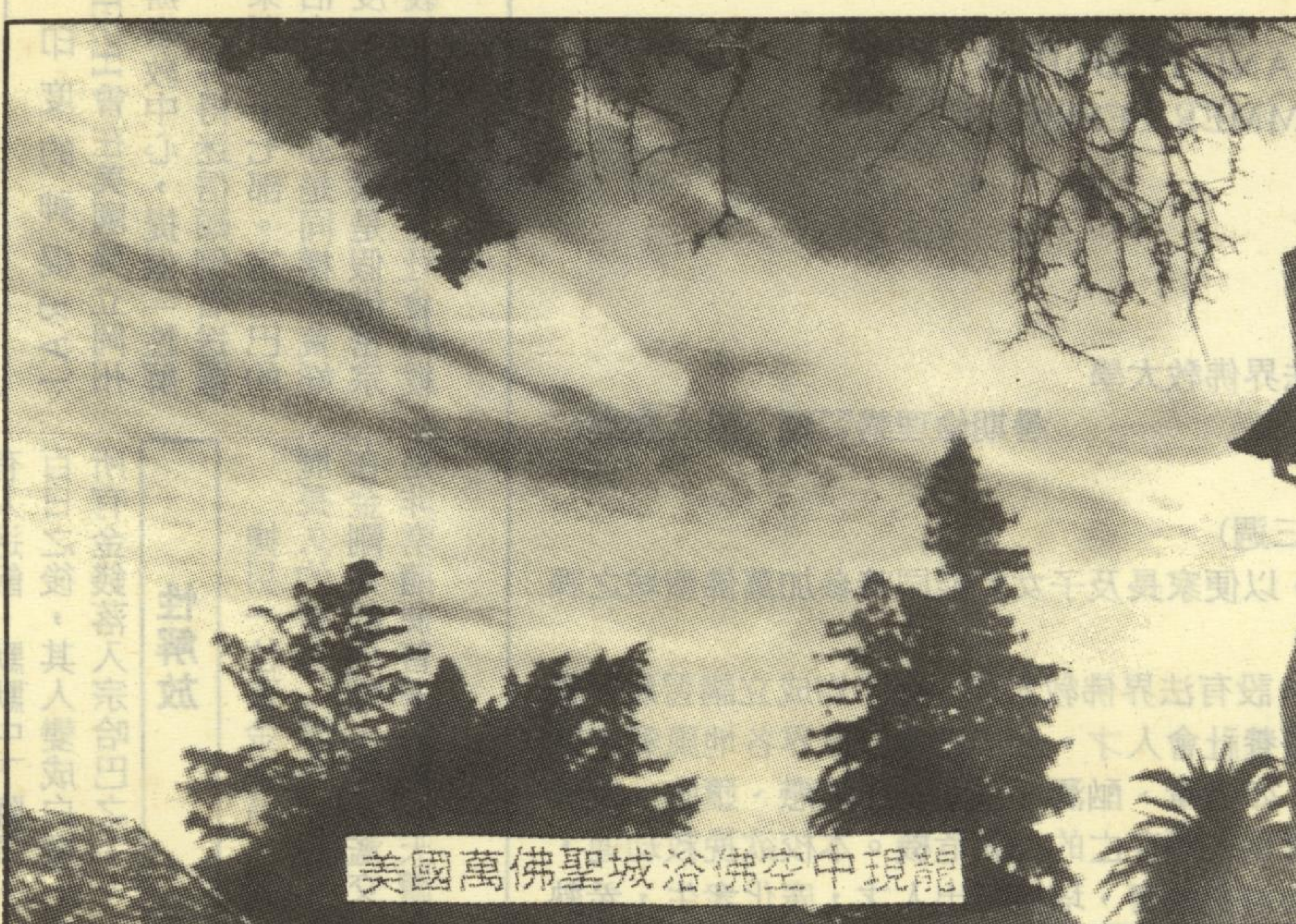
美國萬佛聖城浴佛空中現龍

發願就要時刻遵守，不可有自私的心、自利的心、爭論的心、貪欲的心、企求的心、妄語的心。沒有這六種心，便是正法時代，可將末法轉爲正法。如有這六種心，就是末法時代，可將正法轉爲末法。若能本著這六大宗旨來處理一切事情，一