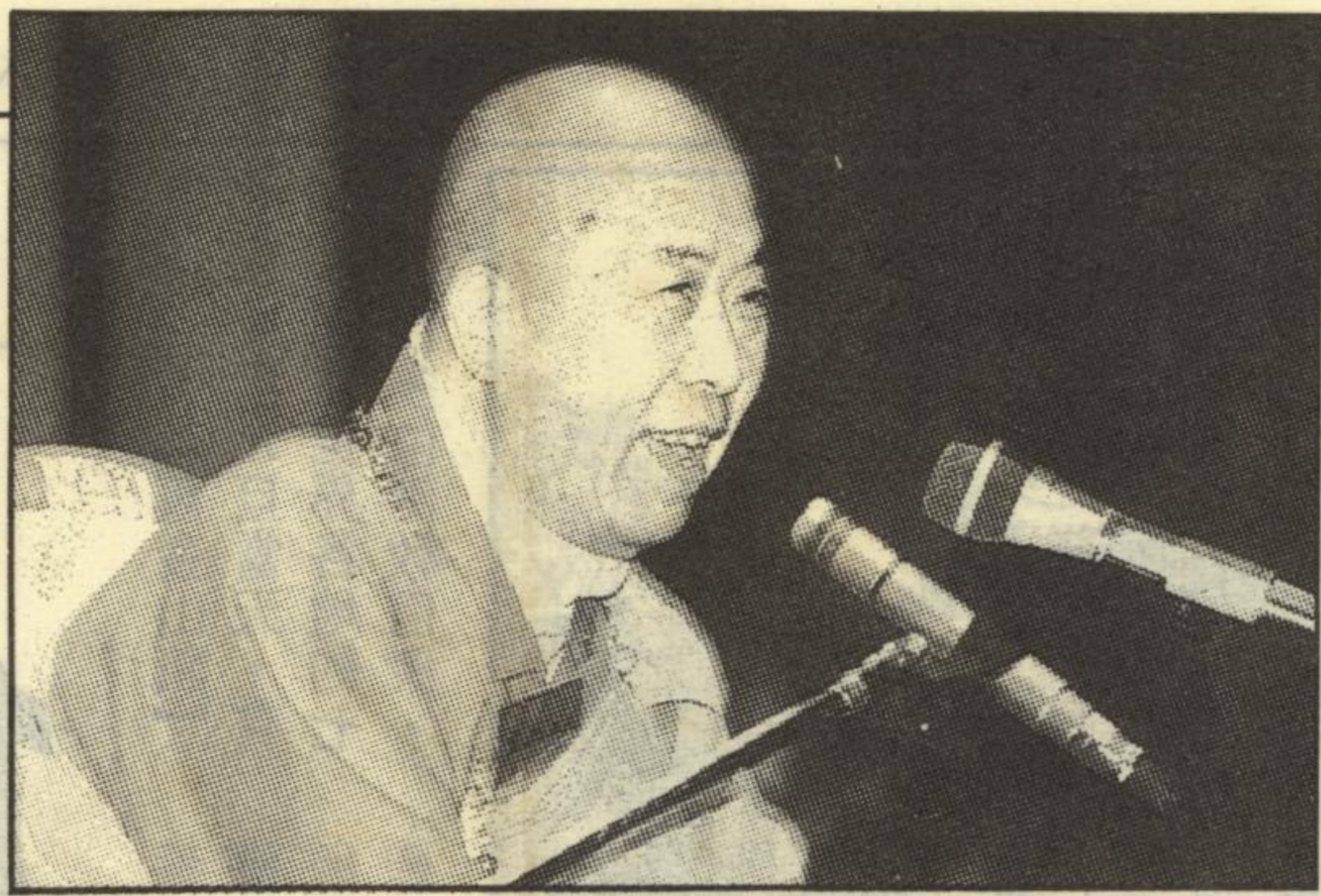
【記錄者按】：宣化上人是吉林省雙城人氏，俗姓白，父富海公，一生勤儉治家，務農為業。母胡太夫人，生前茹素念佛，數十年如一日，從未間斷，好善樂施，有求必應，認為「為善最樂」。鄉里稱讚不已，稱為活菩薩。

於戊午年三月十六日，在夜間太夫人夢見阿彌陀佛降臨，身放金光，照耀世界，震動天地。驚醒之後，異香撲鼻，其味非常，清徹肺腑，真是不可思議的境界。不久，宣公降生人間，連哭三天三夜不止，蓋覺娑婆世界之苦不堪忍受。今將宣公上人自述出家的因緣，摘錄如下：