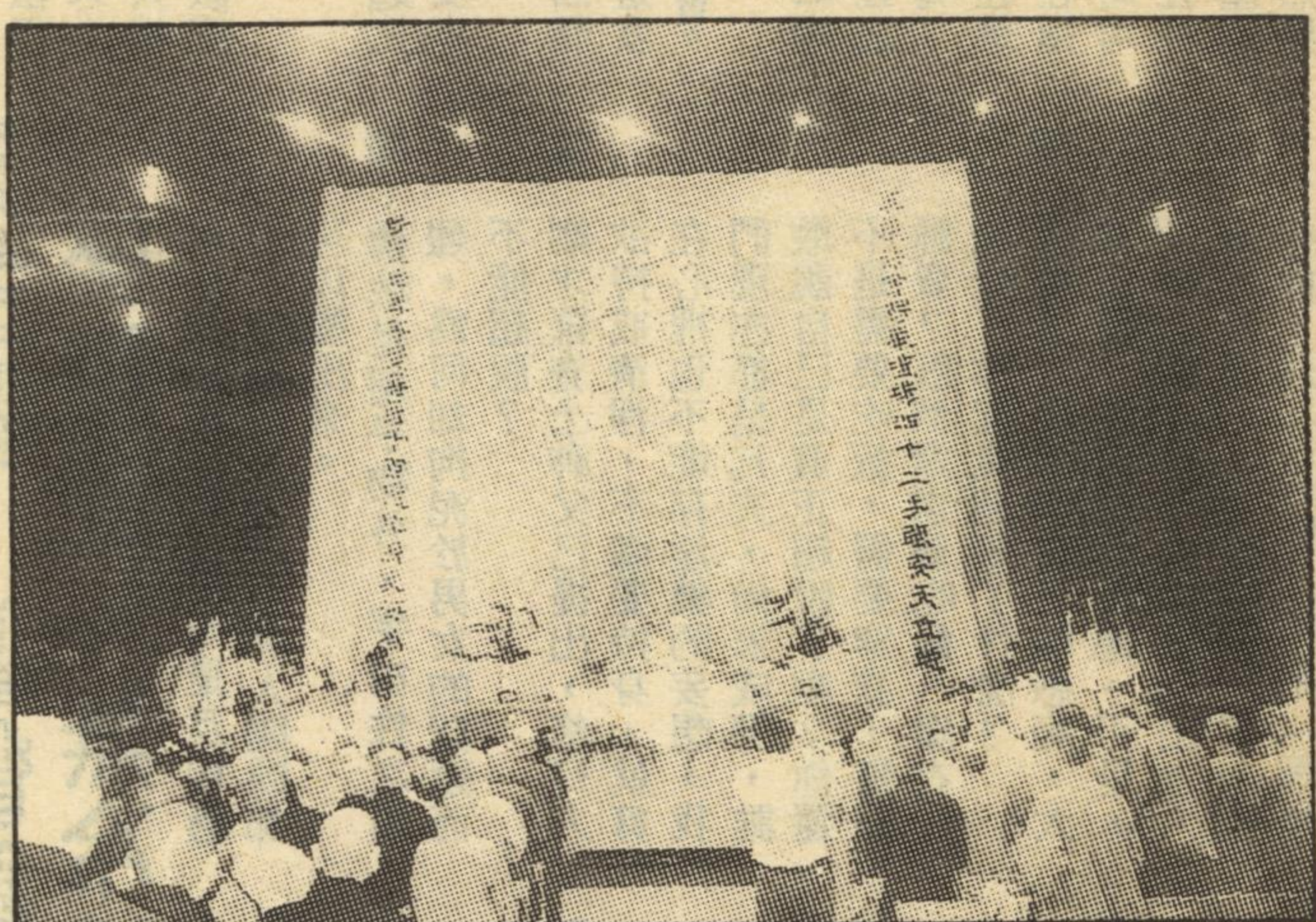
去年護國息災觀音大悲法會，在桃園體育館盛況。

色即是空，空即是色，這一關看不破，請上人開示？答：色即是色，死於色，如此而已，你看不破，你就會生在色裏，死在色裏。