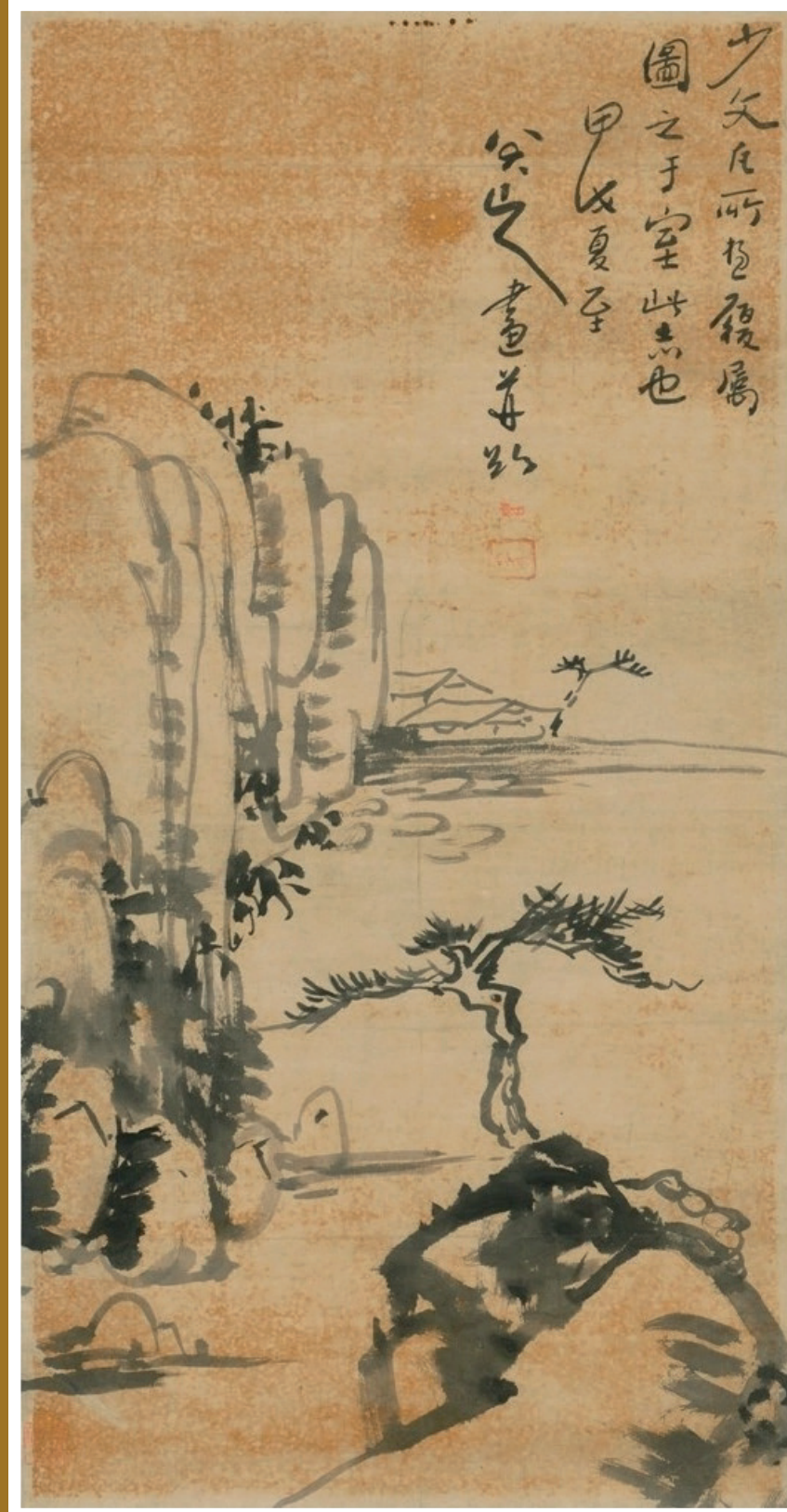
八大山人畫 (善導寺文藝陳列館藏) Painting by Ba Da Shan Ruen (collection of Shan Dao Temple Arts Exhibition Hall)