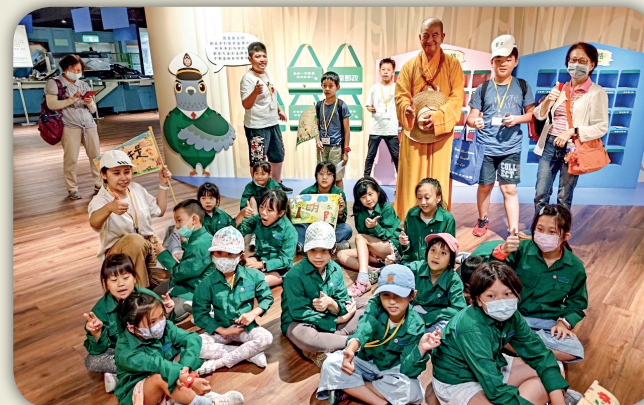
郵政博物館體驗郵差叔叔的辛勞與重要。 Visit Post Museum to experience the hardship and importance of mailperson.