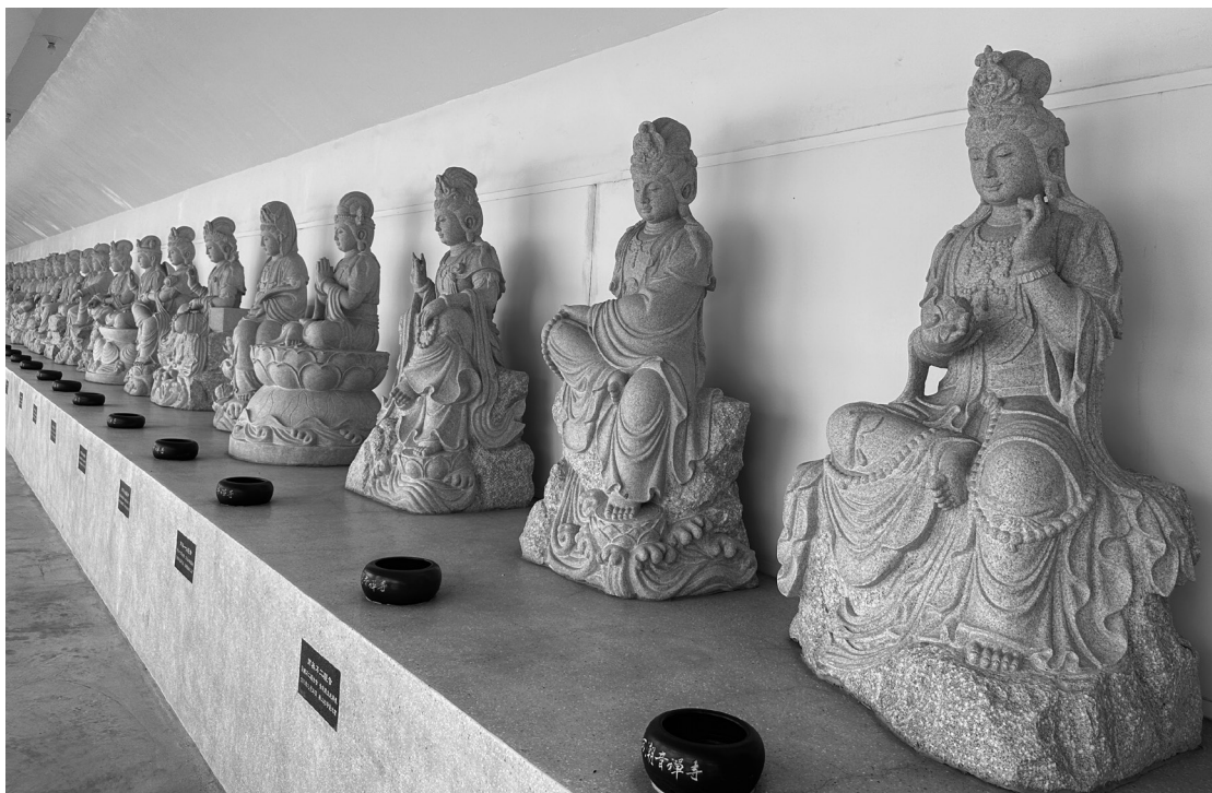
文化長廊有三十三觀音塑像。