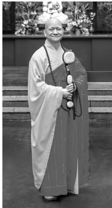
潮音禪寺成立之初，大雄寶殿所供奉迦葉尊者聖像，悟禪長老與之有幾分神似。

示，很感恩師父「人能盡其才，物盡其用」的行事風範，鼓勵弟子發揮才能。師父有很大的氣度，讓他在寺內設立教學的平台，持續教學相長的慧業。