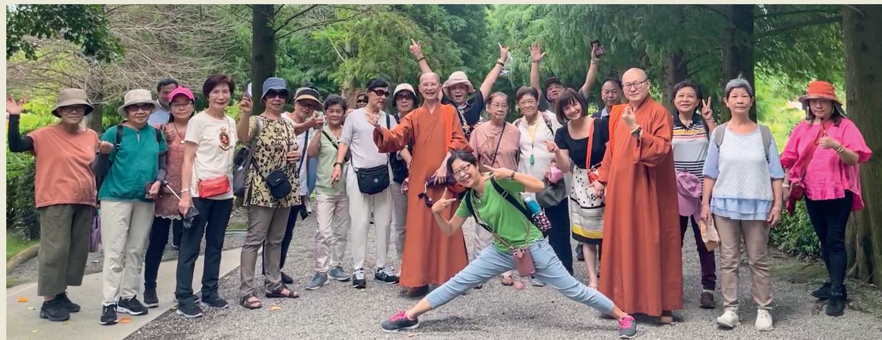
善導寺師父帶領志工們踏青，大家活力充沛，共度美好的自強活動。 Sangha of Shan Dao Temple leading volunteers to have an outing with energy and pleasure.