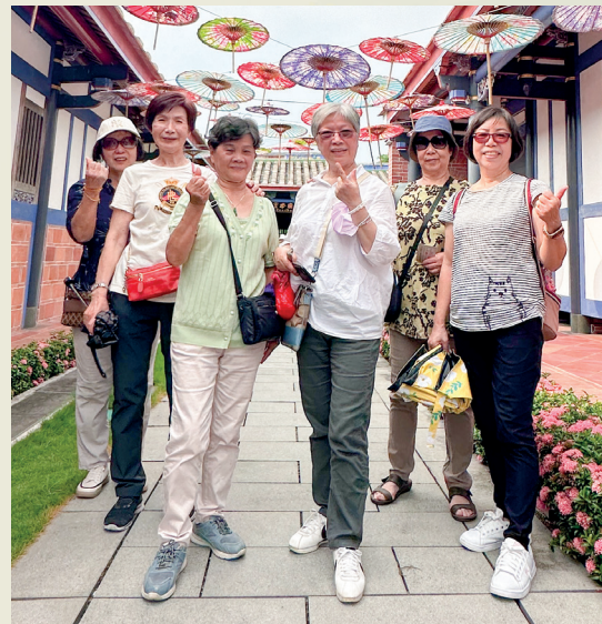
參觀成美文化園。 Visiting Chen Mei Cultural Park.