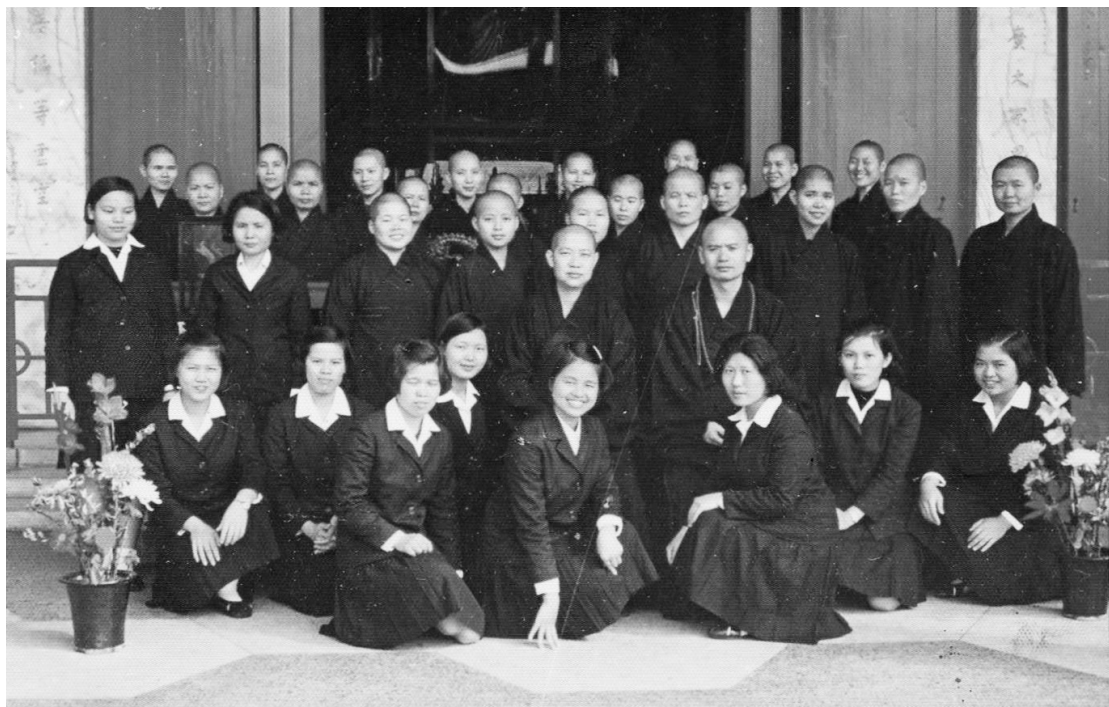
北投法藏佛學院師生合影於汐止慈航堂。

後，為了要讓同學們學以致用、解行並重，能深入懺法和華嚴義海，先後啟建法會，敦聘法師群帶領我們拜7天的大悲懺和21天的華嚴法會。又特別在教室舉行觀音佛七，院長親自主七，全程只有同學參與。