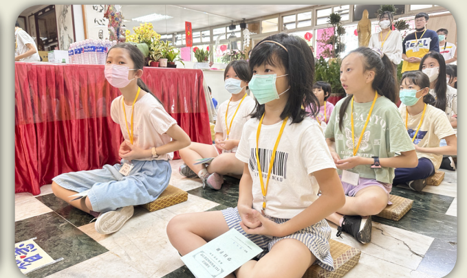
小朋友認真學習佛教教儀軌。 Children learning the Buddhist ritual earnestly.