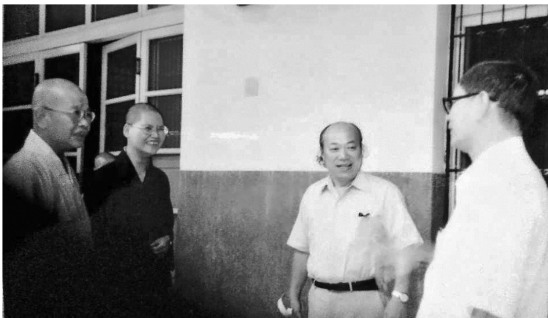
中國佛教史、華嚴學權威鎌田茂雄先生（右二）1983年夏來臺作田野調查時，與臺北法光寺如學住持（左一）、禪慧法師（左二）、楊白衣博士（右一）等留影。

該沒有人會否認人生的經歷與辦事的能力同樣重要。有的父母只要孩子把書念好，其餘可以不管。處在瞬息萬變的時代，不斷的吸收新知充實自己是必須的。光有高學歷而無各種歷練、磨練，如何承擔大責重任！因此學歷不是絕對的。常見不少「生活白癡」，舌燦蓮花，但除了會唸書、考試外，生活無法自理，更缺乏與人溝通及應變的能力。