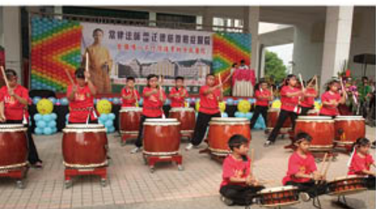
新營國小太鼓樂-鼓動童年。