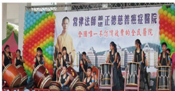
台南市鼓樂協會龍之鼓表演藝術團-有氧太鼓秀。