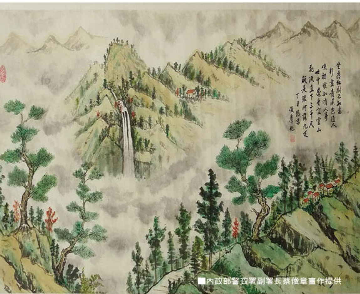
■內政部警政署副署長蔡俊章畫作提供