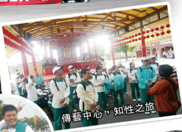
傳藝中心，知性之旅