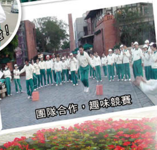
團隊合作，趣味競賽