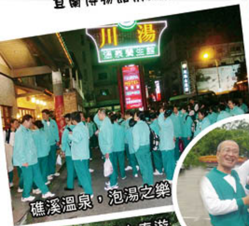
礁溪溫泉，泡湯之樂