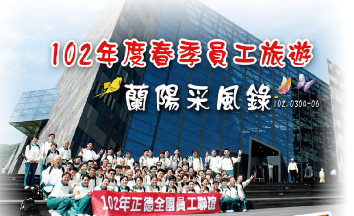
宜蘭博物館前..照過來...