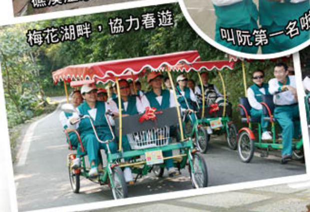
梅花湖畔，協力春遊