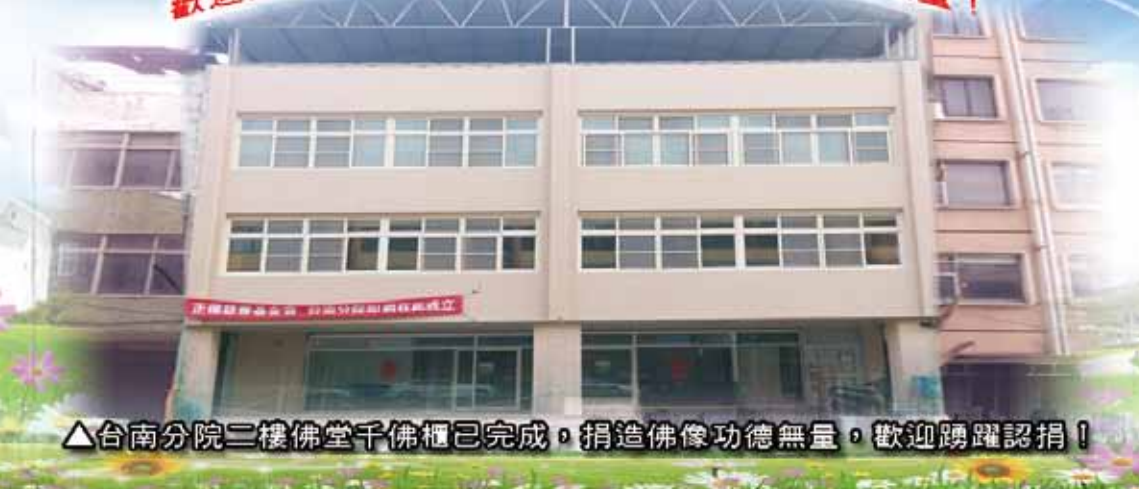
△台南分院二樓佛堂千佛櫃已完成，捐造佛像功德無量，歡迎踴躍認捐！

台南分院已完成外觀建設，內部各樓層設施陸續建置中， 正德弘法濟世腳步將利益更多台南鄉親， 歡迎大眾踴躍認捐，成就弘法道場，功德無量！