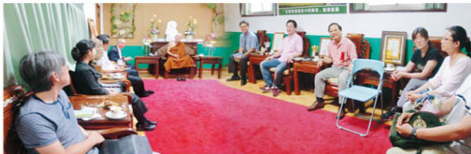
蒞臨正德愛心律師事務所開幕典禮之諸司法界賢達，會後特別拜見開山和尚。

正德愛心律師事務所的成立，緣於一席開山和尚的慈悲開示，和尚曾於多次談話中談及希望不要有人因為不懂法律，又因為無資力無法請到好的律師，造成訴訟上的不利。所以，在本人仍擔任檢察官時機，和尚就此構想與我溝通良久，本人為開山和尚的慈悲大願所感動，所以，願放下檢察官工作，投入公益行列，成立愛心律師事務所，義務為大家服務。但因個人同時擔任正德基金會總執行之職，時間有限，現階段訴訟及撰狀之服務對象，乃以正德志義工為主，一般會員及信眾，請提出書面或留言「正德律師事務所」臉書，本律師酌予回覆。