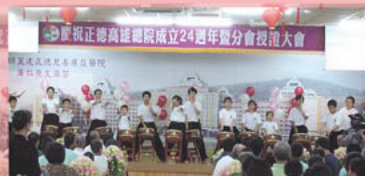
正德太鼓隊震撼開場演出