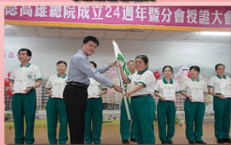
總執行長主持分會（三民、左楠、仁武）授旗、授證儀式