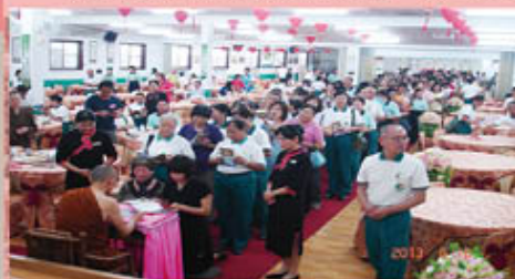
開山和尚著作《天然食物診斷書》出刊，舉辦義書會盛況。