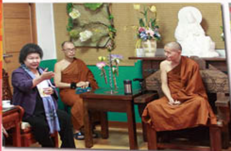
陳菊市長蒞臨拜會開山和尚，獻上祝福，並捐助建院基金。