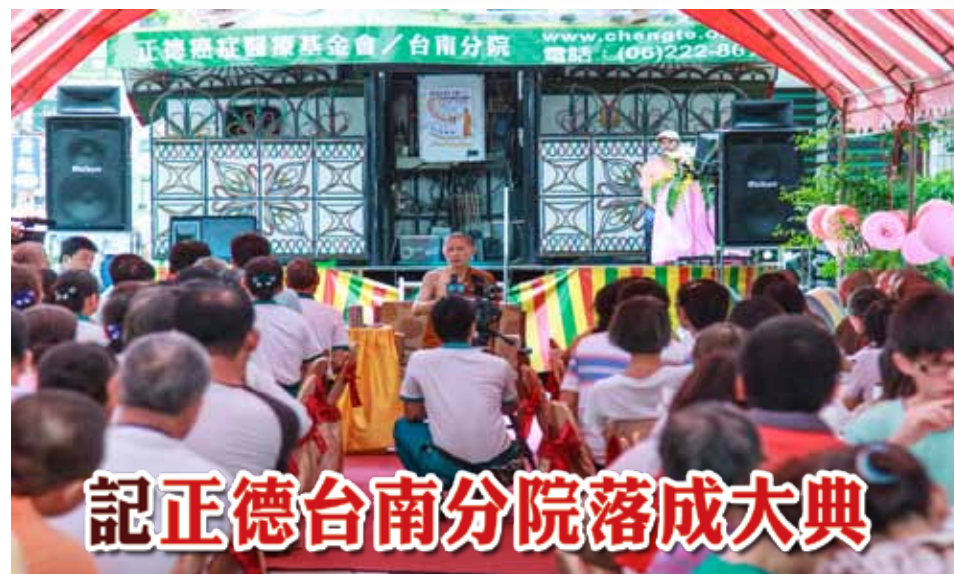
■台南分院/王凱智 撰述

歡迎各位居士大德們加入正德志義工、員工行列，一起為大眾服務。也歡迎各位醫學界的醫師、護士及相關作業人員加入正德，一起救癌症朋友們遠離病痛，因為拯救一位癌友就等於救了一個家庭。阿彌陀佛！少造業，多念佛！