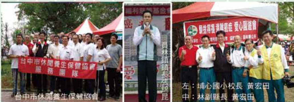
台中市休閒養生保健協會