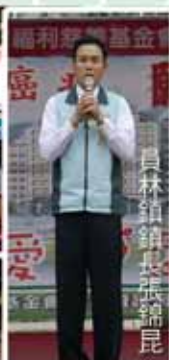
員林鎮鎮長張錦昆