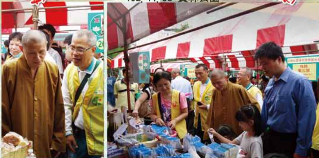
開山和尚偕總長一一至各攤位關懷活動狀況