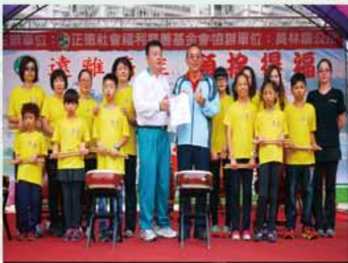
各界佳賓參與盛會