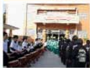
開山和尚慈悲開示，期勉全國志義工攜手同心，造福眾生。