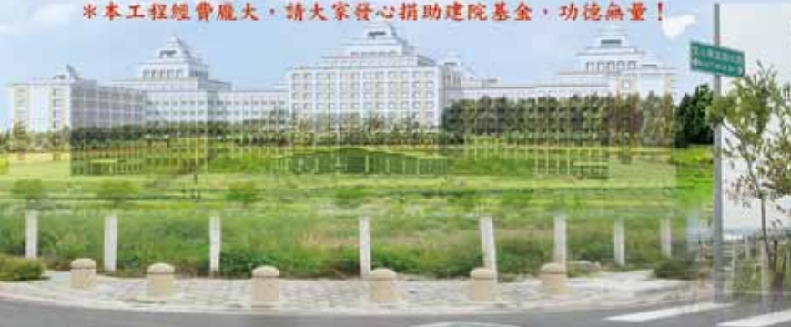
▲正德台中癌症醫院位於台中市南屯重劃區，三面環路，近臨高速公路，交通便捷，為理想醫院用地。