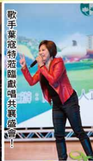
歌手葉寇特蒞臨獻唱共襄盛會！