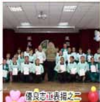
優良志工表揚之二