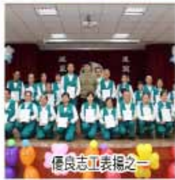
優良志工表揚之一