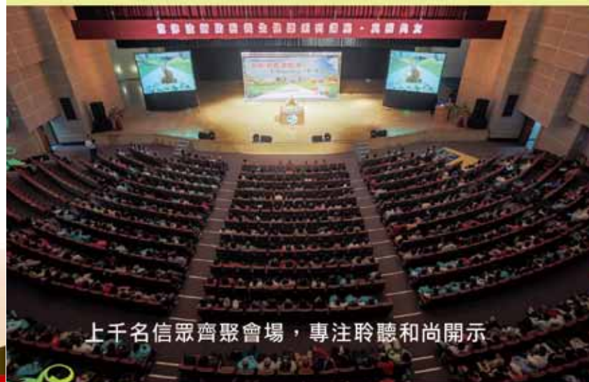
上千名信眾齊聚會場，專注聆聽和尚開示

新的一年，和尚願大家的道心、菩提心、慈悲心更堅固，福慧能雙修，更發心投入正德救人濟世的菩薩道工作或出家修行，早日蓋建〈正德慈善癌症醫院〉及正德癌症養生醫療園區，廣救眾生病苦，令今年人人家庭更安康，事事更如意，祝福大家。更祈願國家，今年國泰民安，風調雨順，人民安樂，降大吉祥。阿彌陀佛！少造業、多念佛！少吃肉、救世界！