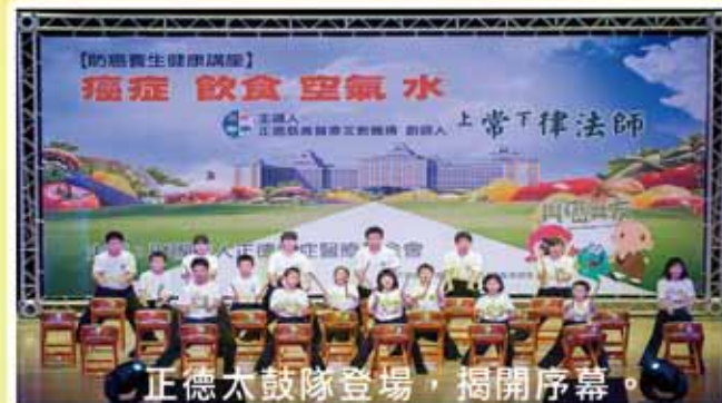
正德太鼓隊登場，揭開序幕。