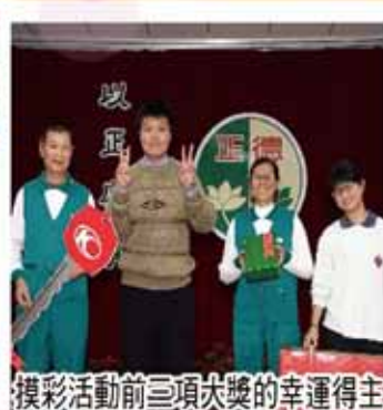
摸彩活動前三項大獎的幸運得主