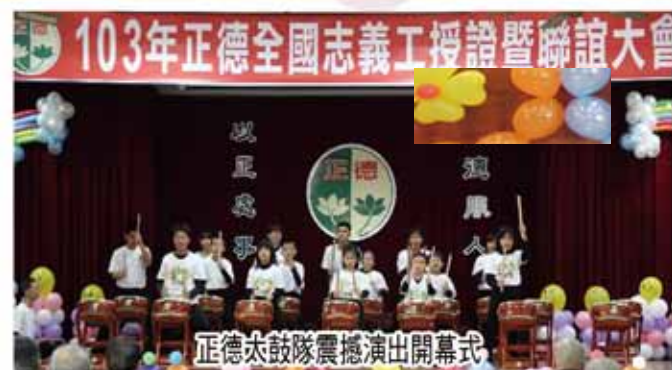
正德太鼓隊震撼演出開幕式