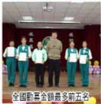
全國勸募金額最多前五名