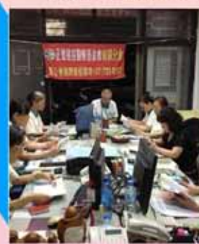
▲前鎮分會--每月讀書會。