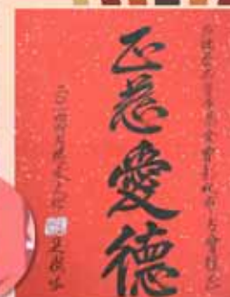
▲彰化分會關懷天主教慈愛教養院，院童用腳寫下「正慈愛德」，溫馨感人！