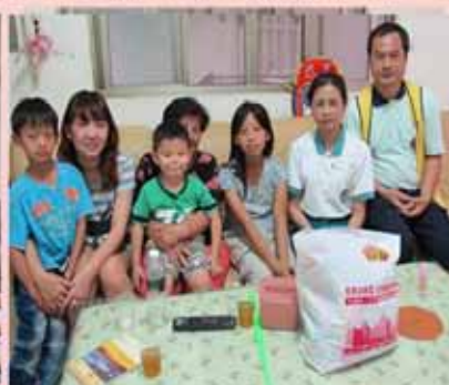
▲大寮分會--社區關懷，物資發送。