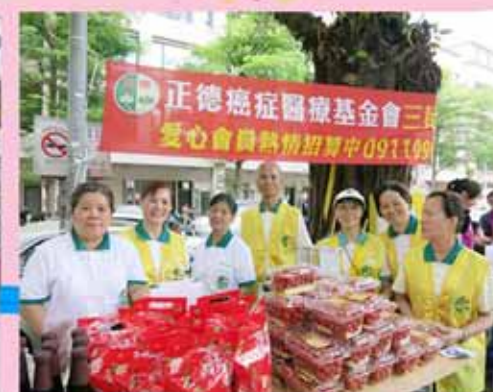
▲三民分會--參與社區園遊會義賣活動。