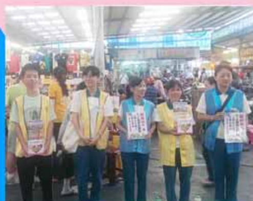
▲楠梓分會--發放善書，推廣正德理念。