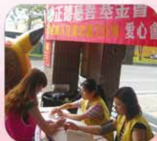
▲ 宜蘭分會 · 義診活動