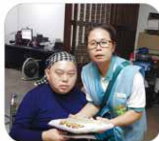
▲ 台南分會 · 社會救助