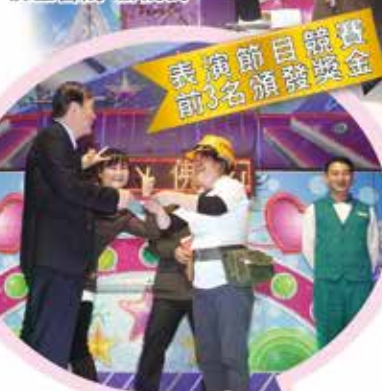
表演節目競賽 前3名頒發獎金