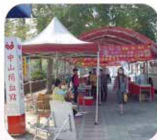
▲ 台南分會 · 捐血活動