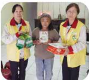
▲ 台南分會 · 社會救助