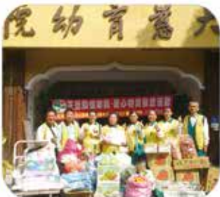
▲ 高雄鳳山分會 · 愛心物資發送

正德慈善基金會 · 正德癌症醫療基金會 正德文教傳播基金會附設正德公益電視台 本基金會榮獲內政部評定為全國性優等基金會 正德網站： www.chengte.org.tw e-mail: cthci01@gmail.com