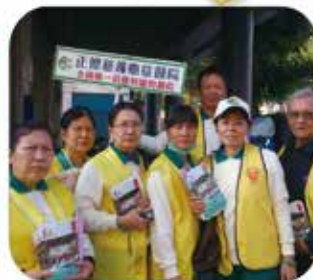
▲ 高雄鳳山分會 · 善書發送