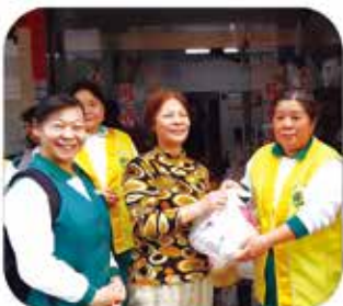
▲ 高雄三民分會 · 社會救助