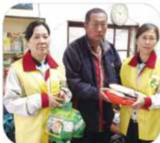
▲ 台南分會 · 社會救助