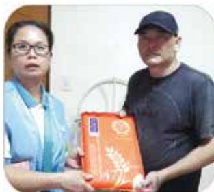
▲ 台南分會 · 社會救助