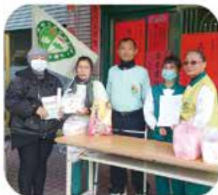
▲ 高雄鳳山分會 · 愛心便當發送