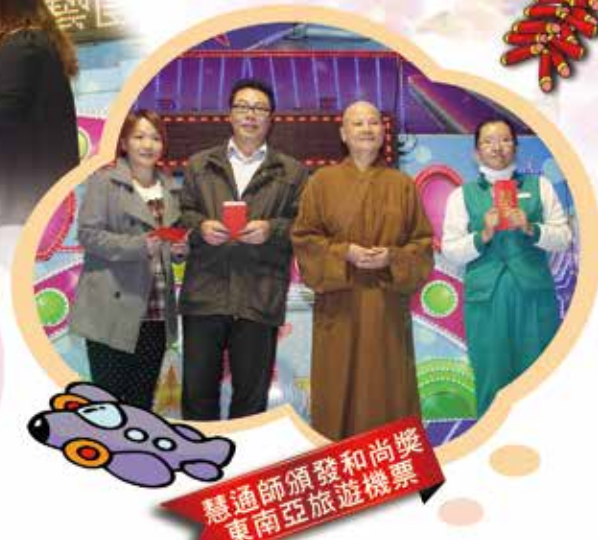
慧通師頒發和尚獎 東南亞旅遊機票