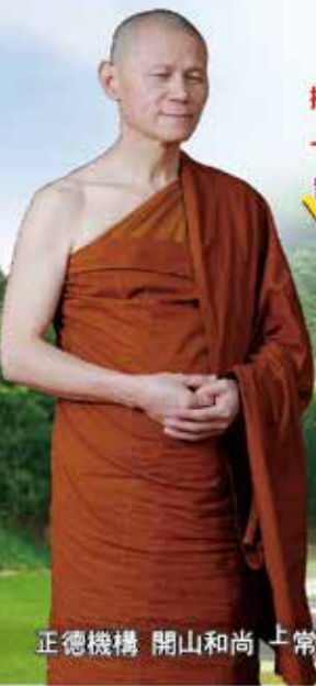
正德機構 開山和尚 上常下律師

安寧病房除照護癌症末期患者， 依中央健保局增列可照護八大 非癌末期安寧療護疾病。