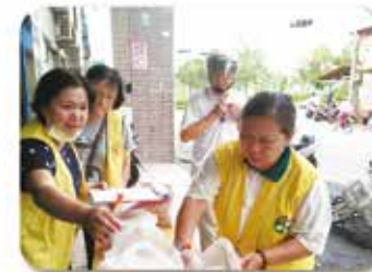
▲萬山分會-愛心便當發送(104, 8, 9)