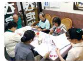
▲大社分會-讀書會(104, 8, 11)