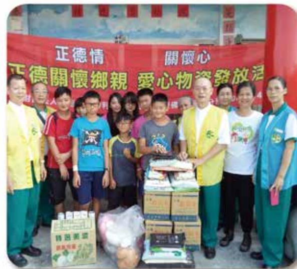
▲屏東分會-關懷精忠育幼院，物資發送(104, 7, 31)