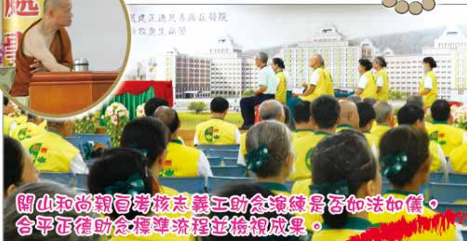
開山和尚親自考核志義工助念演練是否如法如儀，合平正德助念標準流程並檢視成果。