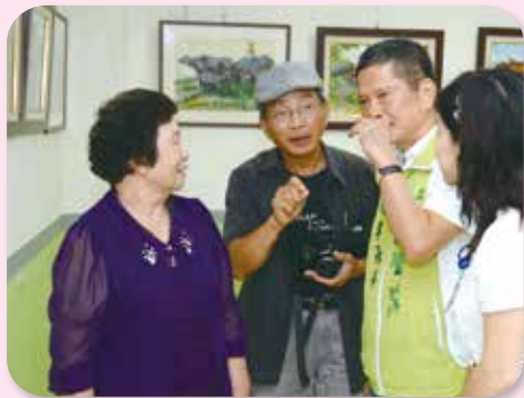
▲前副市長李永得來幫秋妹加油打氣