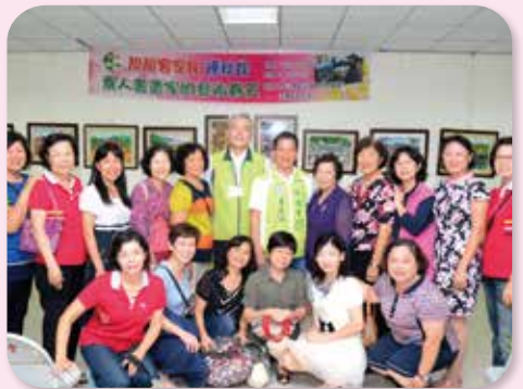
▲旗山正德醫院-靚靚客家妹畫展開幕全體大合照