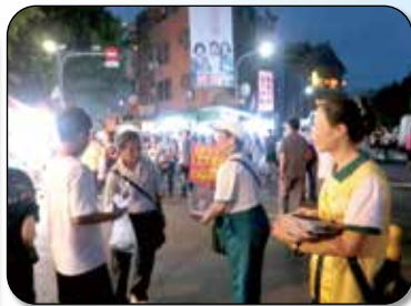
▲高雄蓮池潭發善書募款