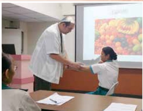
▲醫護志工教育訓練課程-物理治療的重要性。