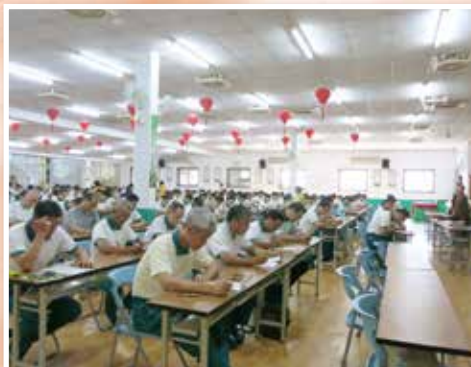
▲正德志義工，每月精進佛學考試。