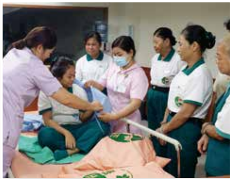
▲醫護志工教育訓練課程-個案臥床翻身擺位法(1)