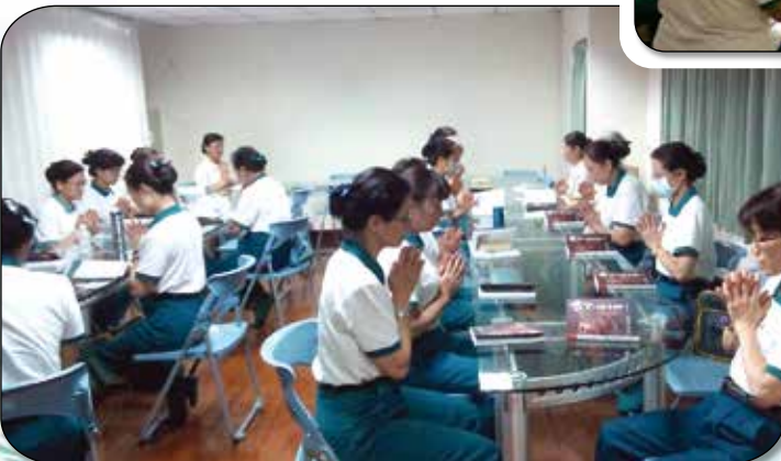
▲大寮、左營、三民2組·讀書會