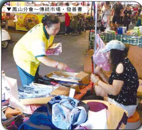
▼鳳山分會～傳統市場·發善書