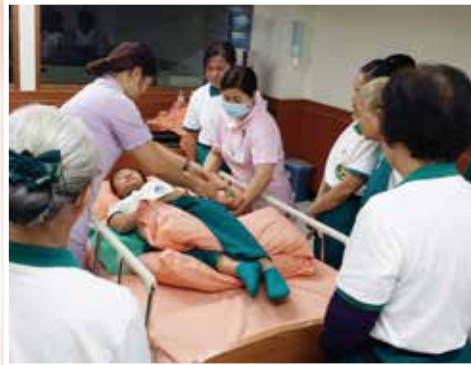
▲醫護志工教育訓練課程-個案臥床翻身擺位法(2)