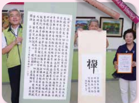
▲正德旗山醫院吳執行長(左)接受秋妹女士贈送書法作品