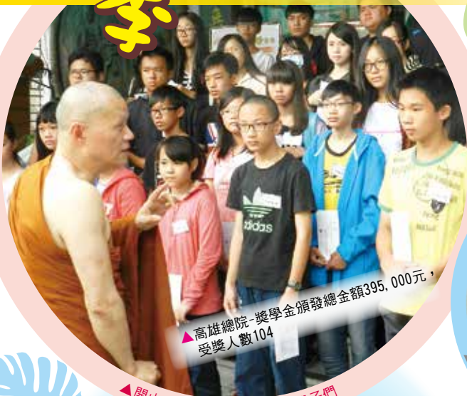
▲高雄總院-獎學金頒發總金額395,000元， 受獎人數104