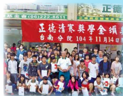
▲台南分院-獎學金頒發總金額355,000元， 受獎人數98

正德獎學金發放作業行之多年，每年分春、秋二季於正德全國各院社同步舉行， 嘉惠無數莘莘學子，幫助他們減輕經濟負擔，得以安心完成學業！