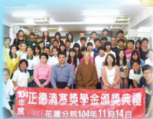
▲花蓮分院-獎學金頒發總金額210,000元， 受獎人數59