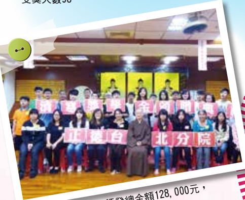
▲台北分院-獎學金頒發總金額128,000元， 受獎人數32