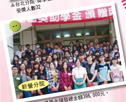
▲新營分院-獎學金頒發總金額396,000元， 受獎人數109