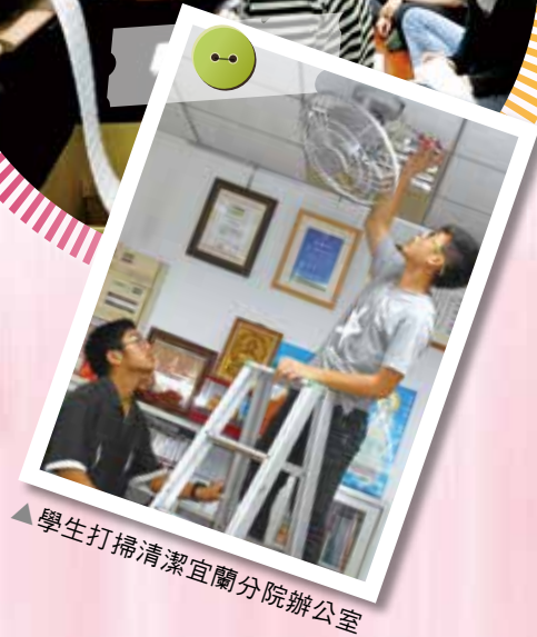
▲學生打掃清潔宜蘭分院辦公室