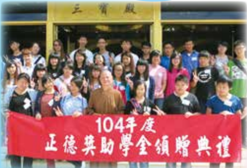
▲埔里分院-獎學金頒發總金額126,000元，受獎人數34