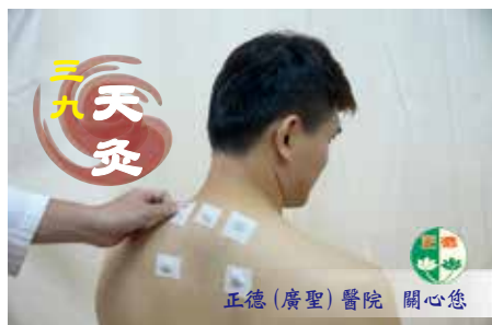
正德(廣聖)醫院 關心您