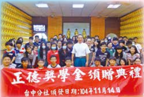
▲台中分社-獎學金頒發總金額245,000元，受獎人數92