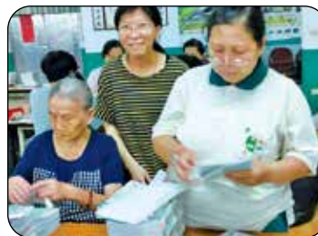
▲每月慈音雜誌包裝