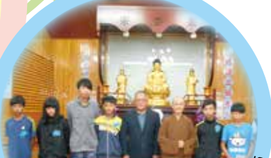
宜蘭分院 獎學金頒發總金額282,000元，受獎人數95

104年正德秋季獎學金頒發 總金額：2,553,000元 受獎人數：大專209、高中231 國中292