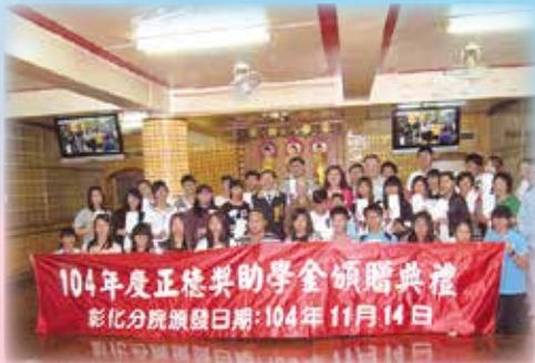
▲彰化分院-獎學金頒發總金額147,000元，受獎人數48