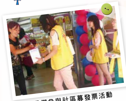
▲學子們參與社區募發票活動