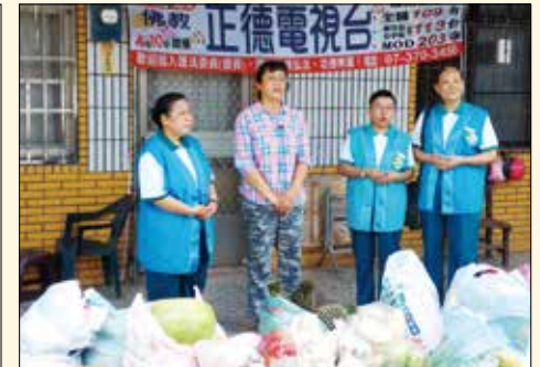
▲105年6/4-鳳山分會訪問仁武育幼院發放物資。