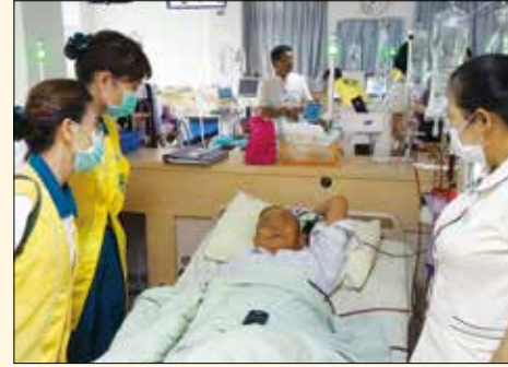
▲鳳山分會、勸募志工們廣聖護家關懷住民。