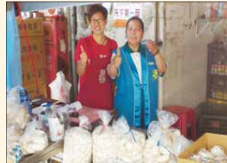
▲高雄市鳳農市場募愛心菜，菜販們發心捐助。