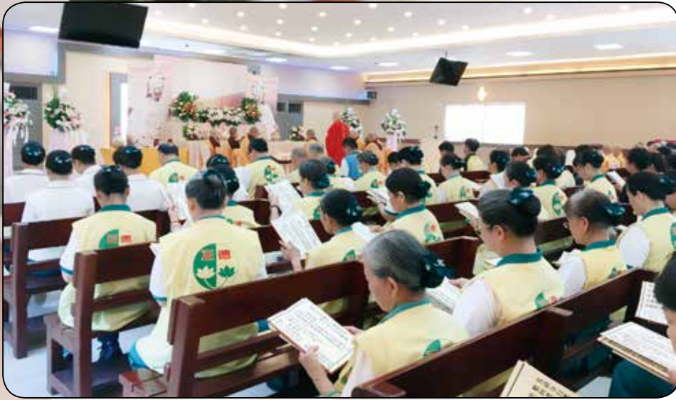
▲高雄市政府聯合公祭會場高雄市立殯儀館-蓮社志工們全神貫注的誦經迴向眾生。