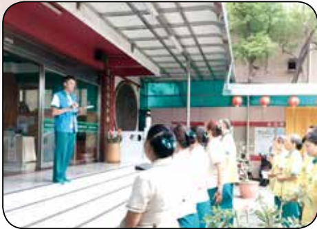
▲出發前的注意事項佈達。