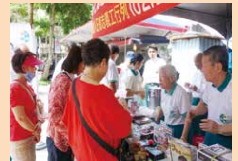
▲台北景美分會成立暨愛心義賣活動。