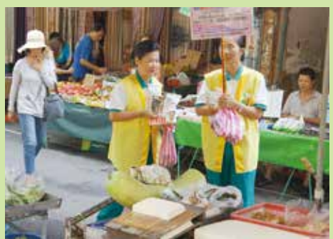
▲志工們為籌募正德醫院建院基金，勸募大眾種福田。