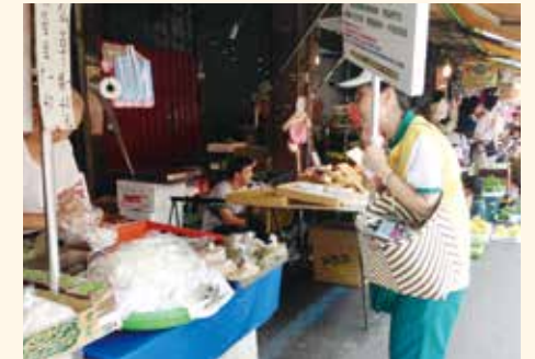
▲台北內湖分會行動愛心勸募。