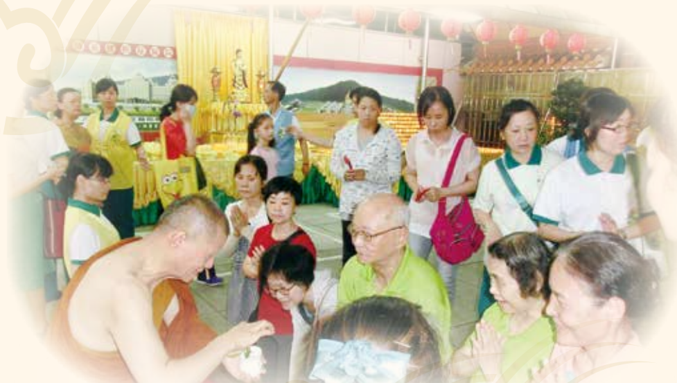
▲ 高雄梁皇寶懺法會圓滿，開山和尚為信眾灑淨。