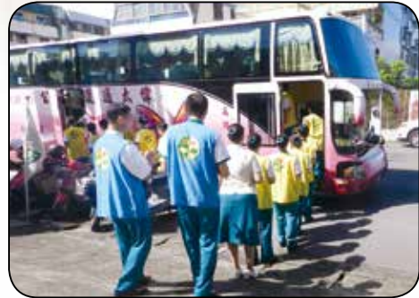
▲搭車前往並於車內部持「阿彌陀佛」聖號至會場。