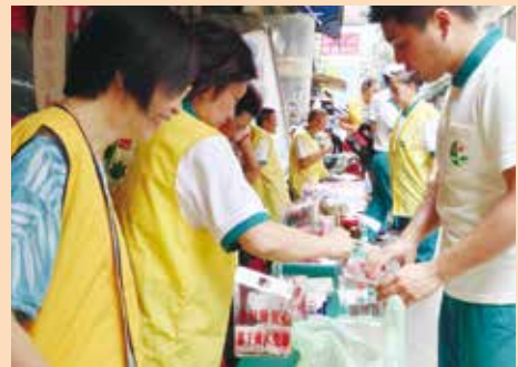
▲台北士成分會成立暨愛心義賣活動。