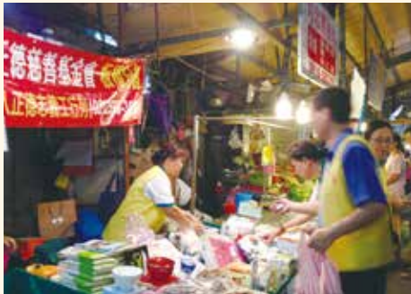
▲台北板橋分會舉辦義賣暨勸募活動，演音師特蒞臨現場關懷，為大家加油打氣。