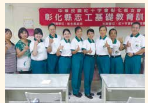
▲參加紅十字會主辦志工基礎教育訓練課程。