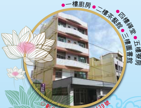
彰化縣員林市林森路139號