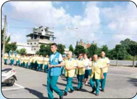
▲正德西方蓮社是紀律嚴謹，如儀如法的專業助念團隊。