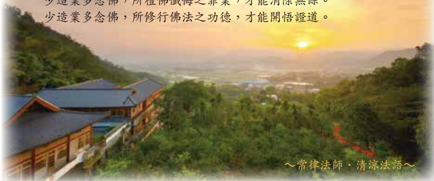
～常律法師·清涼法語～

少造業多念佛，所布施行善之福德，才能圓滿無漏。 少造業多念佛，所念佛誦經之功德，才能圓滿無礙。 少造業多念佛，所禮佛懺悔之罪業，才能消除無餘。 少造業多念佛，所修行佛法之功德，才能開悟證道。