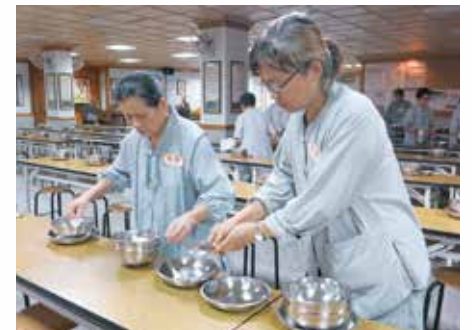
· 八關齋戒-戒子出坡

所謂佛法齋者--正信的佛弟子，於每月六齋日來乞受八戒，遵崇佛制，謹受戒法，於一日一夜奉行八戒。心如修道人，心無有殺意，慈念眾生，不敢殺害蠕動之類，不加刀杖鞭撻畜生。心無盜取慳貪之意，廣行布施。心無邪淫意，不念房室，修清淨梵行，不貪色，心無欺詐之意，不打妄語，心口相應，言語正直，不飲酒亂性，遠離放逸，不著華香，不敷脂粉，