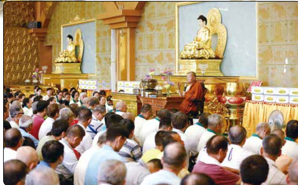
近千人朝山信眾聚集大佛山三寶殿，聆聽 開山和尚慈悲開示，法喜充滿。行走一趟埔里大佛山，身心靈皆獲洗禮。