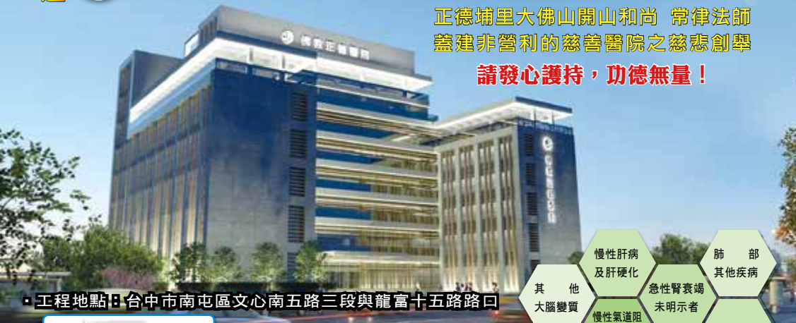
· 工程地點：台中市南屯區文心南五路三段與龍富十五路路口

正德埔里大佛山開山和尚 常律師師 蓋建非營利的慈善醫院之慈悲創舉 請發心護持，功德無量！