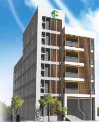
▲正德慈善文教大樓外觀藍圖 · 工程地點：高雄市鳥松區本館路159號

正德佛堂為擴展本會南部弘法利生濟世工作，特起造本大樓，以利推廣各項慈善、文教、制喪志業，願大眾發心贊助建院基金，功德無量！