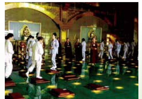
· 八關齋戒-戒子日夜精進念佛，念念相續。