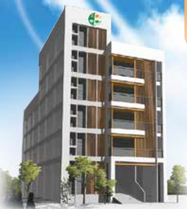
▲正德慈善文教大樓外觀藍圖