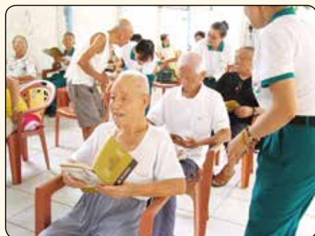
▲正德志工們為荔宅里的住民們解說超拔流程。