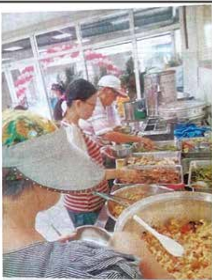
正德愛心廚房昨天中午正式開伙，準備炒飯炒麵和蘿蔔糕3種主食，外加5菜1湯1甜湯，以自助方式供用餐民眾取用。