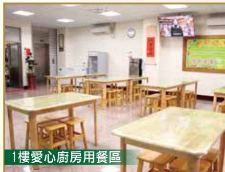
1樓愛心廚房用餐區