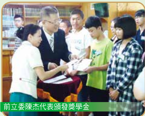
前立委陳杰代表頒發獎學金