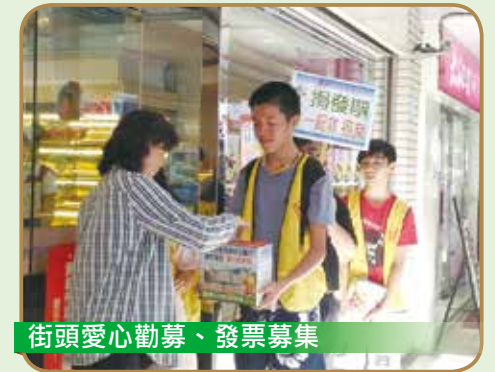
街頭愛心勸募、發票募集