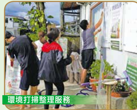
環境打掃整理服務