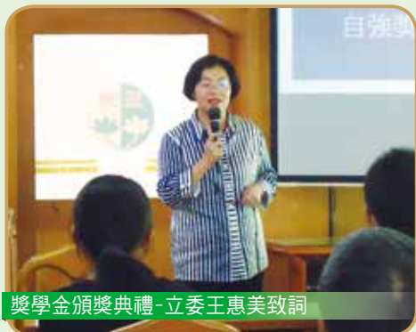
獎學金頒獎典禮-立委王惠美致詞