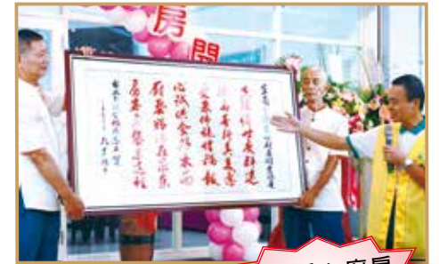
當日愛心廚房 民眾用餐熱絡