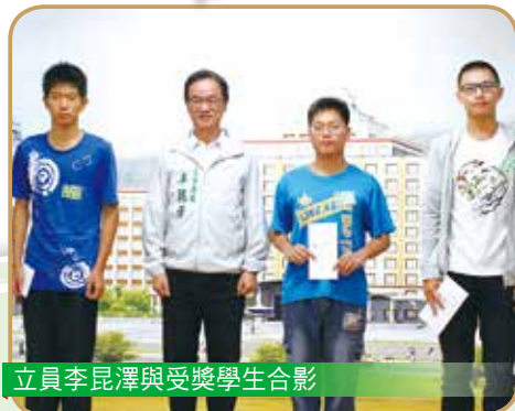
立員李昆澤與受獎學生合影

105年正德秋季獎助學金於全國十個分院同步舉行，各界熱烈參與，共同關心這群國家未來的主人翁，希望幫助他們逐步實現夢想。