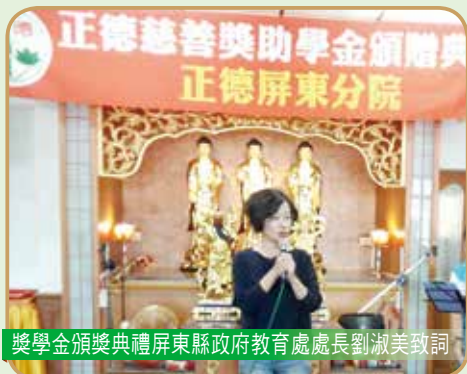
獎學金頒獎典禮屏東縣政府教育處處長劉淑美致詞