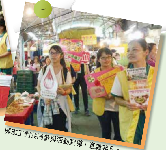
與志工們共同參與活動宣導，意義非凡。