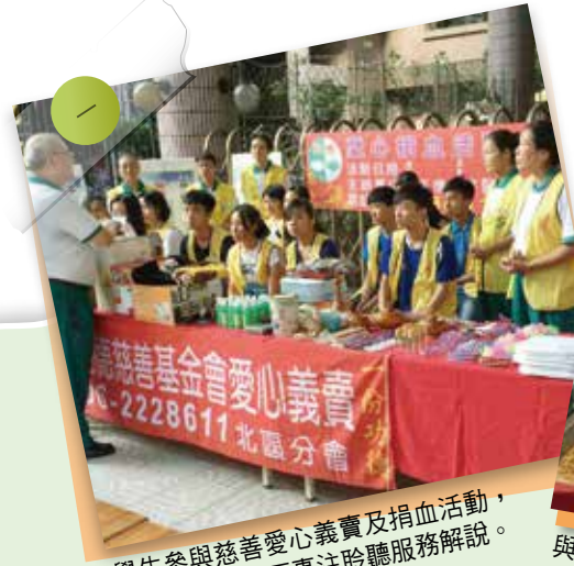
學生參與慈善愛心義賣及捐血活動，難得體驗，莫不專注聆聽服務解說。