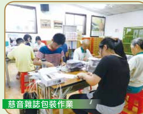
慈音雜誌包裝作業