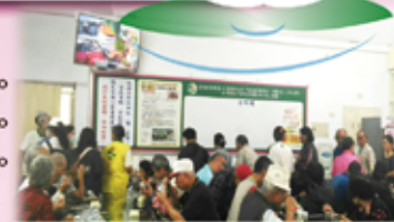
常律和尚的感恩大愛—於全國各地廣設愛心廚房。