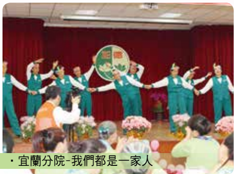
· 宜蘭分院-我們都是一家人