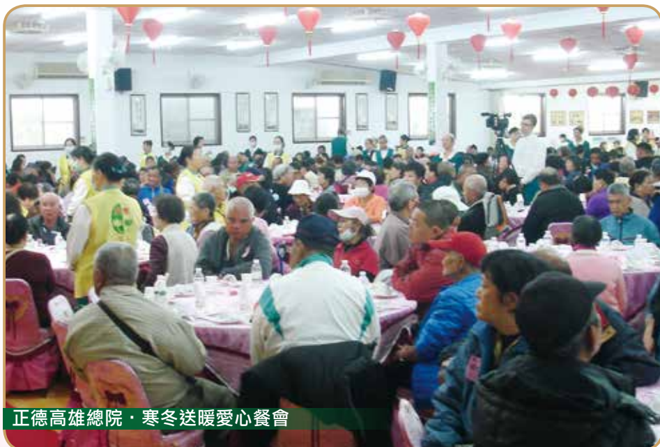
正德高雄總院·寒冬送暖愛心餐會