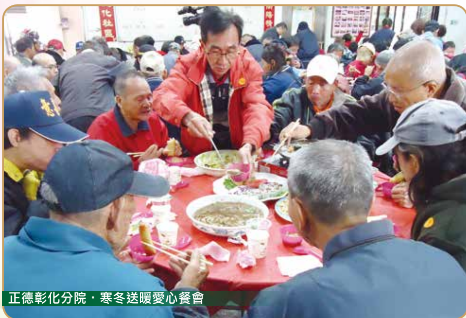
正德彰化分院·寒冬送暖愛心餐會