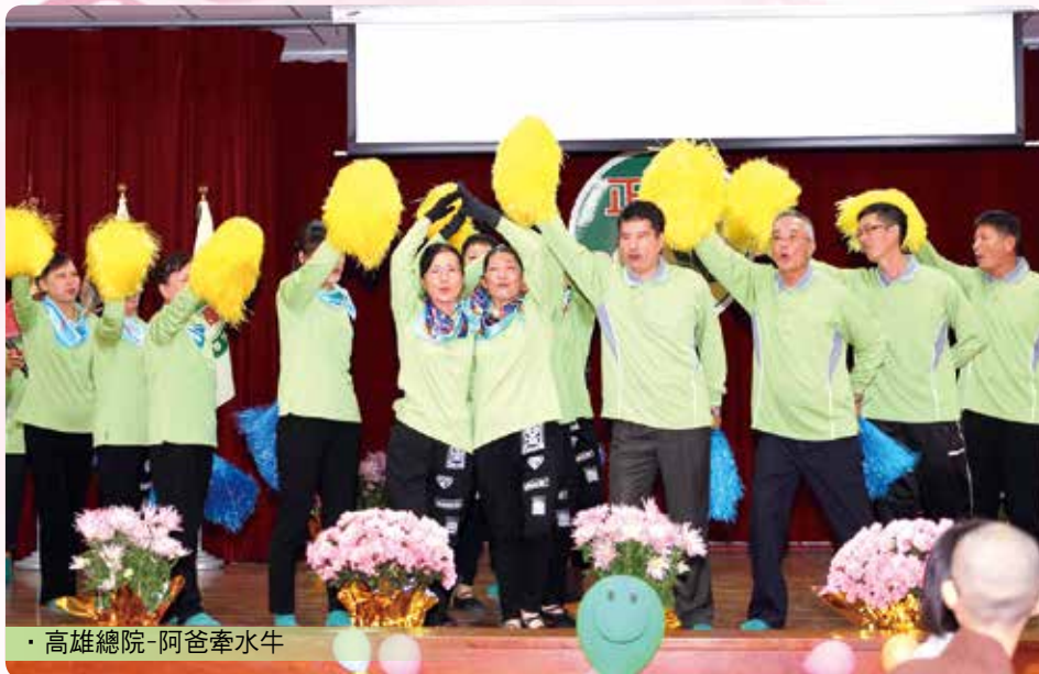
· 高雄總院-阿爸牽水牛