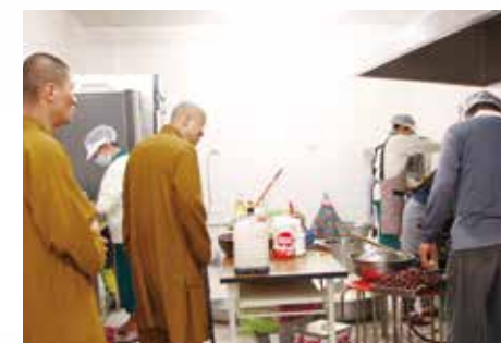
· 開山和尚 關心新廚房備餐的情況