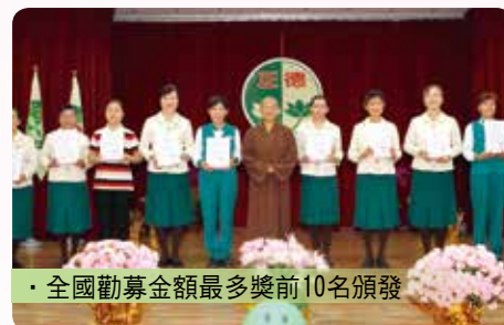
· 全國勸募金額最多獎前10名頒發