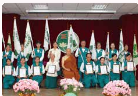
· 全國新成立分會由 開山和尚親自授證