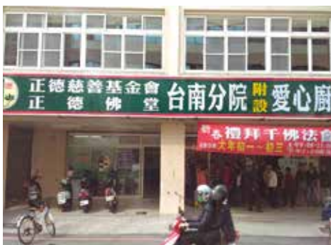
· 正德台南分院附設愛心廚房