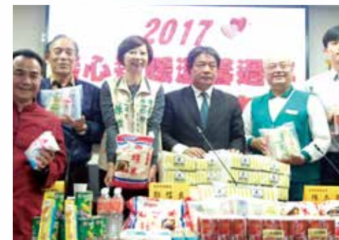
· 台南市傳達三項活動的記者會

在此，要對正德致上十二萬分的敬意，特別是我們這邊的愛心媽媽、義工朋友及所有的工作人員，你們真的辛苦了！未來的路還很漫長，你們的工作今天只是一個開始，未來社會還有很多需要你們幫助的地方，在此，想表達一句話，社會有你們最好；世界有你們最美，社會才會非常的祥和，讓我們一起來努力付出。