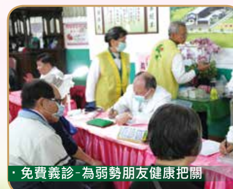
· 免費義診-為弱勢朋友健康把關