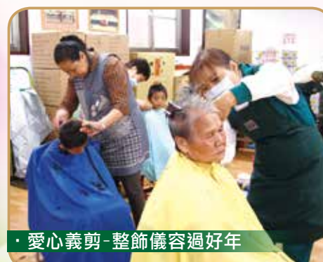
· 愛心義剪-整飾儀容過好年