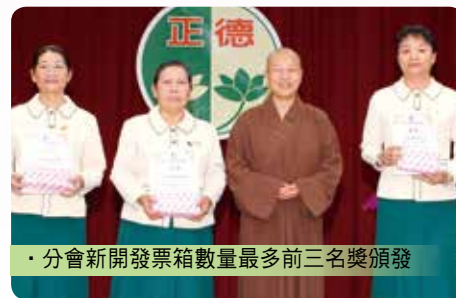
· 分會新開發票箱數量最多前三名獎頒發