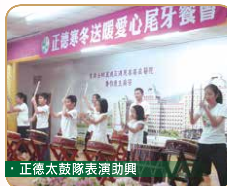
· 正德太鼓隊表演助興