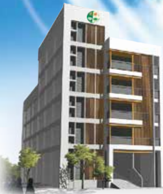
▲正德慈善文教大樓外觀藍圖 • 工程地點：高雄市鳥松區本館路159號