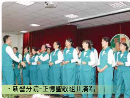
· 新營分院-正德聖歌組曲演唱