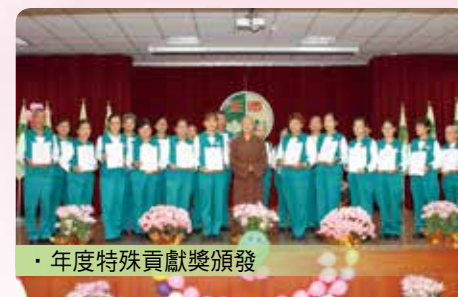
· 年度特殊貢獻獎頒發