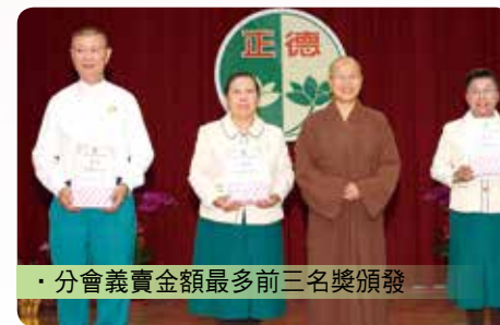
· 分會義賣金額最多前三名獎頒發