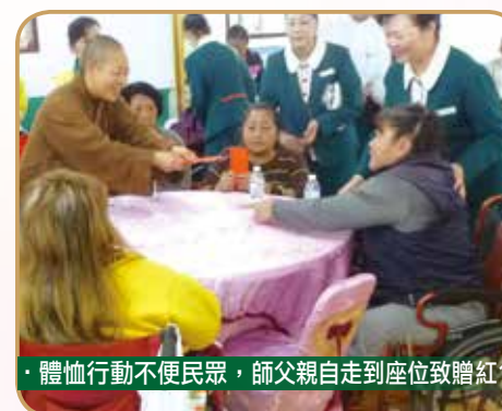
· 體恤行動不便民眾，師父親自走到座位致贈紅包