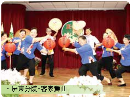
· 屏東分院-客家舞曲