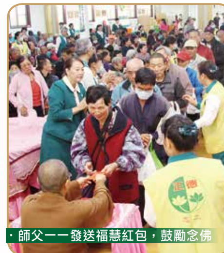
· 師父一一發送福慧紅包，鼓勵念佛