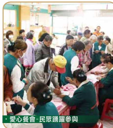
· 愛心餐會-民眾踴躍參與