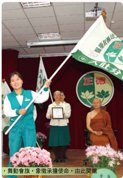
· 舞動會旗，象徵承擔使命，由此開端