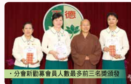
· 分會新勸募會員人數最多前三名獎頒發