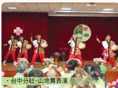
· 台中分社-山地舞表演