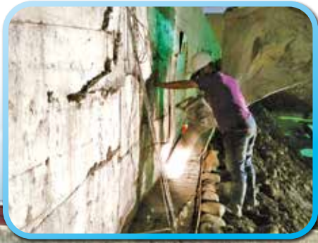
▲ 擋土柱上方壓樑施工-灌漿