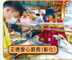
正德愛心廚房(彰化)