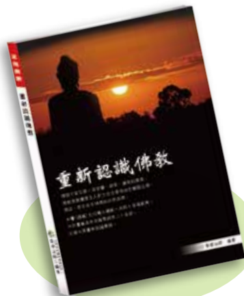
◎ 助印工本費，每本100元

佛教不是宗教，是智慧、慈悲、覺悟的教育，佛教是教導眾生入世生存之學及出世解脫之學，佛法，是宇宙天地間的自然真理。本書(講題)共引據大藏經一百四十多部經典、中外書籍及各宗教學說共三十多部，引領大眾重新認識佛教。