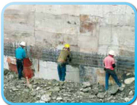
▲ 擋土柱上方壓樑施工-鋼筋綁紮