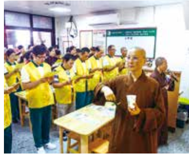
▲花蓮愛心廚房開幕參與志工們誦經祈福。

因此，和尚在深入2278部經藏之後，發現眾生之苦，並非僅靠佛法就能解現實當下的煩惱跟痛苦，所以他更用心研究眾生貧困這個區塊。發現病苦為貧窮之根，因此為解決眾生病苦煩惱，於全國各院成立八家免費看病的中醫診所。後來發現國人罹癌機率高，中醫醫療緩不濟急，遂又發願要設立中西癌症醫院，希望藉由西醫的檢測，快速找到病源，趕快醫治，減少病苦折磨。但後來又發現等生病再進行醫療已經太慢了，不只讓患者受苦太多，也浪費許多醫療資源。