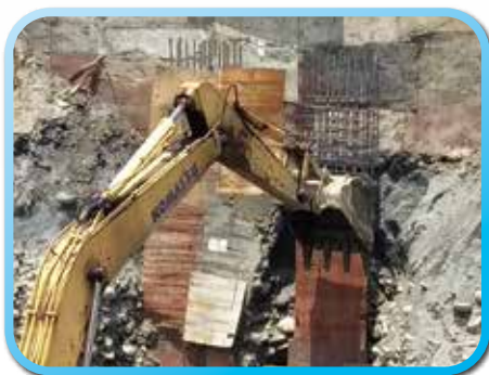
▲ 機挖擋土柱施工共85支