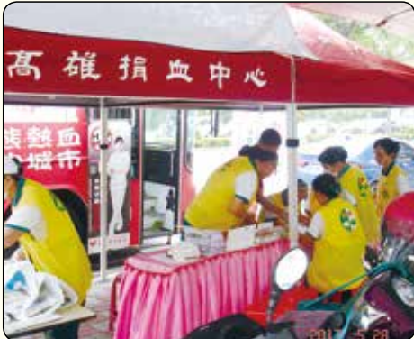
▲高雄鳳山分會·高雄澄清路家樂福捐血活動