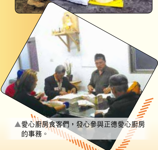
▲愛心廚房食客們，發心參與正德愛心廚房的事務。