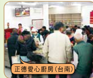
正德愛心廚房(台南)