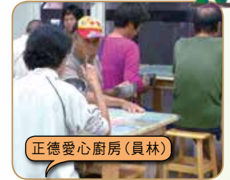
正德愛心廚房(員林)