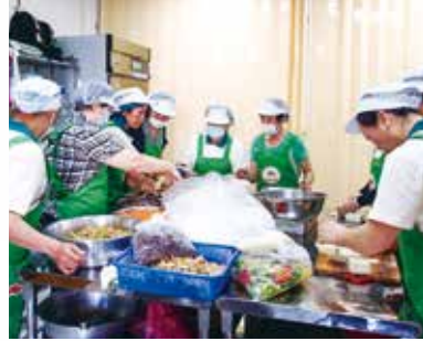
▲花蓮愛心廚房志工們忙碌備餐。