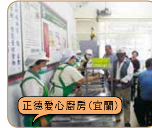
正德愛心廚房(宜蘭)