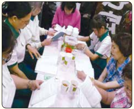
▲高雄·大社分會讀書會