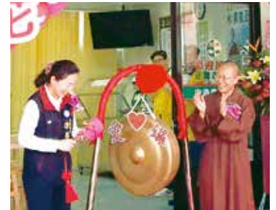
▲徐榛蔚立委蒞臨花蓮愛心廚房祝賀。