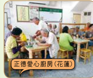
正德愛心廚房(花蓮)