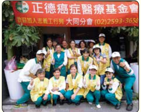
▲台北大同分會·社區勸募

學子從文書整理、慈音雜誌包裝發行、愛心廚房打菜服務、勸募發票等各項志工服務中，了解正德各項志業。