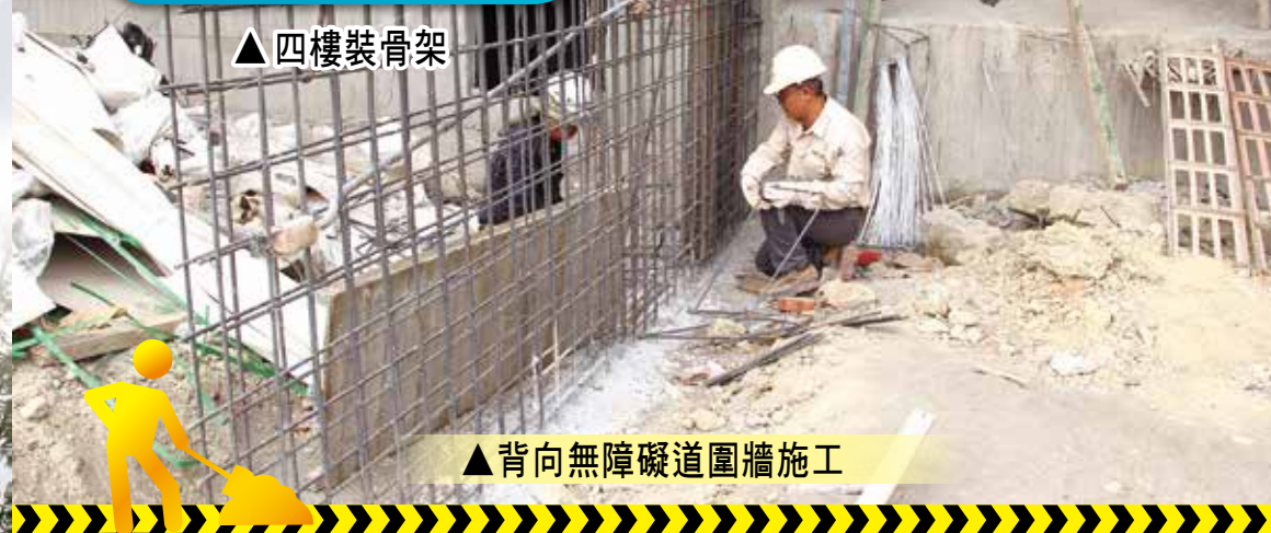
▲背向無障礙道圍牆施工