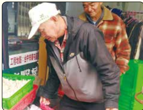
▲愛心廚房食客們，發心參與正德愛心廚房的挑菜、切菜、環境清潔等備餐工作。