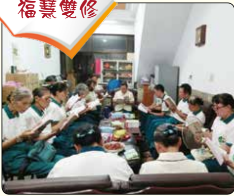
▲高雄·鳳山分會讀書會