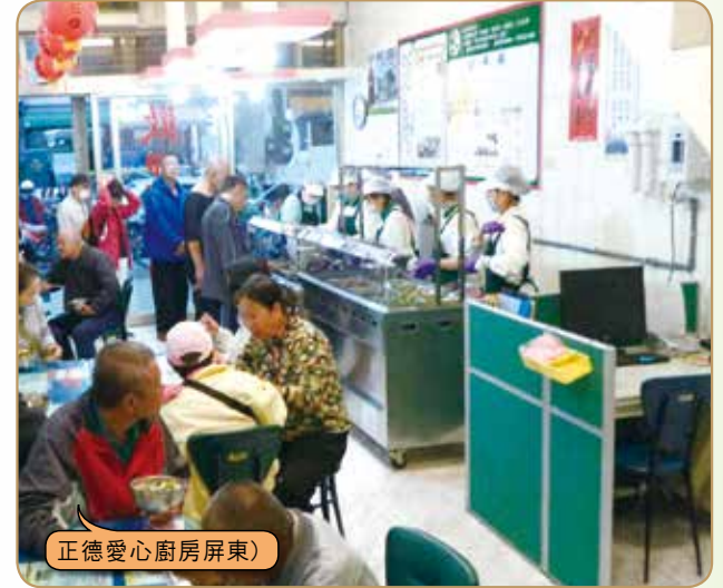
正德愛心廚房屏東