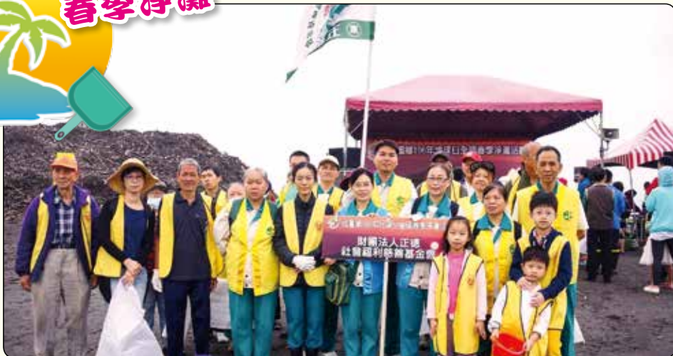
▲▼宜蘭分院志工與愛心廚房食客們參與壯園鄉106年度地球日全國春季淨灘活動。