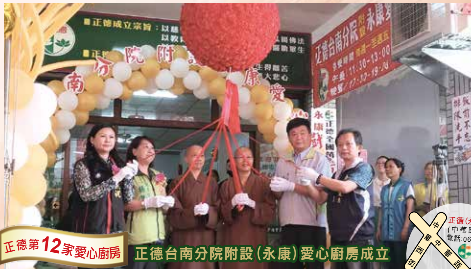
正德第12家愛心廚房

揭幕貴賓自左2起：興南里里長葉青旺、興南里管委會主委林進財、桃園市社會局 副局長-劉思遠、中壢區區長-林香美、慧通師、桃園市議員劉曾玉香、立法委員- 吳志揚、林森里里長-劉德全。