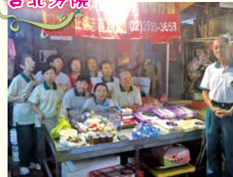
▲板橋分會·社區市場義賣。