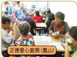
正德愛心廚房(鳳山)