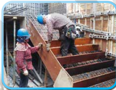
▲ B2F樓梯模板組立 ▼ B2F樑底模板施作