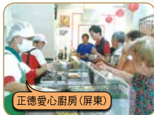
正德愛心廚房(屏東)