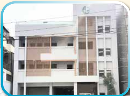
▲文教大樓正面外觀