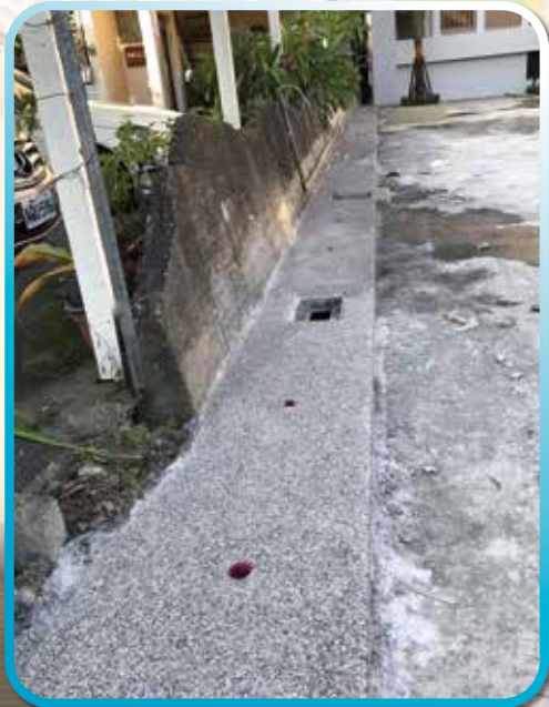
▲後面左邊水溝道完成