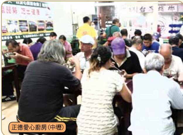
正德愛心廚房(中壢)