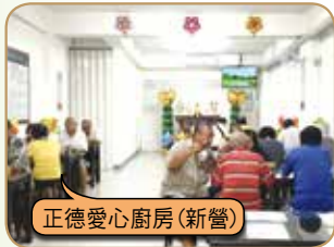
正德愛心廚房(新營)