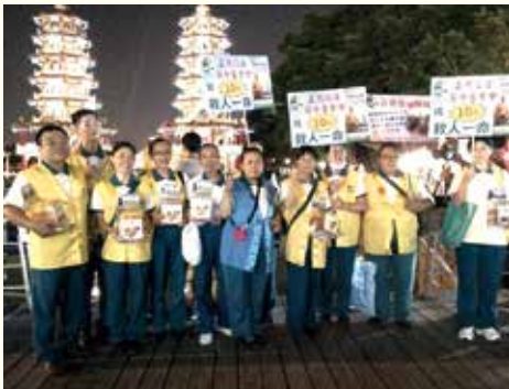
▲配合高雄蓮池潭萬年季志義工們展開勸募活動。