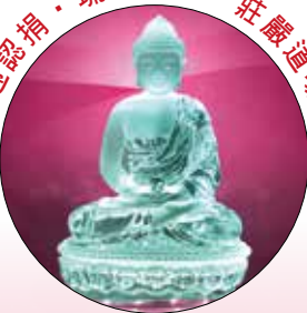
佛像尺寸：7吋高 x 5吋寬

認捐佛像，長年佛光注照，得智慧平安之吉祥之福報。 數量有限，認捐從速，以免向隅。