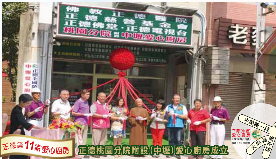
正德第11家愛心廚房

供餐時間：每週一至週五，中午11:30-13:00/晚上17:30-19:00 (週六僅提供饅頭、麵包、飲料等；週日休)