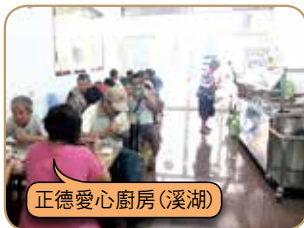
正德愛心廚房(溪湖)