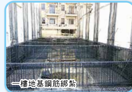
一樓地基鋼筋綁紮