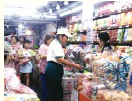
▲萬華分會·社區市場勸募。