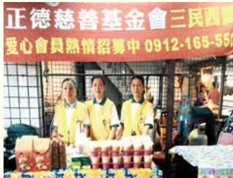
▲三民西區建興市場義賣。