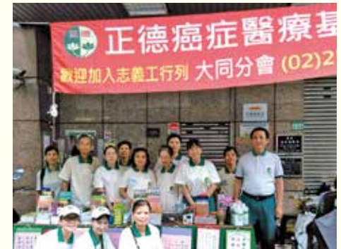
▲大同分會·社區義賣。