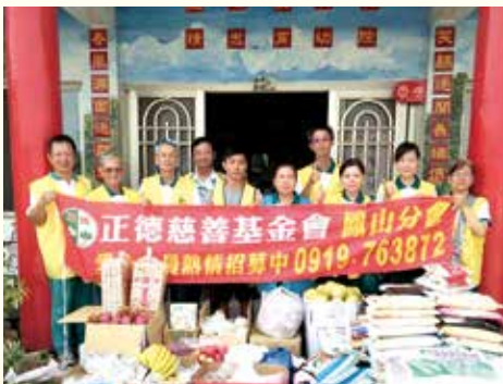
▲鳳山分會關懷精忠育幼院送物資。