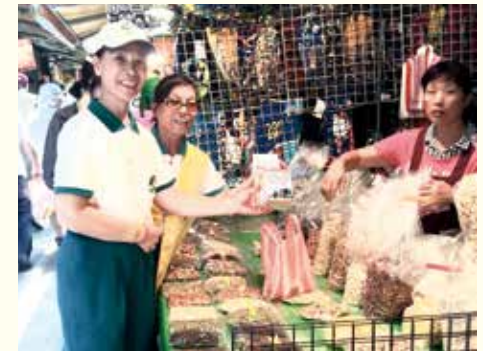
▲景美分會·社區市場勸募及善書發送。