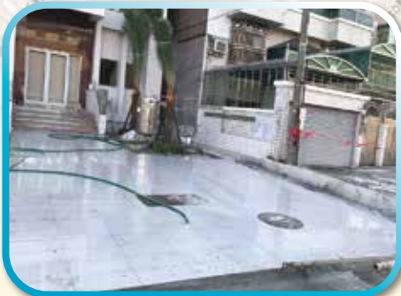
▲拋空石英磚地面施作完成