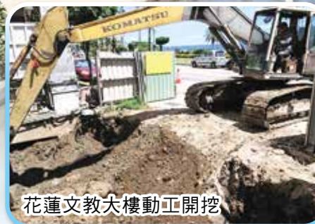
花蓮文教大樓動工開挖