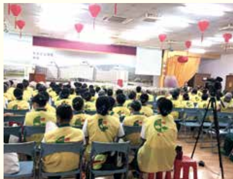
▲高雄總院·每月助念演練課程。