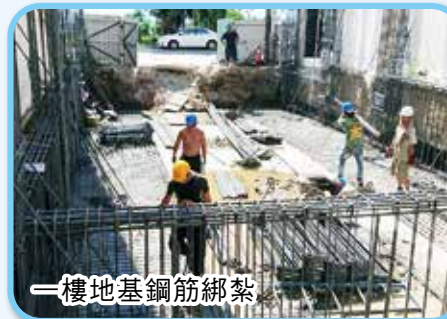
一樓地基鋼筋綁紮