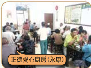
正德愛心廚房(永康)

請大家發心加入愛心廚房會員或建房委員，共襄善舉 廣濟全國各地貧困民眾飲食，福德無量