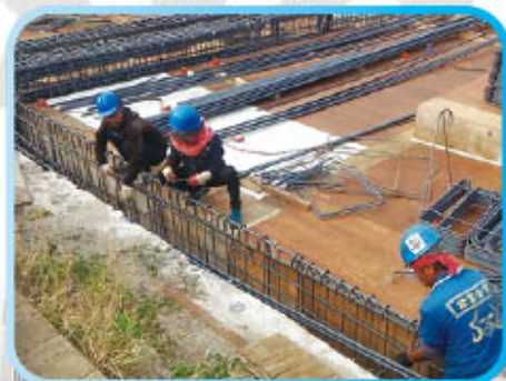
▲ B1F 樑筋綁紮 ▼ 1樓板鋼筋綁紮