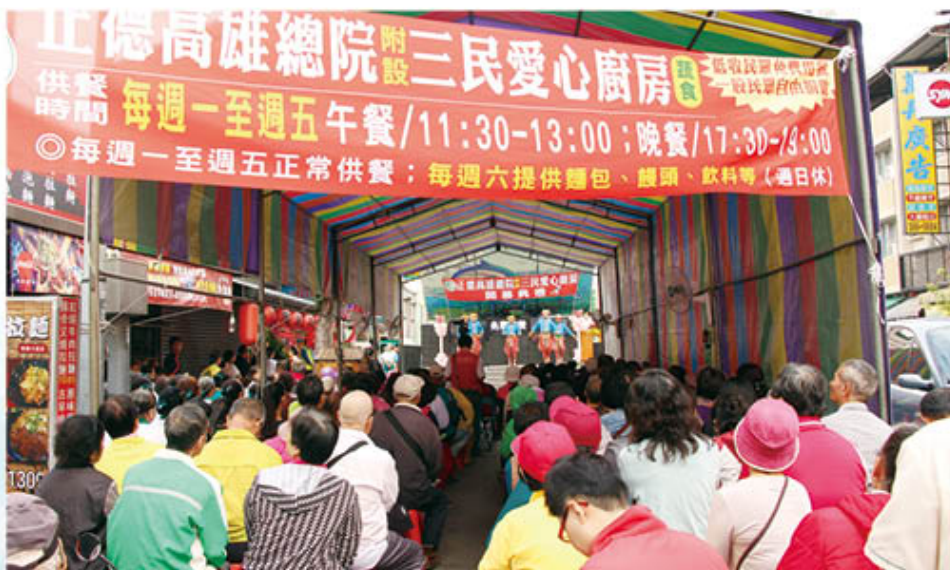
▲三民愛心廚房開幕，民眾前來參加，場面熱絡。