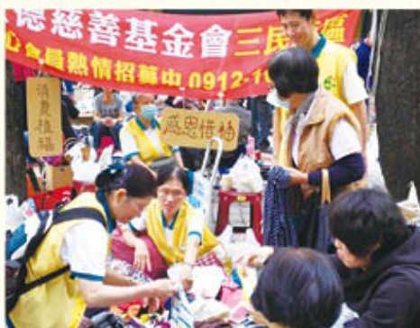
▲三民西區分會·跳蚤市場義賣