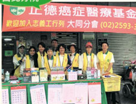
▲大同分會·社區義賣