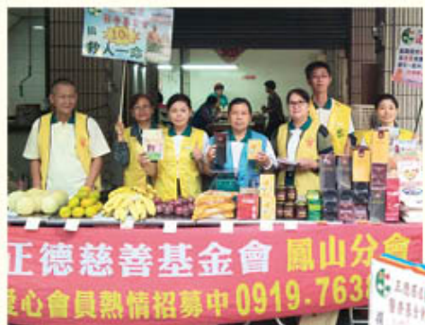
▲鳳山分會·鳳山五甲市場義賣