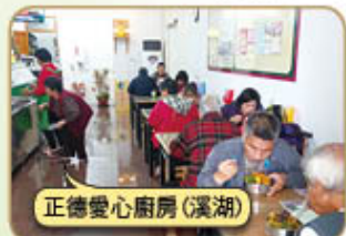
正德愛心廚房(溪湖)

請大家發心加入愛心廚房會員或建房委員，共襄善舉 廣濟全國各地貧困民眾飲食，福德無量