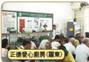
正德愛心廚房(羅東)