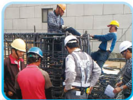
▲ 結構技師查驗鋼筋

工程地點：台中市南屯區文心南五路三段與龍富十五路交叉處 (04) 2382-8199