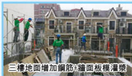
三樓地面增加鋼筋+牆面板模灌漿