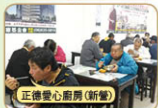
正德愛心廚房(新營)