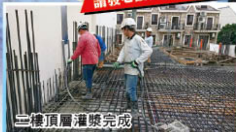
二樓頂層灌漿完成