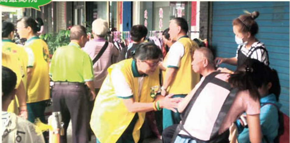
▲鳳山愛心廚房於11/04舉辦小愛變大愛-義診及義剪活動