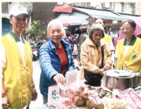
▲景美分會·社區市場義賣