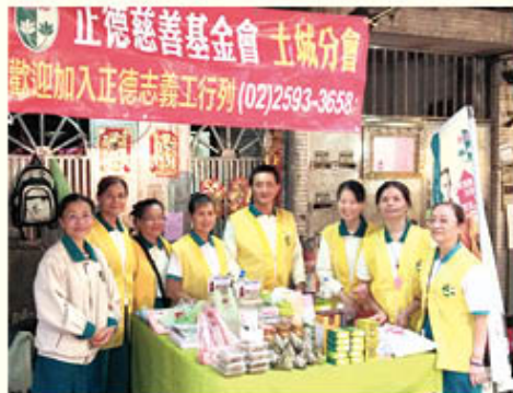
▲土城分會·社區義賣