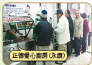
正德愛心廚房(永康)