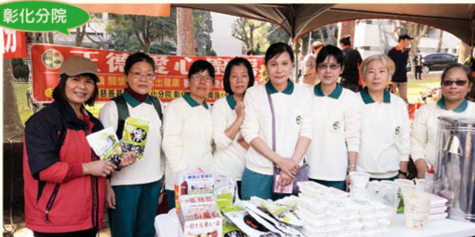
▲彰化分會參與家扶中心園遊會義賣活動