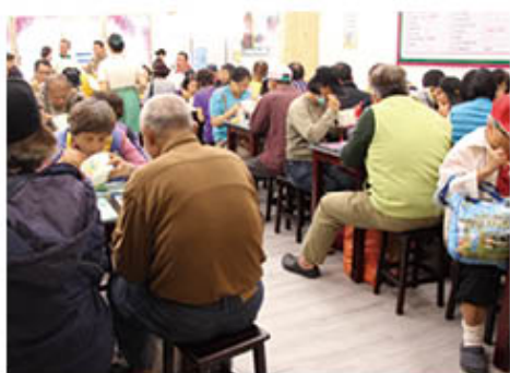
▲三民愛心廚房開幕當天民眾享用健康素食。