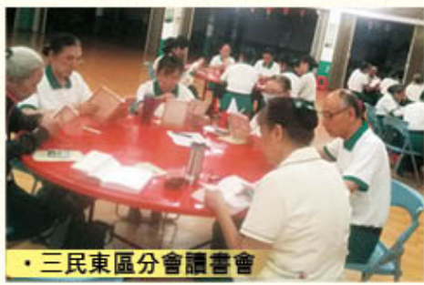
• 三民東區分會讀書會