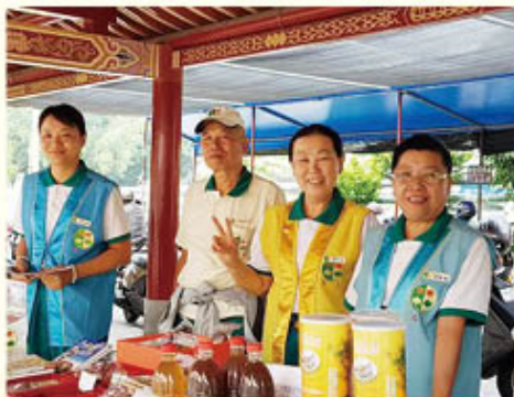
▲仁武、楠梓分會·觀音山風景區義賣及勸募