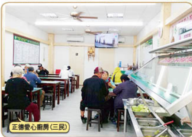
正德愛心廚房(三民)