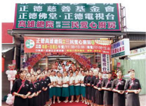
▲三民愛心廚房開幕與會志工們合影。

為讓愛心廚房得以永續經營，長期利益弱勢民眾，正德非常歡迎大家以免費或低價租、售或捐出各地合適店面予正德；或出力來正德擔任志義工；或贊助健康有機的麵條、米粉、米、板條、蔬菜水果、糕點、飲料……等等品質良好的食物與食材與大眾結緣，讓大眾吃出健康，功德無量！