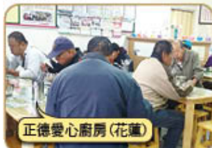
正德愛心廚房(花蓮)