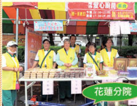
▲花蓮分會·社區市場義賣