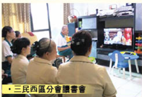
• 三民西區分會讀書會