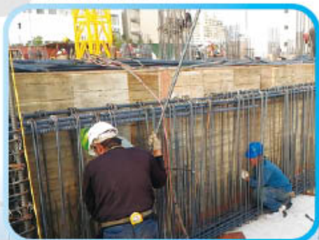
▲ B1F 樑筋綁紮