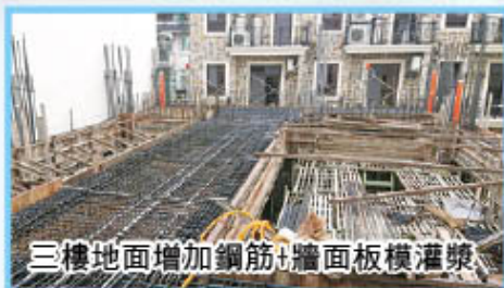
三樓地面增加鋼筋+牆面板模灌漿