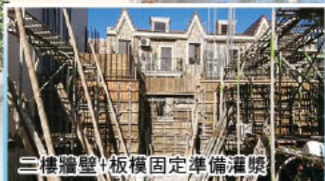
二樓牆壁+板模固定準備灌漿