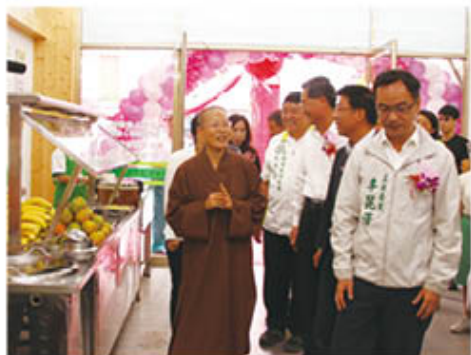
▲演音法師帶領貴賓們參觀三民愛心廚房。

目前愛心廚房自去年8月起，已相繼於員林、宜蘭（羅東）、彰化、屏東、台南、高雄、花蓮、台北（三重）、新營、溪湖、中壢、永康、旗山及我們今天成立的三民共設立十四家愛心廚房。預計未來，要讓愛心廚房在全台灣遍地開花，以每個鄉鎮都至少設立一家為