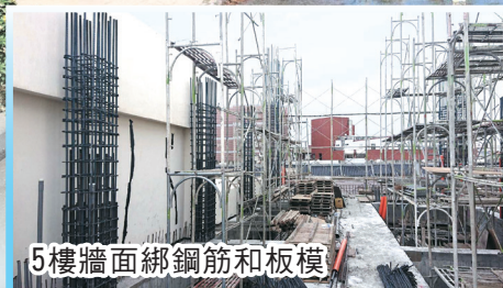
5樓牆面綁鋼筋和板模