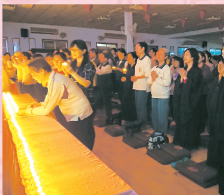
▲元宵節安奉光明燈上燈祈福活動，配合應景猜燈謎，吃元宵，好不熱鬧。