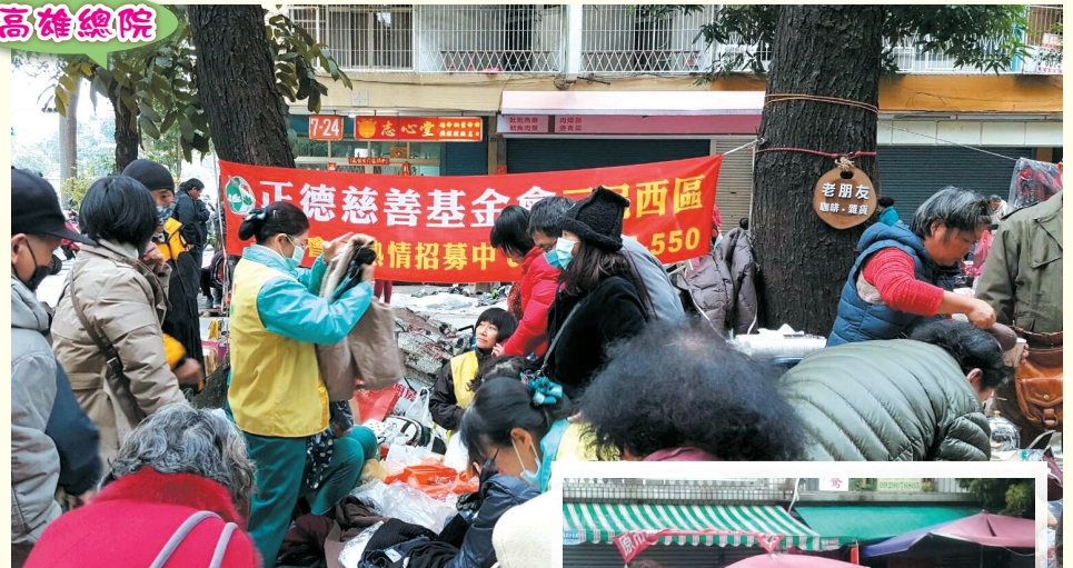
▲三民西區分會·跳蚤市場義賣。