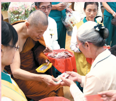
▲勸募座談會·開山和尚與志工結緣吉祥掛飾。