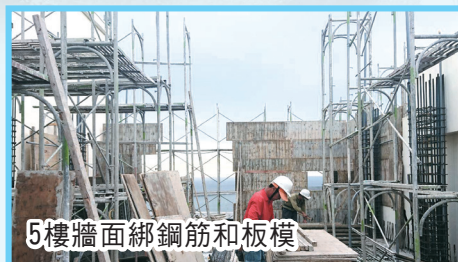
5樓牆面綁鋼筋和板模