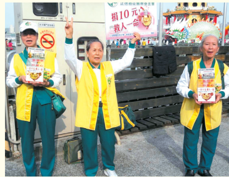
▲三民東區分會·蓮池潭發善書及愛心勸募。