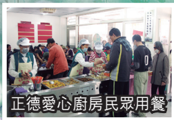
正德愛心廚房民眾用餐