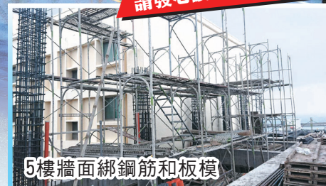
5樓牆面綁鋼筋和板模