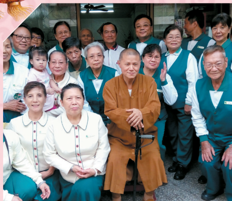
▲開山和尚新春期間至各分會走春，慈悲普照，分會成員莫不法喜。