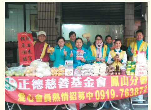
▲鳳山分會·五甲凱旋市場義賣。