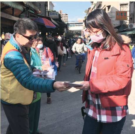
▲內湖分會·善書發送及愛心勸募。