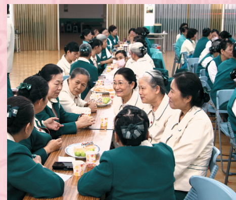
▲新春勸募聯誼座談，相互祝福，期勉彼此道業更精進。