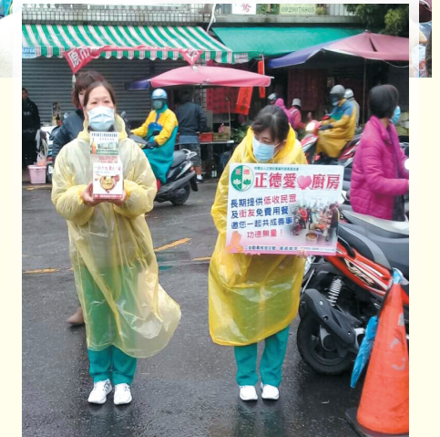
▲三民東區分會·陽明市場發善書及愛心勸募。