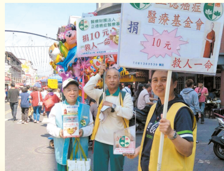
▲仁武分會·旗山老街發善書及愛心勸募。