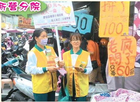
▲六甲市場勸募，善書發送。