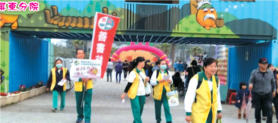
▲公園善書發送及愛心勸募。