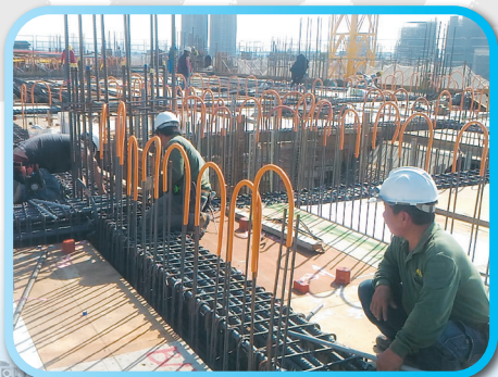
▲ 三樓水電預埋管路 ▼ 三樓頂模板組立