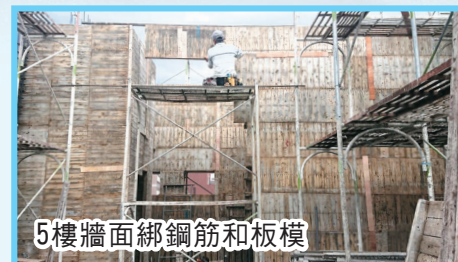
5樓牆面綁鋼筋和板模