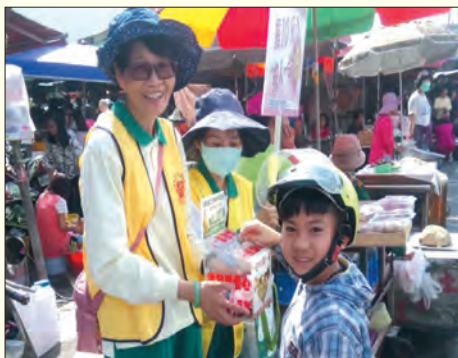
▲大社分會果菜市場勸募，小菩薩特來共襄善舉。