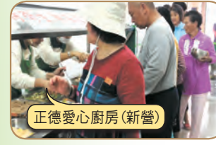
正德愛心廚房(新營)