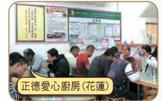
正德愛心廚房(花蓮)