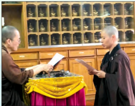
▲觀世音菩薩聖誕日，正德再添戒子。