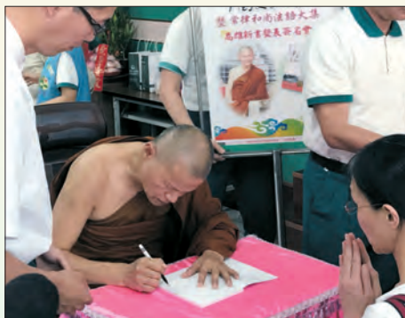
▲《中國文學的哲理暨常律和尚法語大集》簽書會。