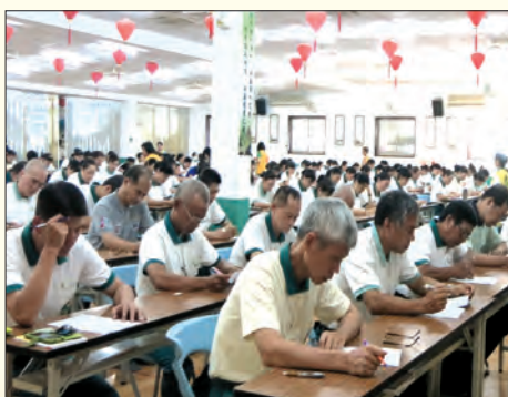
▲志義工平常忙於道務，透過每月佛學考試增長佛學常識。