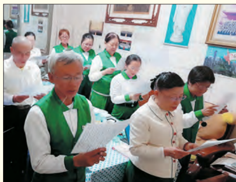
▲仁武、鳥松分會 · 精進讀書會。