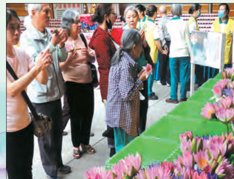
▲大眾虔心請花供佛。