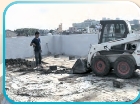
▲4樓及RF露台草皮清除