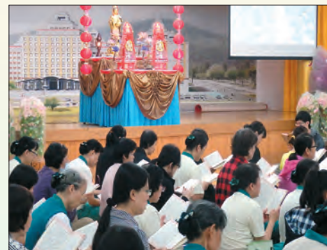
▲觀世音菩薩聖誕法會，大眾虔誠踴躍參加。