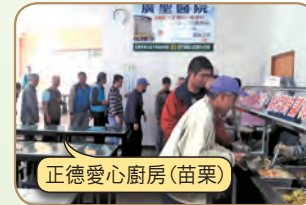
正德愛心廚房(苗栗)

請大家發心加入愛心廚房會員或建房委員，共襄善舉 廣濟全國各地貧困民眾飲食，福德無量