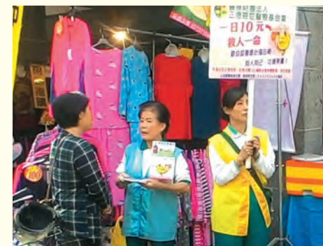
▲志義工於六甲市場進行勸募，讓民眾有機緣種植福田。