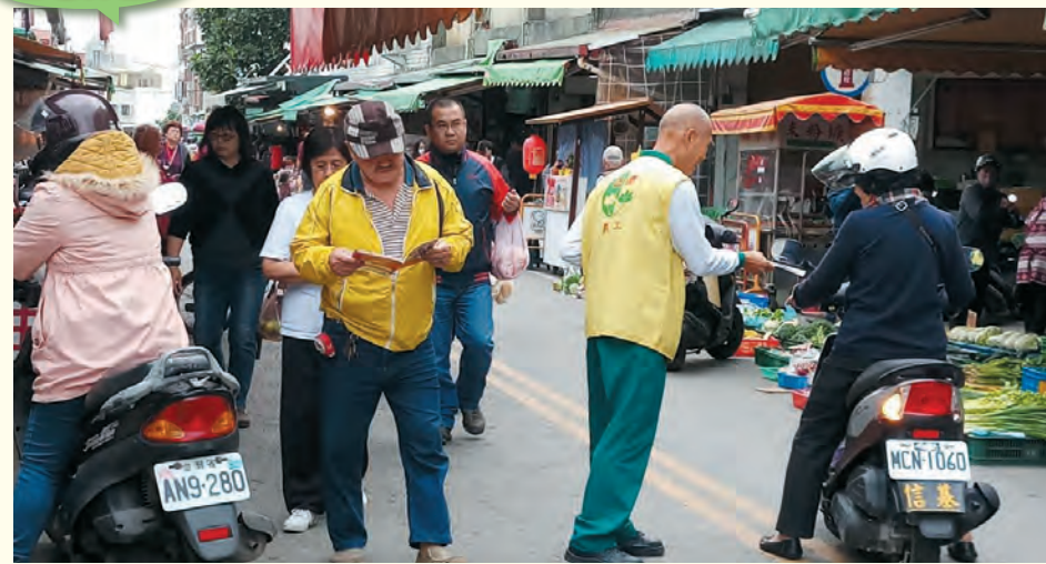
志工於花蓮美崙市場勸募及善書發送。