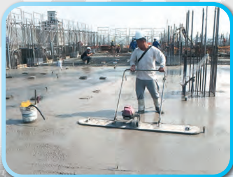
▲ 4樓頂板拍漿整平 ▼ 4樓牆筋及模板組立