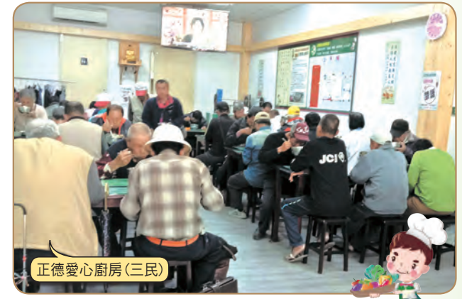
正德愛心廚房(三民)