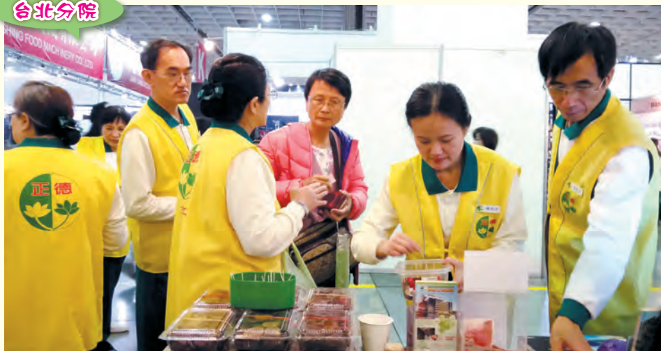
▲為籌措全國廣設「正德愛心廚房」建房基金，志工們參與台北南港世貿「台北素食養生暨健康產業展」設攤義賣。