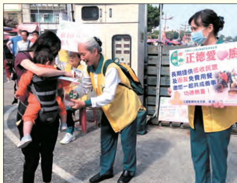
▲三民東區分會 · 蓮池潭發善書及勸募。