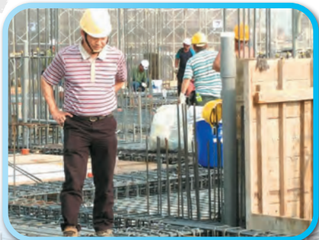
▲ 結構技師查驗鋼筋綁紮