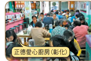
正德愛心廚房(彰化)