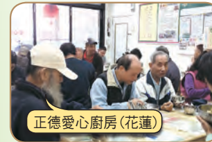
正德愛心廚房(花蓮)