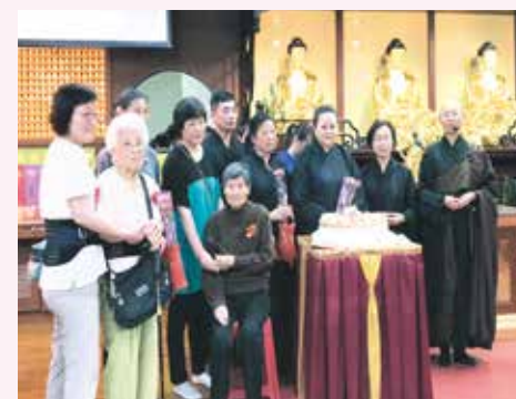
▲帶著母親參加佛誕日，過個別具意義的母親節。