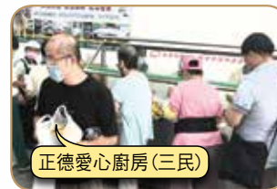
正德愛心廚房(三民)