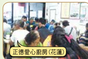
正德愛心廚房(花蓮)