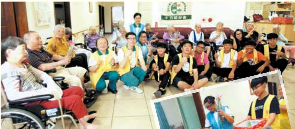
▲五結分會·志義工偕同獎學金受獎學生至和信安養院關懷住民、義剪並與住民歡度母親節活動。