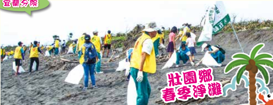
▲志工帶領獎學金受獎同學參與壯園鄉107年度地球日全國春季淨灘活動。