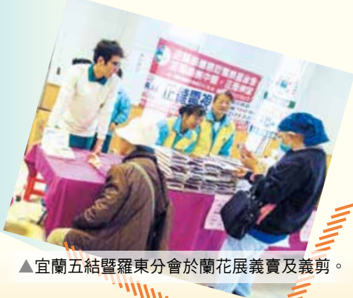
▲宜蘭五結暨羅東分會於蘭花展義賣及義剪。