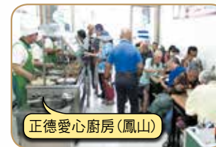
正德愛心廚房(鳳山)