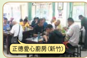
正德愛心廚房(新竹)