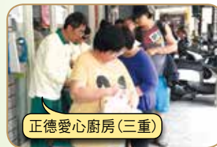
正德愛心廚房(三重)

請大家發心加入愛心廚房會員或建房委員，共襄善舉 廣濟全國各地貧困民眾飲食，福德無量