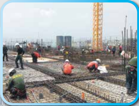
▲ 5樓頂版施工 ▼ 5樓頂版灌漿