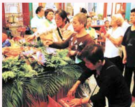
▲佛誕日與會大眾虔敬浴佛。