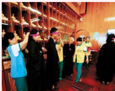
▲舉辦蒙眼聽聲認親活動樂趣無比。