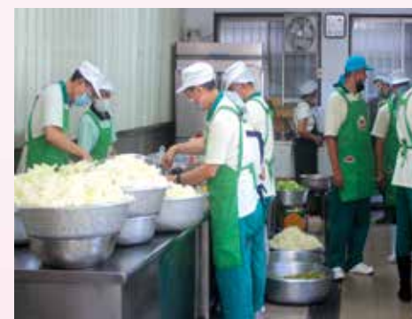
▲為讓長年在廚房辛勞的廚房組媽媽志工們歡度佳節，當天午膳特由男眾師兄掌廚料理。