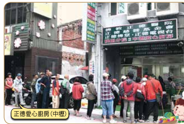
正德愛心廚房(中壢)