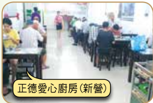
正德愛心廚房(新營)

請大家發心加入愛心廚房會員或建房委員，共襄善舉 廣濟全國各地貧困民眾飲食，福德無量