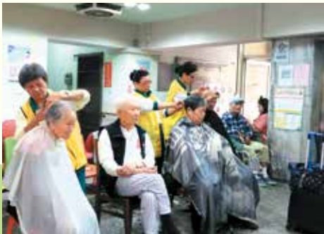
▲萬華分會·社區榮民長青服務處義剪。