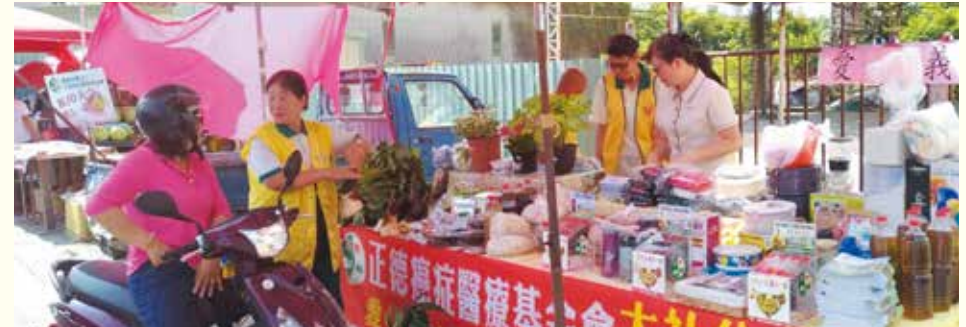
▲大社分會·大社果菜市场勸募義賣。