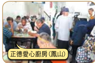
正德愛心廚房(鳳山)