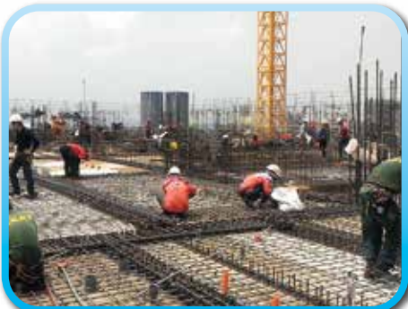
▲ 6樓頂版鋼筋綁紮與水電配管

工程地點：台中市南屯區 文心南五路三段與龍富十五路交叉處 電話：(04) 2382-8199