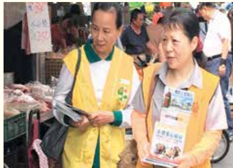
▲內湖分會·社區勸募善書發送。