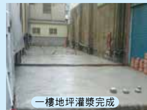
一樓地坪灌漿完成