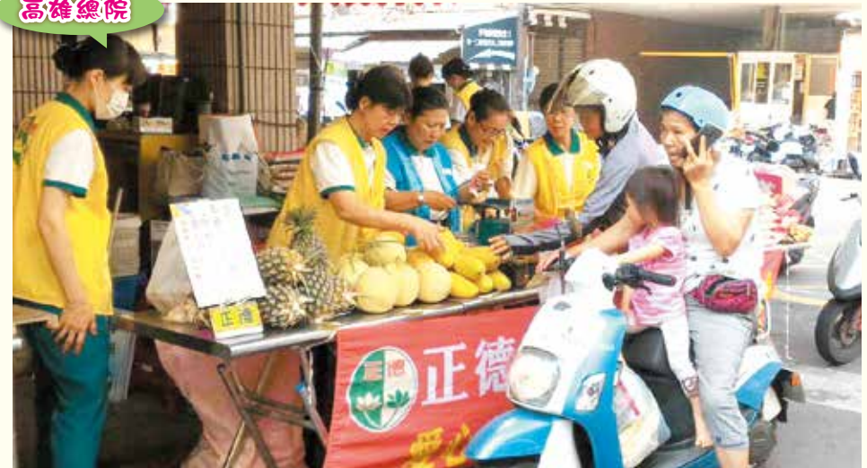
▲鳳山分會·五甲市場義賣。