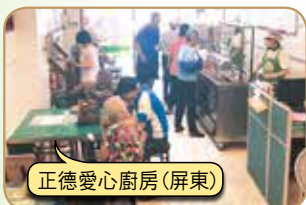
正德愛心廚房(屏東)