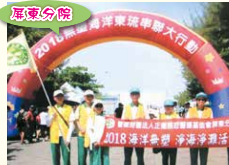
▲響應海洋無塑，志工們參淨灘活動。