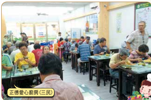
正德愛心廚房(三民)