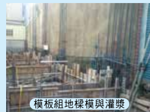
模板組地樑模與灌漿