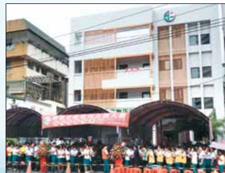
▲正德電視文教大樓落成開幕典禮祈福儀式。