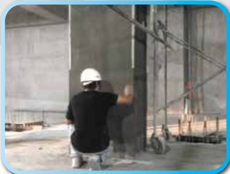
▲ 地下室柱子批水泥 ▼ 6樓模板組立