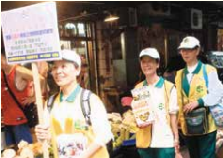
▲新莊分會·社區市場勸募。