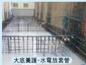
大底養護-水電放套管