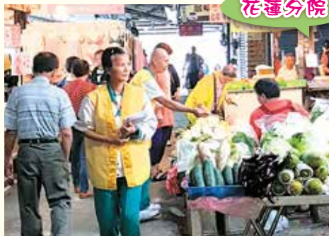
▲志工美崙市場義賣、勸募及善書發放。