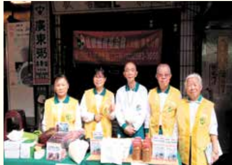
▲景美分會·社區義賣。