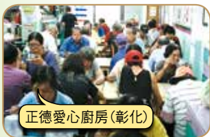
正德愛心廚房(彰化)