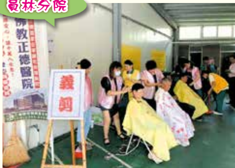
▲員林愛心廚房·舉辦義剪為弱勢民眾及食客們整理門面。