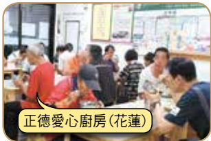
正德愛心廚房(花蓮)