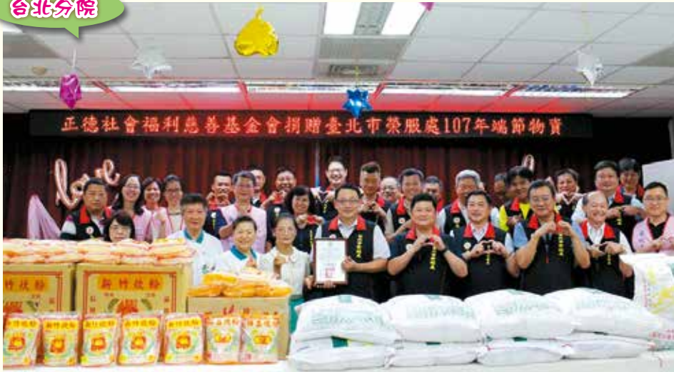
▲端午前夕，台北分院三重分會載運白米450斤及米粉90份，主動前往臺北市榮民服務處，委請代為轉發清寒弱勢榮民眷，使其感受社會關懷，並祝賀其端午佳節愉快。