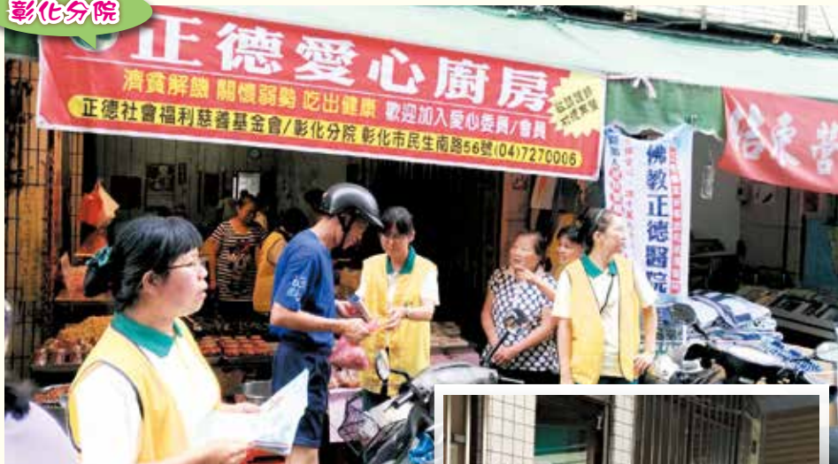
▲社區市場義賣、善書發送。