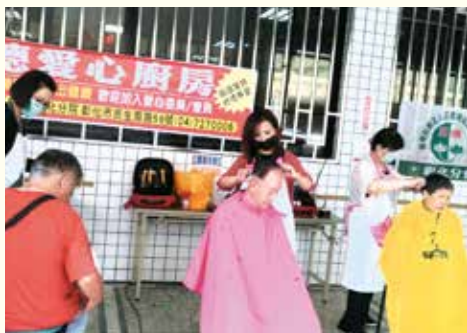
▲彰化愛心廚房·舉辦義剪、二手衣結緣活動，透過服務及分享，為弱勢族群帶來陣陣暖流。