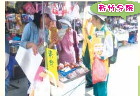
▲志工義賣小推車在社區市場義賣勸募。