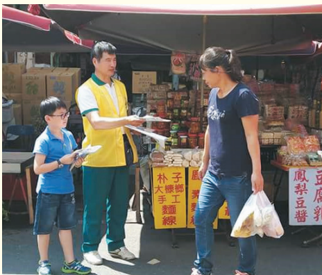
▲大寮分會-五甲瑞隆市場善書發放暨街頭勸募，大菩薩攜著小菩薩發善心勸募及捐款。