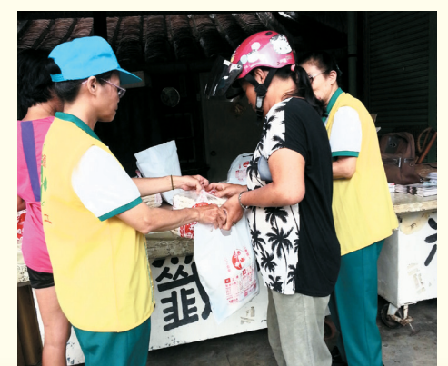
▲屏東萬丹分會-內埔關懷低收入戶發送白米、麵食等物資。