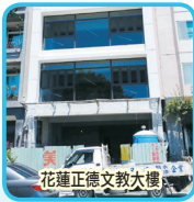
花蓮正德文教大樓