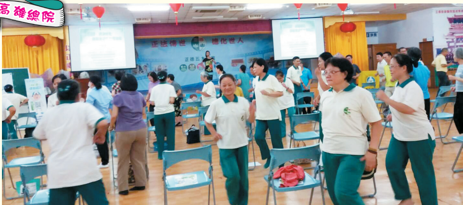
▲高雄總院-認識健康體適能「健康停損 so easy」活動課程，大夥兒動起來。