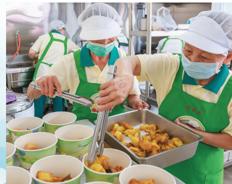
▲香積組志義工忙碌的為活動準備美味素膳。