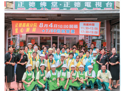
▲嘉義愛心廚房開幕參與志義工合影。