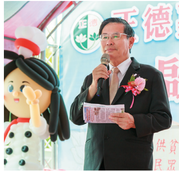
▲嘉義市市長 涂醒哲致詞。