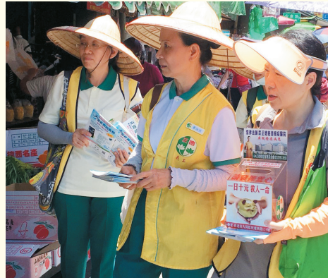
▲內湖分會-社區市場勸募、發善書。