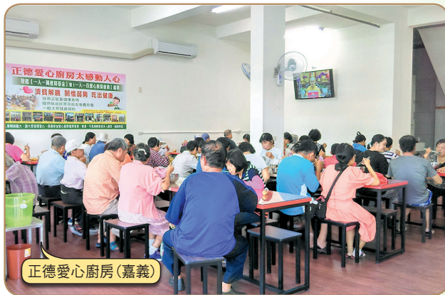
正德愛心廚房(嘉義)