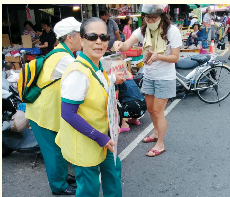
▲三民東分會-陽明市場勸募款。