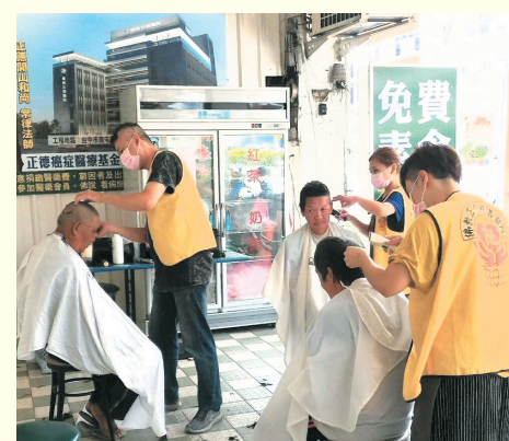
▲屏東分院·愛心廚房義剪活動，為民眾打理門面，個個開心展現清爽的容貌。