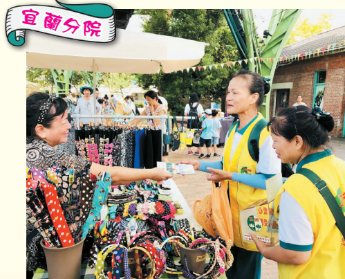
▲羅東分會-羅東運動公園勸募、善書發送及愛心廚房宣導