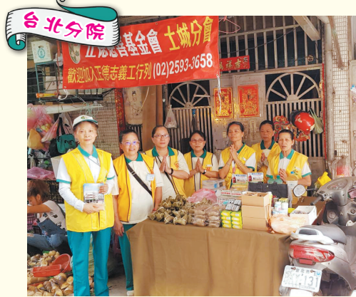
▲土城分會-社區義賣勸募。