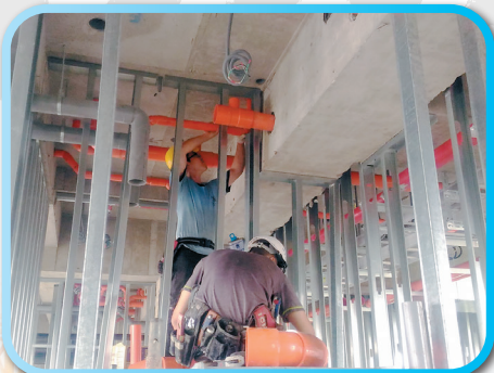
▲ 4樓浴廁排水管施作 ▼ 8樓頂版施工