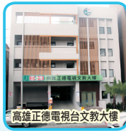
高雄正德電視台文教大樓