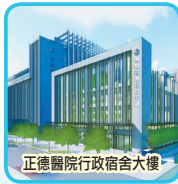
正德醫院行政宿舍大樓