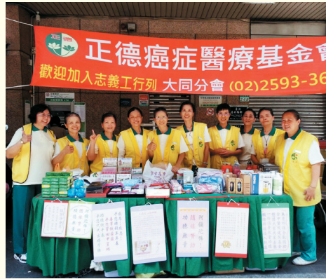
▲大同分會-社區義賣勸募。