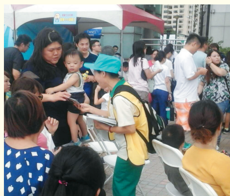
▲大愛隊-三多路新光三越善書發送。