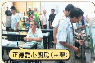
正德愛心廚房(苗栗)