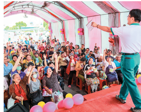
▲大眾熱情參加嘉義愛心廚房開幕-正德志業問答活動，現場民眾踴躍搶答。