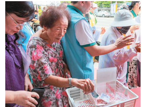
▲嘉義鄉親們踴躍捐款護持正德愛心廚房，愛心不落人後。