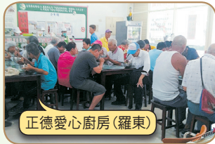
正德愛心廚房(羅東)

請大家發心加入愛心廚房會員或建房委員，共襄善舉 廣濟全國各地貧困民眾飲食，福德無量