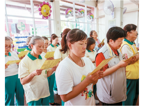
▲嘉義愛心廚房開幕前恭誦〈大悲咒〉祈福。