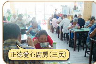
正德愛心廚房(三民)