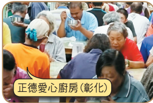
正德愛心廚房(彰化)