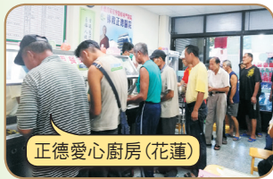
正德愛心廚房(花蓮)