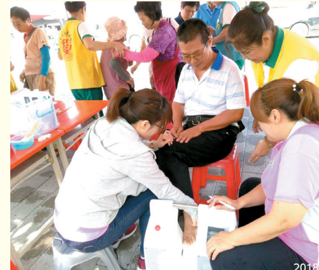
▲萬丹分會-內埔義賣與正德-廣聖醫院「愛鄉親骨密檢查」活動。