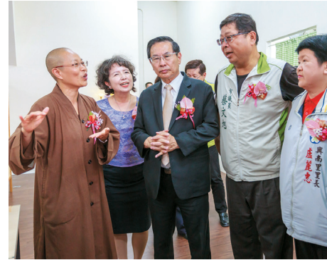
▲演音法師為貴賓們闡述 開山和尚於全國廣設愛心廚房的緣由及理念。