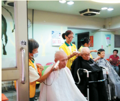
▲萬華分會-榮民服務中心義剪服務。