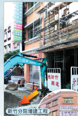
新竹分院增建工程