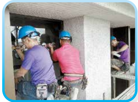
▲ 五樓帷幕玻璃安裝