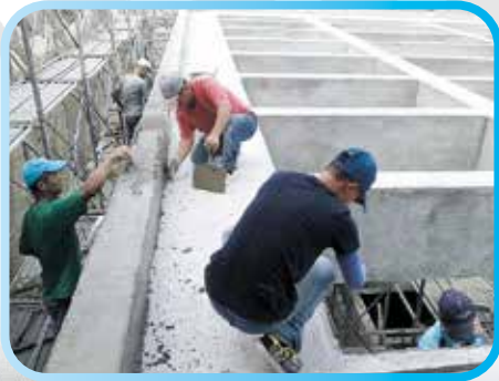
▲ 六樓格子樑抵石子