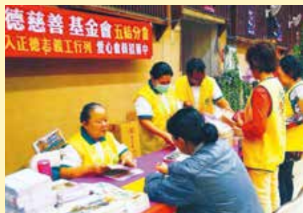
▲五結分會·宜蘭市民活動中心蘭花展義賣