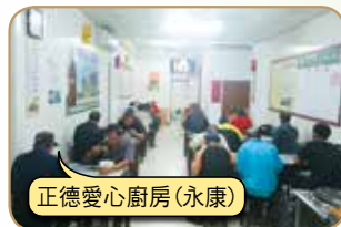
正德愛心廚房(永康)