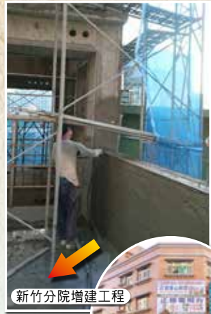
新竹分院增建工程