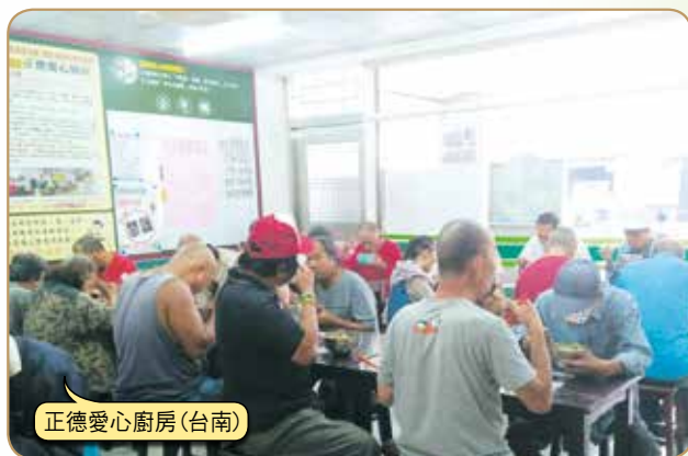
正德愛心廚房(台南)