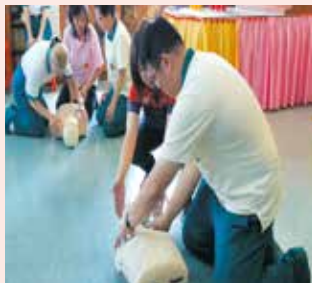
▲屏東志義工CPR自救互救訓練