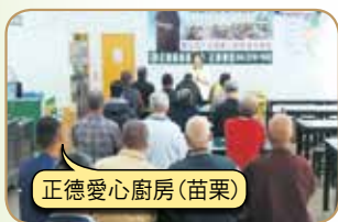
正德愛心廚房(苗栗)