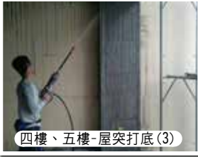
四樓、五樓-屋突打底(3)