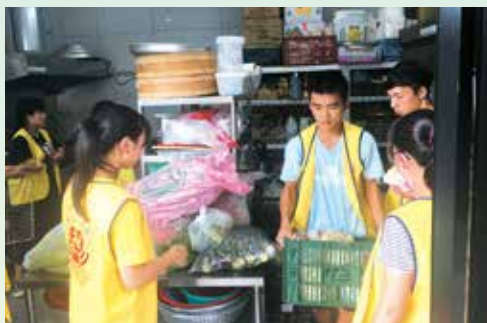
▲體驗正德愛心廚房供餐備餐服務。