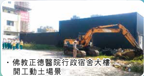
• 佛教正德醫院行政宿舍大樓開工動土場景