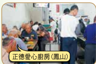
正德愛心廚房(鳳山)