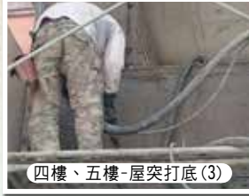
四樓、五樓-屋突打底(3)