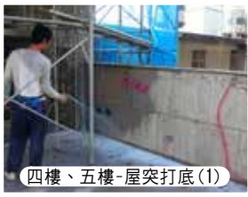
四樓、五樓-屋突打底(1)