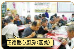
正德愛心廚房(嘉義)

請大家發心加入愛心廚房會員或建房委員，共襄善舉 廣濟全國各地貧困民眾飲食，福德無量