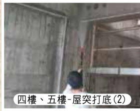
四樓、五樓-屋突打底(2)