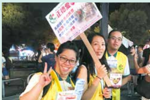
▲社區公園勸募及善書發送。