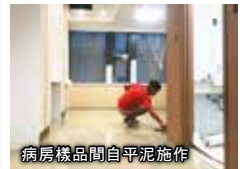
病房樣品間自平泥施作