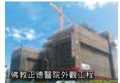
佛教正德醫院外觀工程