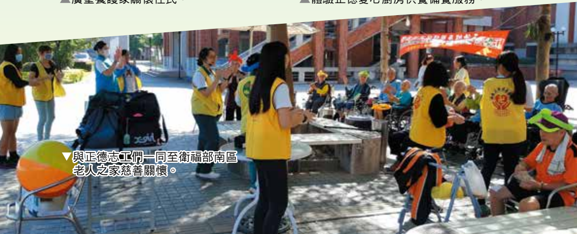
▼與正德志工們一同至衛福部南區老人之家慈善關懷。