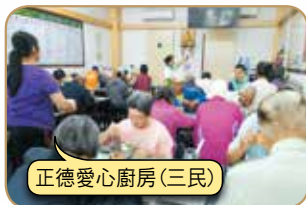
正德愛心廚房(三民)