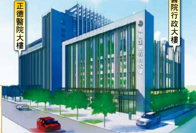
正德醫院行政大樓