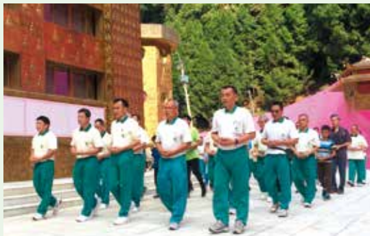
▲彰化分院志義工埔里大佛山虔敬朝山活動