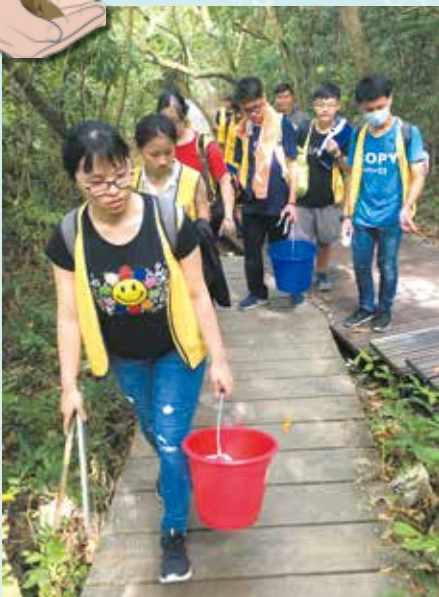
▲高雄市柴山淨山活動。