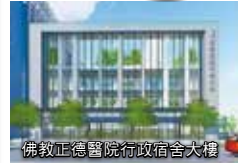
佛教正德醫院行政宿舍大樓