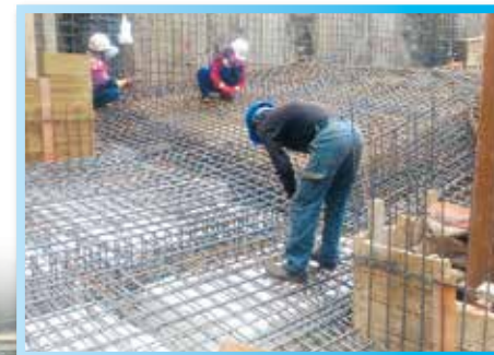
▲ 行政大樓車道鋼筋綁紮