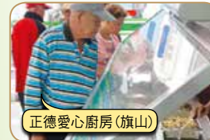
正德愛心廚房(旗山)