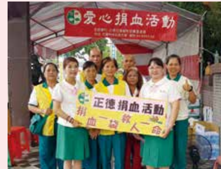
▲響應愛心捐血活動，志工們踴躍參與。