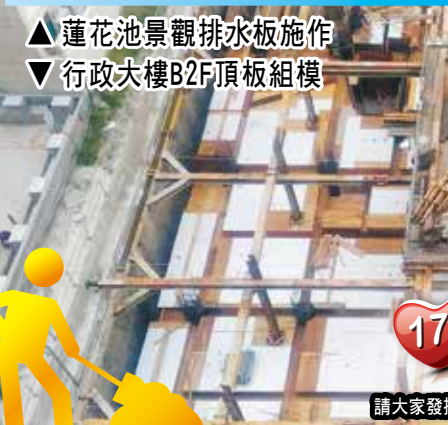
▼ 行政大樓B2F頂板組模