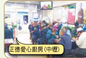
正德愛心廚房(中壢)

請大家發心加入愛心廚房會員或建房委員，共襄善舉 廣濟全國各地貧困民眾飲食，福德無量