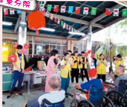
▲志工帶領獎學金學生們訪視內埔榮民之家陪伴關懷活動，體悟社會服務的意義與重要性。