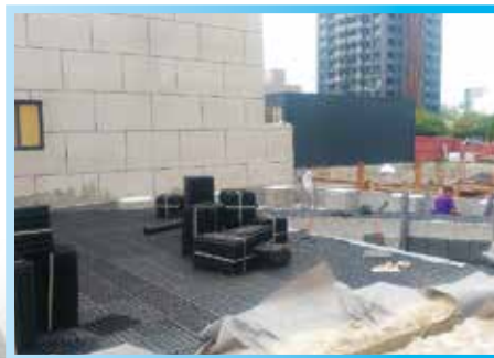
▲ 蓮花池景觀排水板施作