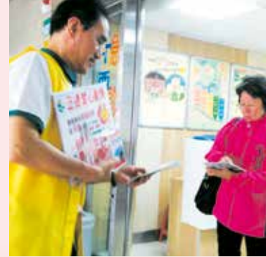
▲萬華分會-勸募及善書發送。