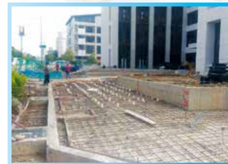
▲ 1樓人行道鋪面鋼筋綁紮