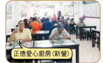
正德愛心廚房(新營)