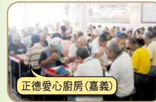
正德愛心廚房(嘉義)