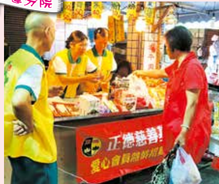
▲美崙市場愛心義賣活動。