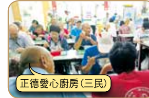
正德愛心廚房(三民)