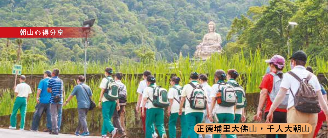
正德埔里大佛山，千人大朝山