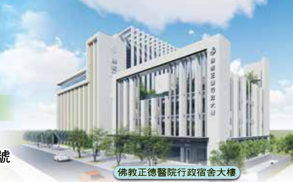
佛教正德醫院行政宿舍大樓

工程地點： 台中市南屯區文心南五路三段100號 電話：(04) 2382-8199