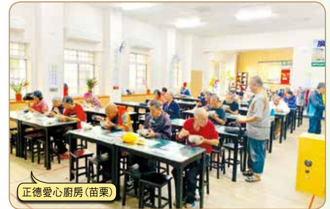
正德愛心廚房(苗栗)