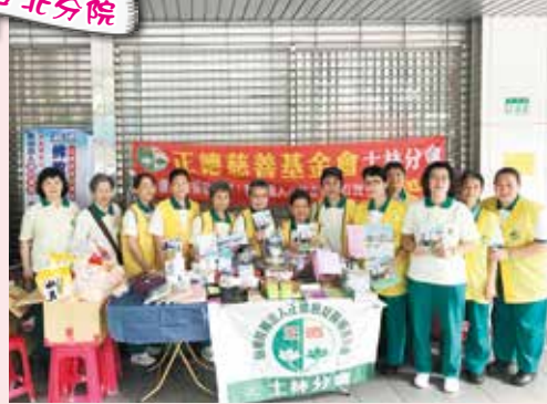
▲士林分會-社區義賣及勸募。